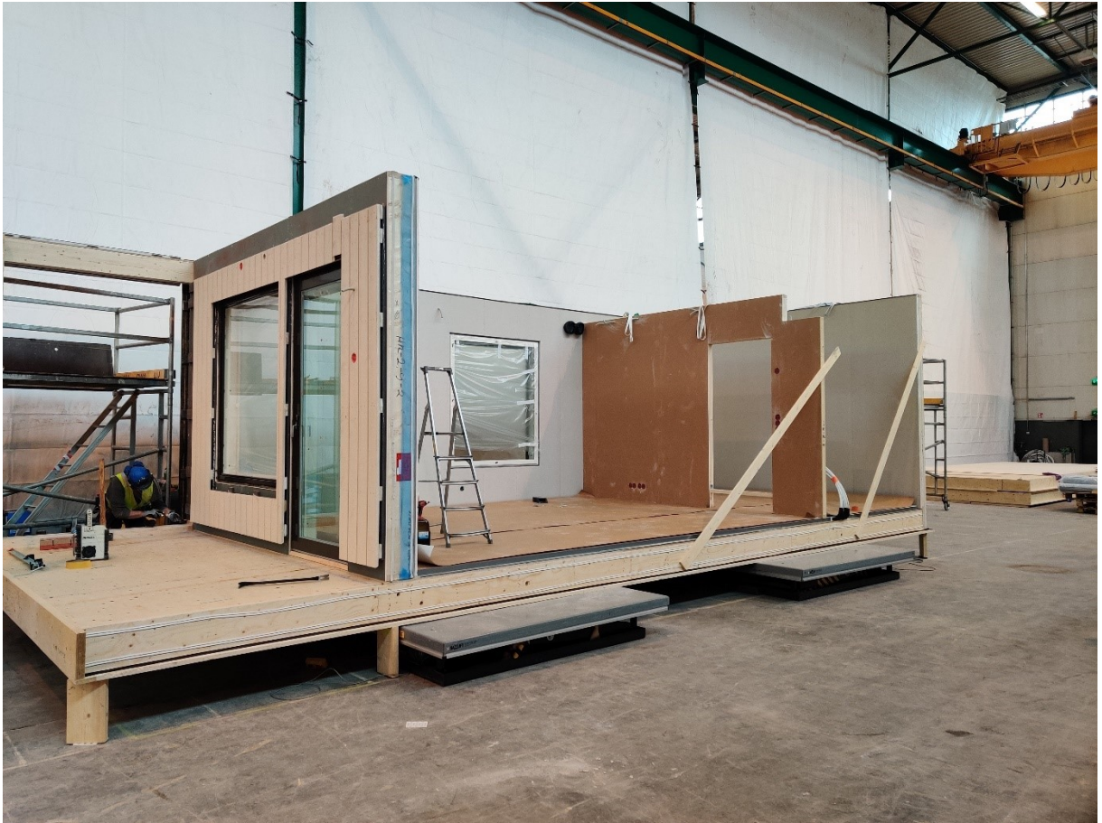
Kuva 7. Pilottihankkeen tilaelementtuotannon kokoonpanopaikka (kuvan 5 moduuli 2).