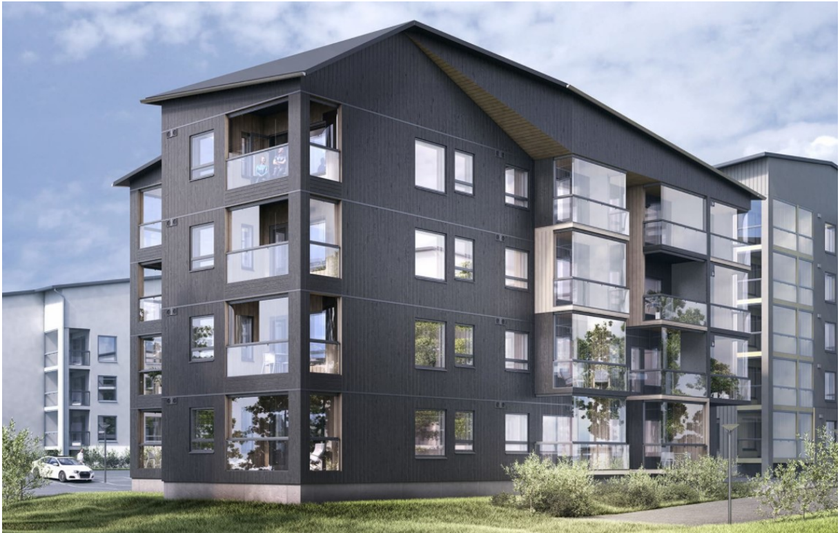
Kuva 1. 3D-havainnekuva Niemenrannan Rantapuistosta.