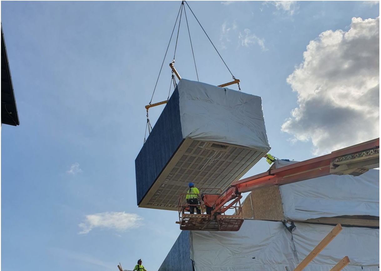
Kuva 3. Pilottihankkeen tilaelementtien työmaa-asennus.