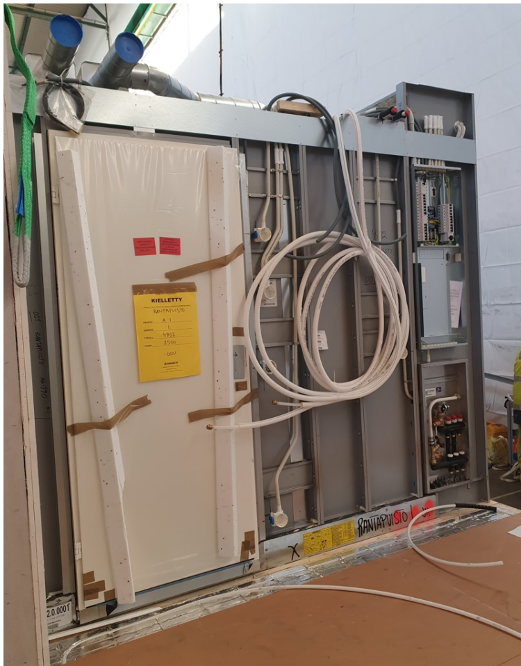
Kuva 6. Pilottihankkeen kylpyhuone-elementti.

Kylpyhuone-elementillä tarkoitetaan osiin tilaelementteihin asennettavaa sisäpinnoiltaan valmista ja kalustettua valmiskylpyhuonetilaa. Kylpyhuone-elementti esitetty kuvassa 6. Kylpyhuone-elementit olivat rungoltaan teräsohutlevyrakenteisia. Elementteihin oli integroitu valtaosa huoneistojen talotekniikkalähdöistä sekä talotekniikkahormi, joka yhdessä alempien sekä ylempien kerrosten hormien kanssa muodostivat koko rakennuksen pystysuunnassa lävistäviä hormikuiluja. Kylpyhuone-elementtiin kuului talotekniikkalähtöjen läpiviennit osastoidusta talotekniikkahormista huoneiston puolelle.