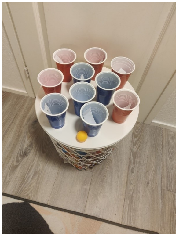
Kuva 2. Kuppipeli rastipiste.