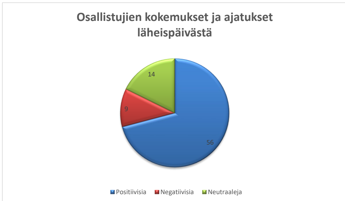
Taulukko 1. Osallistujien kokemukset ja ajatukset.

Neutraaleja kokemuksia ja ajatuksia ilmeni aineistossa kokonaisuudessaan esille 14 kappaletta. Kokemukset jaoteltiin neutraaleihin, koska kaikissa esiintyi sana ”ihan”: ”ihan kiva idea”, ”ihan mukavaa ajanviettoa”. Lisäksi neutraalit ajatukset sisälsivät yleistä pohdintaa läheispäivästä, kuten että mitä ohjelmaa läheispäivässä on ja millaista porukkaa tulee paikalle. Taulukko 1. havainnollistaa osallistujien kokemuksia ja ajatuksia kokonaisuudessaan.