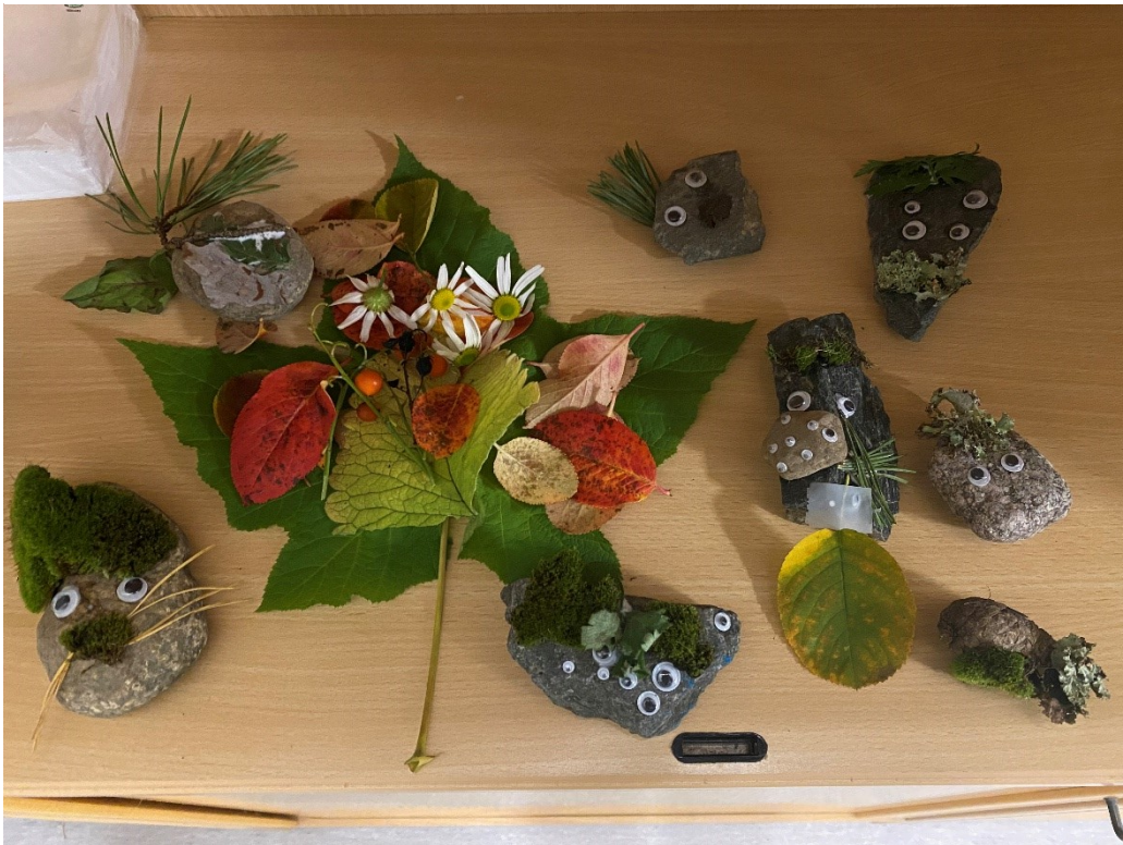
Kuva 1. Askartelupisteen luontohahmot.

Sisätiloissa pidetty ”kuppipeli”-rasti testasi osallistujien motorisia taitoja (kuva 2). Lisäksi se sisälsi kysymyksiä ja tehtäviä, joissa osallistuja pääsi heittäytymään ja vastaamaan itseään tai mukanaan olleita läheisiä/läheistä koskeviin kysymyksiin. Kuppipelissä muovisia kuppeja oli aseteltu pöydälle ja jokaisen kupin sisällä oli tehtävä- tai kysymyslappu. Osallistujien tuli heittää muovista palloa kuppiin ja suorittaa kupissa oleva tehtävä tai vastata kysymykseen. Tehtävät olivat yksinkertaisia ja leikkisiä. Tehtäviä olivat: ”Kätelkää toisianne”, ”Pelatkaa kivi, paperi, sakset -peli”, ”Esitä jotakin eläintä ja toisen pitää arvata mitä eläintä esität” sekä