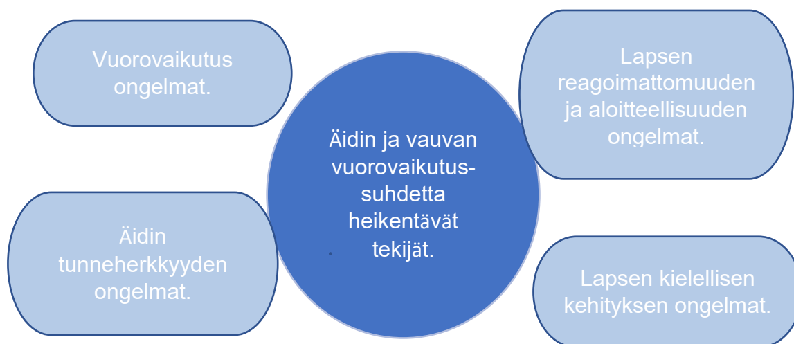
Kuvio 1. Äidin ja vauvan vuorovaikutussuhdetta heikentävät tekijät.