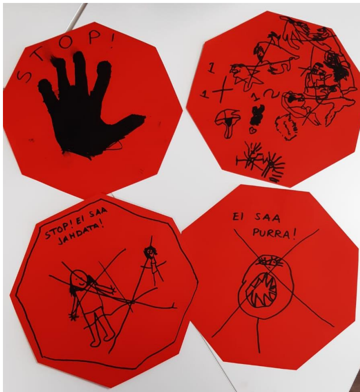
Kuva 4. Kiusaamisen kieltäviä merkkejä.