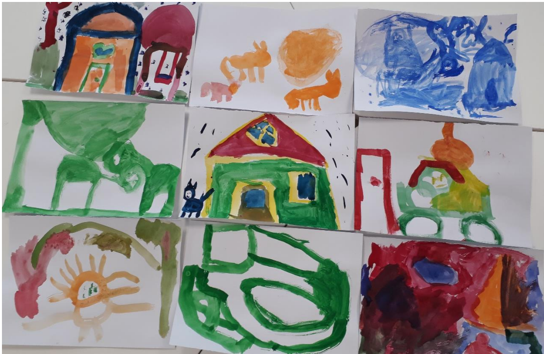
Kuva 2. Esimerkkikuva turvapaikoista.

Kolmannella kerralla harjoiteltiin vuorovaikutustaitoja, toisten huomioon ottamista, vastavuoroisuutta, ystävällisyyttä ja oman vuoron odottamista erilaisten leikkien avulla. Vastavuoroisuutta ja ystävällisyyttä harjoiteltiin pohtimalla, mitä hyviä sanoja voisi kaverille sanoa sekä sen jälkeen pareittain sanomalla vuorotellen toiselle hyviä asioita. Neljännellä kerralla harjoiteltiin ja pohdittiin yhdessä toimimista ja leikkimistä eli kaveritaitoja sekä ystävyyttä. Leikkipadassa keitettiin yhdessä hyvän leikin keittoa, jonne jokainen sai laittaa mausteeksi jonkin asian, mikä tekee leikistä kaikille kivan. Hyvän ystävän tunnusmerkkejä pohdittiin omien ystävyiden supervoimien kautta. Ystävyiden tunnusmerkeistä kiinnipitämiseksi tehtiin ”kättä päälle -sopimus” painamalla kädenjäljet paperille (kuva 3). Viimeinen kerta koostui harjoituksista, joissa pohdittiin ristiriitojen selvittelyä ja kaikkien mukaan ottamista sekä kiusaamista ja sen ehkäisemistä. Teemoja pohdittiin hyödyntäen pöytäteatteria, jonka aiheena oli leikin ulkopuolelle jättäminen. Esityksen jälkeen aiheesta keskusteltiin yhdessä ja lapset saivat pareittain piirtää kieltomerkit kiusaamiselle (kuva 4). Lopuksi pidettiin pienet juhlat, jossa tanssittiin, juotiin mehua ja lapset saivat omalla nimellä varustetut mitalit muistoksi osallistumisesta (kuva 5).