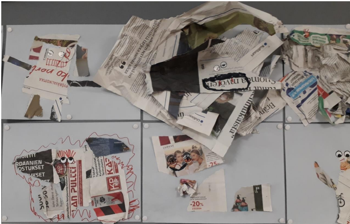
Kuva 1. Esimerkkikuva kiukkuolioista.

Ensimmäisellä kerralla tutustuttiin erilaisiin tunteisiin sekä harjoiteltiin tunne- ja itsesäätelytaitoja, kuten rauhoittumista ja keskittymistä. Tunteisiin tutustuttiin draamaleikin ja musiikin keinoin. Lapset saivat kokeilla viiden eri tunteen ilmaisua liikunnallisissa draamaleikissä sekä tutkia soittimien avulla, miltä eri tunteet kuulostavat. Toisen tuokion aihe oli tutkia kiukun tunnetta sekä harjoitella rauhoittumista ja rentoutumista. Kiukkua sai kokeilla ja tutkia kiukuttelumusiikin säestämänä repimällä sanomalehtiä silpuksi. Silpusta jokainen sai askarrella itselleen kiukkuolion (kuva 1). Kiukuttelun jälkeen harjoiteltiin rentoutumista kehollisin keinoin sekä tehtiin mielikuvaharjoitus omasta turvapaikasta. Lopuksi omista turvapaikoista maalattiin kuvat (kuva 2).