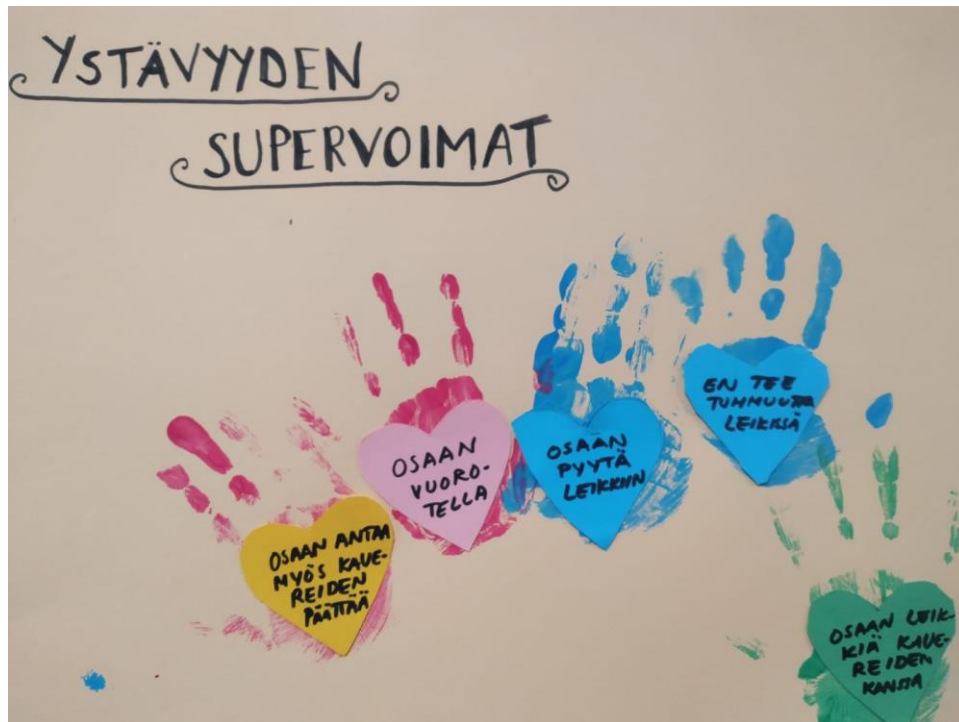
Kuva 3. Ystävyiden supervoimia.