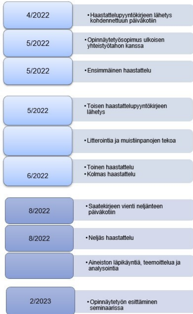
Kuvio 2. Opinnäytetyöprosessin toteutuminen