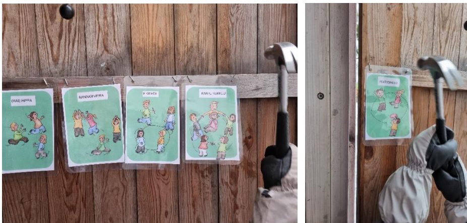
Kuvia pihapelikorttien paikoilleen laittamisesta varaston oveen.