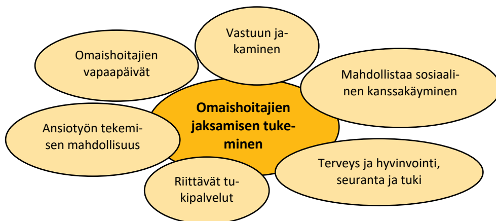
Kuvio 1. Omaishoito ja perhehoito. Omaishoitajan jaksamisen työkalupakki. (Terveys- ja hyvinvoinnin laitos Ikääntyminen 2023, muokattu.)

Sosiaali- ja terveysministeriön tiedotteessa (2015) käsitellään omaishoitajien jaksamiseen, hyvinvointiin ja terveystarkastuksiin liittyviä asioita. Hyvinvoinnin haasteita voivat olla unen riittävyys ja laatu sekä ergonomia. Työikäisillä näiden lisäksi koetaan haasteena työn ja omaishoitajuuden yhdistäminen ja iäkkäämmillä omaishoitajilla haasteena voivat olla heidän pitkäaikaissairautensa ja toimintakyvyn heikkeneminen. On tärkeää tunnistaa omaishoitajien sairaudet, tuen tarve ja jaksamisen ongelmat. Huomioitta jättämisen riskit voivat olla omaishoidon laadun huononeminen ja omaishoitajan terveydelliset ongelmat.