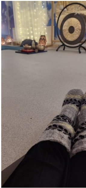
Kuvio 9: Loppusyksyn selkäjooga-tunti.