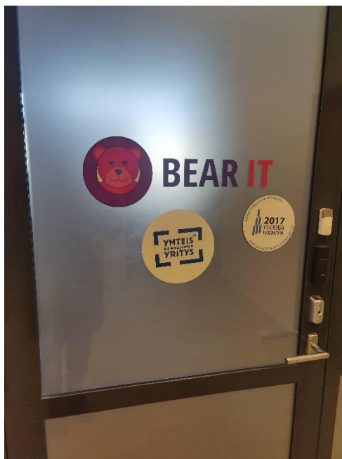
Kuvio 6: Vihdoin toimistolla!

Tällä viikolla käsitellyssä olevan teeman (ammatillinen kunto) näkökulmasta tällaiset tiimipäivät ovat todella hyödyllisiä ja antavat minulle virtaa ja intoa taas etänä tehtävään työhön. Mukava avata välillä BearIT:n toimiston ovi! (kuvio 6.)