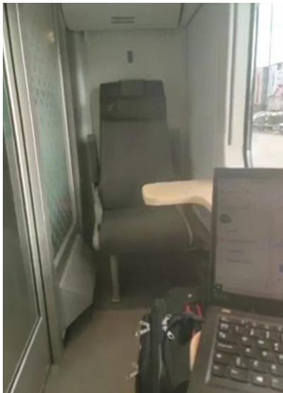
Kuvio 5: Matkalla kohti Tamperetta.

Tänään olikin hiukan erilainen työpäivä, kun iltapäivällä suuntasin junalla kohti Tamperetta ja BearIT:n työllisyyspalveluiden tiimipäiviä. (Kuvio 5.) Todella mukava tavata työkavereita pitkästä aikaa kasvotusten. Luvassa on kahden päivän ajan työn kehittämiseen liittyviä asioita ja toisaalta rentoakin yhdessäoloa. Keskiviikon työpäivä piti sisällään myös asiakkaiden tapaamisia ja valmennusprosessin hiomiseen liittyviä asioita.