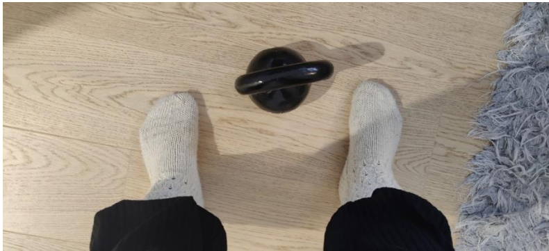
Kuvio 7: Kahvakuula käyttöön?