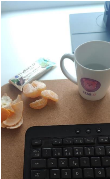
Kuvio 3: Välipalaa työpisteellä.