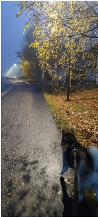
Kuvio 8: Varhainen aamulenkki.

Aamu alkoi jo melko rutiiniksi muodostuneen aamukävelyn kautta. Ajatukset kohti työpäivää! (Kuvio 8)