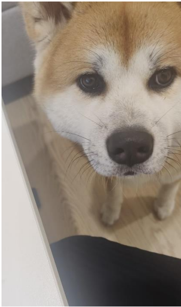
Kuvio 4: Tauon paikka?

Eilisen pohdinnoista jäin todella vielä miettimään aivoergonomiaa. Olenko riittävän tarkka huomaamaan signaalit työ- ja opiskelukuorman osalta omassa arjessani? Huomaanko varmasti, jos käynnissä on liian monta asiaa. Mielestäni olen ollut tässä melko hyvä, ja olen pystynyt esimerkiksi jaksottamaan opintoja siten, että liian monta samantyyppistä (esseet tai muut kirjalliset aikaa vievät työt) ei ole samanaikaisesti työnalla. Hyödynnän reilusti opiskelussa toista deadlinea, jos ensimmäinen tulee liian pian. Näin oman opiskelurytmin hallinta onnistuu hyvin ja yhdessä työn kanssa kuormasta ei tule liian rankkaa. Hyvä muistutus joka tapauksessa se, että koko ajan on oltava tarkkana siinä, jos asioita on liikaa työnalla. Minulla stressi näkyy lyhyenä pinnana, huonompina unina tai mahdottomuutena keskittyä yhteen asiaan rauhassa.