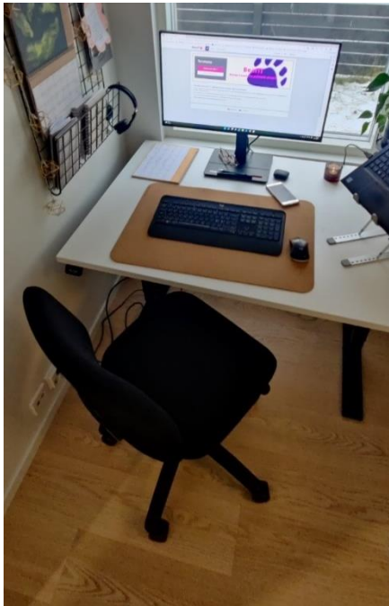
Kuvio 2: Etätyöpisteeni.

Tämä on kiinnostavaa näin etänä tehtävässä työssä, kun jokainen on kuitenkin omalla koneellaan ja yhteiseen ymmärrykseen ei välttämättä edetä puheen kautta. Saarikivi (2020, 80) toteaa, että digiajassa työtiimien tulee kyetä työskentelemään yhdessä siten, että se tukee hyvää yhteistyötä ja ongelmanratkaisua. Olisikin tärkeä oppia tuntemaan työtiimin sisällä toisten työskentelytavat. Parhaimmillaan Saarikiven (2020, 80) mukaan kollektiivinen älykkyys näyttäytyy tiimin yhteistyön tuloksena ja vahvana ongelmanratkaisuna.