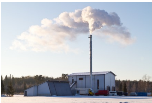
Kuva 1. Kristiinankaupungin hakelaitos

Kristiinankaupungin hakelaitos on vuonna 2016 valmistunut lämpölaitos, jossa on Laatukattila Oy:n kaasutuspolttobiokattila. Kristiinankaupungin hakelaitoksen biokattilan nimellisteho on 5,0 MW ja pääsääntöisenä polttoaineena toimii hake. Hakelaitoksen polttoainevarasto on 600 kuutiometriä ja polttoainevarastossa polttoaineenkuljettimena toimivat tankopurkaimet. Kristiinankaupungin hakelaitos kuuluu Kristiinankaupungin kaukolämmön erillisverkkoon, johon kuuluu myös toinen lämpölaitos. Erillisverkon toinen lämpölaitos käyttää polttoaineenaan kevyttä polttoöljyä. Kevyttä polttoöljyä käyttävä lämpölaitos toimii Kristiinankaupungin kaukolämpöverkossa apukattilana sekä varalaitoksena hakelaitoksen ollessa käyttökatkossa. Ohessa kuva laitoksesta.