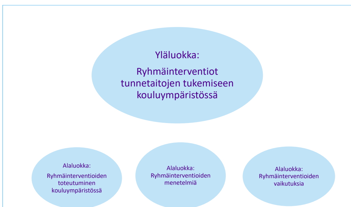
Kuvio 4 Ylä- ja alaluokat

Kuvailevan kirjallisuuskatsauksen viimeisenä osana tarkastelimme keskeisiä tutkimustuloksia ja suhteutimme niitä opinnäytetyömme tutkimuskysymykseen. Tutkimuksia alettiin käymään läpi perusteellisesti sekä suomentamaan opinnäytetyöhön valittuja kansainvälisiä tutkimuksia. Kuviosta 4 löytyy ryhmittelyä ja tiivistämistä seuraava jaottelu ylä- ja alaluokkiin. Siinä esitellään sisältöanalyysin tulokset. Alkuperäiset tutkimukset löytyvät liitteestä 1.