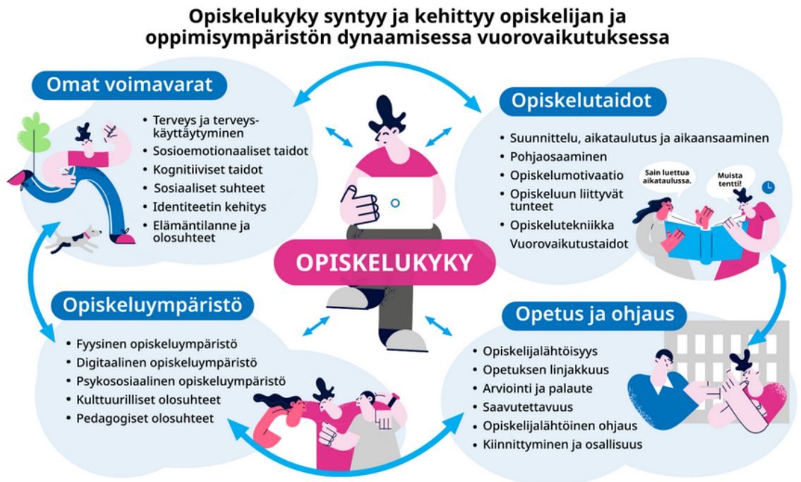
Kuvio 1. Opiskelukyky (YTHS)

Elämäntilanteet vaihtelevat ja voivat heijastua myös oppimiseen, ja erilaiset oppimisvaikeudet ovat yksilöllisiä ja osa oppijoiden moninaisuutta. Noin 7 %:lla ammattikorkeakouluopiskelijoista arvioidaan olevan jonkinlainen oppimisen vaikeus (Korkeamäki 2021). KAMKin ohjauksen toiminnoissa huomioidaan myös erilaiset oppijat ja jokaiselle opiskelijalle pyritään etsimään hänelle sopivat ohjauksen toimintamuodot. Ohjauksen toiminnat määritetään KAMKissa kolmiportaisen tuen periaatteella: