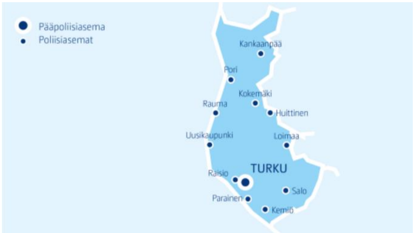
Kuva 3. Lounais-Suomen poliisilaitos

Pääpoliisiasema sijaitsee Turussa (kuva 3). Varsinais-Suomen alueella on pääpoliisiaseman lisäksi Uudenkaupungin, Loimaan, Raision, Paraisten, Kemiön ja Salon poliisiasemat.