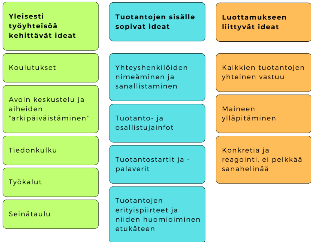
Kuva 2. Aivoriihestä nousseet ideat.

Aivoriihen ideoinnista nousi useita käyttökelpoisia ajatuksia, joita voisi hyödyntää Fremantlella yleisesti ja tuotantokohtaisesti. Aivoriihen lopuksi lajittelin ideat vielä teemoittain ja yhdistelin samankaltaisia ideoita. Niistä muodostui kokonaisuuksia kolmen aiheen alle: yleisesti työyhteisöä kehittävät ideat, tuotantojen sisälle sopivat ideat sekä luottamukseen liittyvät ideat. Lähdin kokoamaan kehittämissuhteita näiden kolmen teeman kautta.