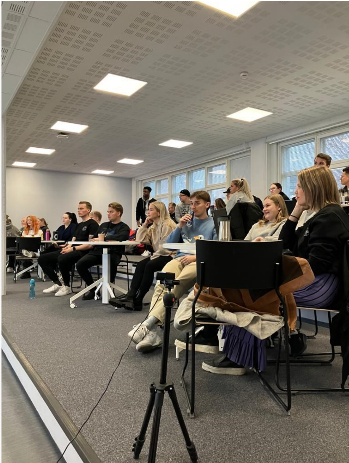
Kuva 1. Hybriditapahtumassa kisaajia kannustettiin sekä verkossa että paikan päällä. Voitonjulistus striimattiin Howspace-verkkoalustan kautta.

Kilpailu sisälsi useita sarjoja ja siten palkintoja pystyttiin jakamaan eri henkilöille ja tiimeille. Onnistumisen kokemuksia saatiin paitsi voitoista myös onnistuneista kaupoista ja yhteistyöstä.