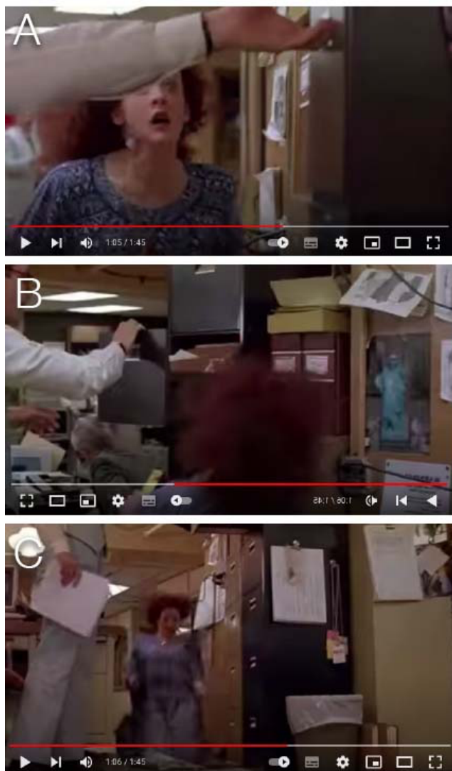
KUVA 7. Kuvasarja elokuvasta Broadcast News (1987) (Youtube). Juokseva nainen väistää avautuvaa arkistolaatikkoa.

Pearlman tutki oppilaidensa kokemusta ja reaktiota tähän kyseiseen kohtaukseen, ja näytti sen heille kahteen otteeseen. Pearlman koki mielenkiintoisena sen, että oppilaat pitivät kohtausta sekä jännittyneenä että hullun hauskana, sekä ensin putkeen katsottuna että osiin jaettuna toisella kertaa. Tämän ilmiön kirjoittaja tulkitsee johtuvan rytmin voimasta ja vaikutuksesta, mikä ylittää voimallaan informaation. (Pearlman 2016.)