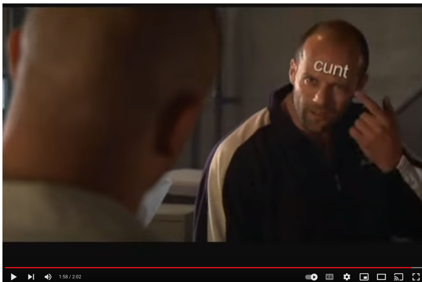
KUVA 8. Kuvankaappaus elokuvasta Crank (2006) (Youtube). Päähenkilö Chev Chelios osoittaa otsaansa, jossa on Arial-fontilla kirjoitettu teksti "cunt".