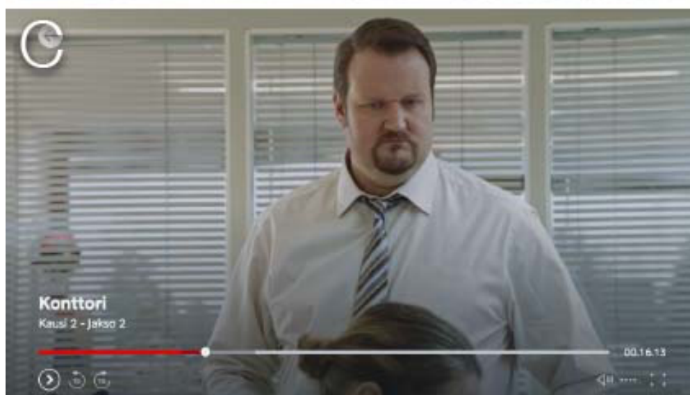
KUVA 14. Kuvasarja TV-sarja Konttorin jaksosta Liittouma (Viaplay). Hahmojen välinen keskustelu näytetään kuvakoilla kokokuvasta puolilähikuvaan.