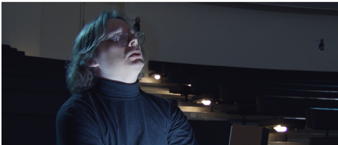
KUVA 1. Kuvankaappaus lyhytelokuvasta Pling (Pling 2022). Potaska-niminen hahmo istuu konservatorion katsomossa. Kasvoilla tympeä ilme. Puolilähikuva.