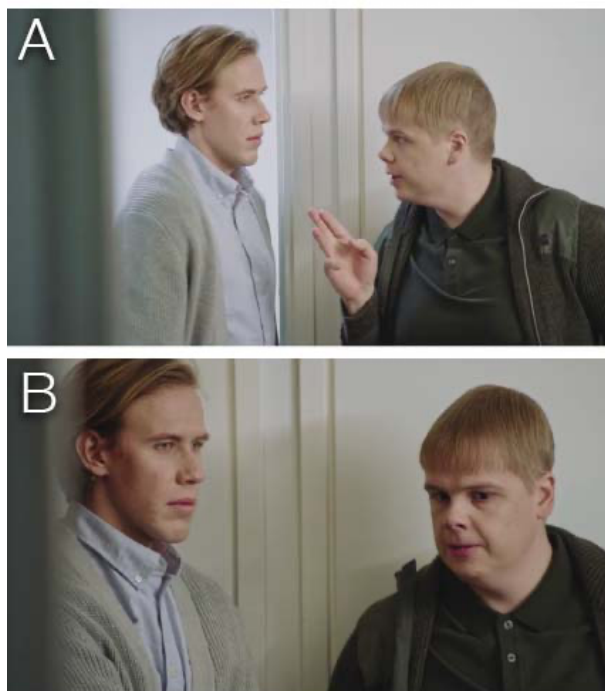
KUVA 12. Kuvasarja TV-sarja Konttorin jaksosta Liittouma (Viaplay). Hahmojen välinen keskustelu näytetään kahdella eri kuvakoolla.

Sekä The Officessa, että Konttorissa kuvaustyyli on samankaltainen, eli paljon käsivarakuvaa sisältävä dokumentaarinen seurantatyyli – puhutaan siis moku-mentista. The Officessa kameratyöskentely on omien huomioideni perusteella kuitenkin monipuolisempaa, ja eri kuvakokoja on otettu enemmän. Kuvauksen yhteydessä on tehty vapautuneemmin rajumpia zoomauksia, panorointeja ja tilt-tauksia. Nämä kameratyöskentelyyn liittyvät seikat tietysti tekevät jo itsessään osan kuvakokojen vaihtelusta, mikä paikallaan kuvatussa materiaalissa olisi täysin leikkaajan käsissä, tietysti materiaalin määrästä ja sen monipuolisuudesta riippuen.