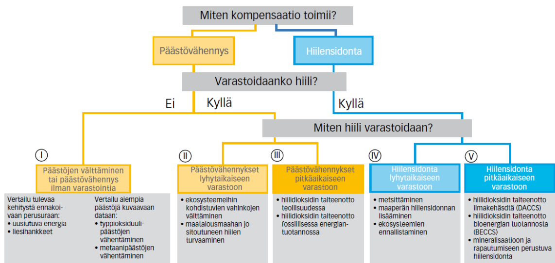
Kuvio 1. Kompensoinnin periaate (Finnwatch 2021, 26).

Vapaaehtoisella päästökompensaatioilla tarkoitetaan toiminnasta ja kulutuksesta aiheutuvien kasvihuonekaasujen hyvittämistä rahoittamalla toimintaa, joka sitoo hiiltä ilmakehästä tai vähentää päästöjä. Koska kasvihuonekaasujen vaikutus ilmakehässä on globaali, ei ole väliä, missä päästöjen vähennys tapahtuu. Kuviossa 1 kuvataan kompensoinnin pääpiirteet ja hanketyyppejä.