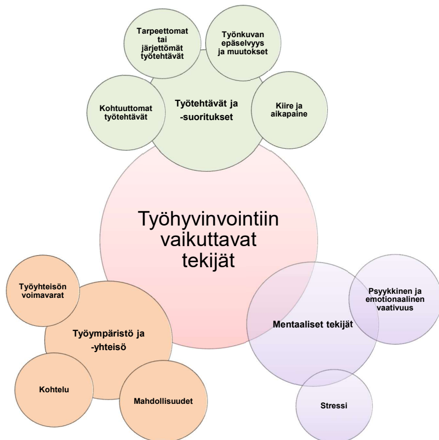
Kuvio 2. Systemoidun kirjallisuuskatsauksen tulokset

Alla (Kuvio 2) on esitetty tutkimuksen tulokset. Kuviossa keskellä on tutkimusasetelma, sitä ympäröivät yläluokat, työtehtävät ja -suoritukset, työympäristö ja -yhteisö sekä mentaaliset tekijät. Näitä ympäröivät kunkin yläluokan muodostaneet alaluokat.