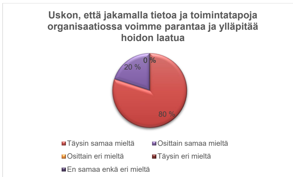
Kuvio 3: Diagrammi 2.

Yhtenevät kokemukset näkyivät myös väittämässä, jossa tarkasteltiin kokemusta saada tarvittaessa tukea kollegoilta. Vastanneista 100 % oli täysin tai osittain samaa mieltä siitä, että tukea on saatavilla.