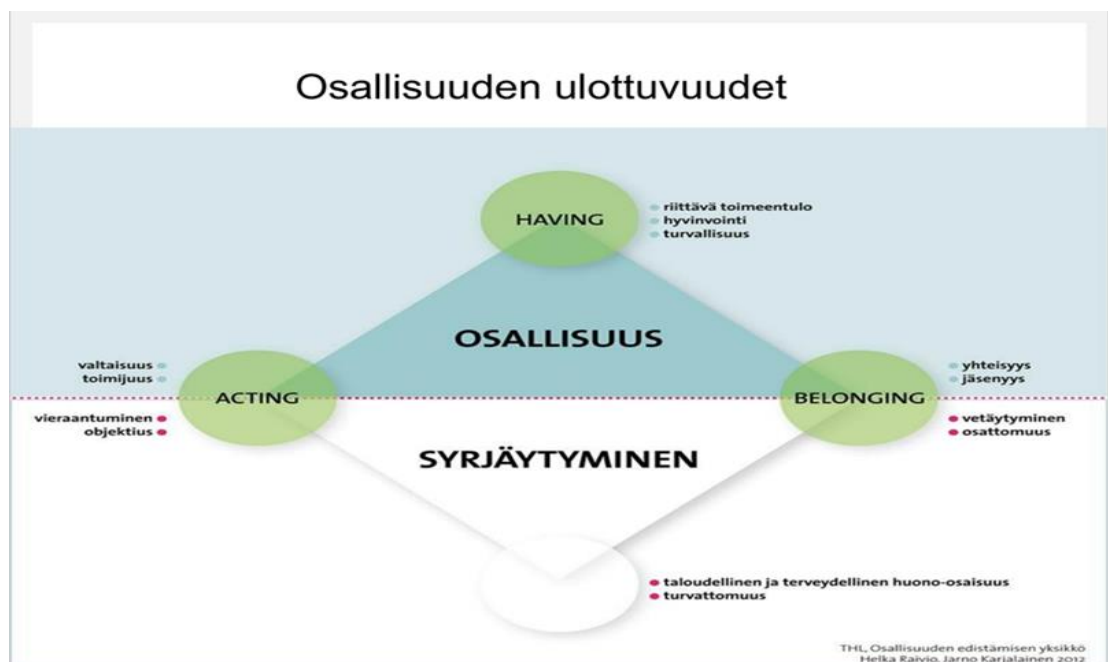
Kuvio 1. Osallisuus syrjäytymisen vastaparina (Raivio & Karjalainen 2013 s.17)

Kuviossa 1. kuvataan osallisuutta kokonaisuutena ja eri ulottuvuuksineen, voimavaroineen ja esteineen.