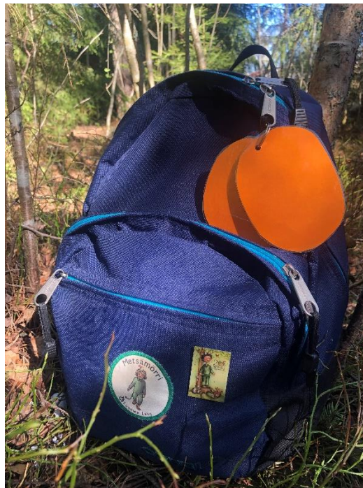
Kuva 3. Metsämörriohjaajan reppu

lapsella tulee olla mukanaan aina reppu metsään lähdettäessä. Reppuun pakataan mukaan istuinalusta, eväät, juomapullo, varahanskat ja metsästä lähdettäessä sieltä mahdollisesti löydettyjä asioita, joita voidaan käyttää päiväkodilla myöhemmin muun muassa askarteluissa. Metsämörriohjaajan reppu (Kuva 3) sisältää enemmän asioita ja se on pakattu itseä, toimintaa ja turvallisuutta varten. Ohjaajan reppuun on istuinalustan ja eväitten lisäksi muun muassa keräilyliina, Metsämörrinukke, lasten nimilista, ensiapulaukku, roskapussi ja tarvikkeet, joita sen kertaisessa toiminnassa tarvitaan. Sopivat eväät ovat pieni leipä, hedelmä ja juomana mehu tai vesi. Turvallisuussuunnitelma on laadittava jokaiselle Metsämörriretkelle, johon on kirjattu ennakoitavat toimenpiteet liittyen toimintaan, sääolosuhteisiin ja valittuun reittiin ympäristöineen. (Suomen Latu, 2019, s. 12–14, 17.)