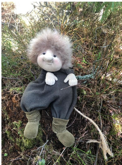
Kuva 2. Metsämörri.

Luonnon kunnioittamista ja huolehtimista opitaan metsämörri-toiminnassa arkisten asioiden parissa. Tällä toiminnalla luodaan lapsille ymmärrystä elämän varjelemisesta ja rakentamalla tunneside luontoon. Metsämörri kertoo lapsille, että luonnosta tulee pitää huolta. Luonto rauhoittaa mieltä, jolloin lapselle suodaan rauhanomainen aika ja tila tutkia sitä. Rauhallinen ympäristö edistää luovuutta ja elämyksellistä oppimista. Luonto on laadukas oppimisympäristö, koska liikunnan harjoittamiseen ja tietojen hankkimiseen ei ole parempaa paikkaa. Luonto on virikkeinen antoisa lapsen rajattomalle mielikuvitukselle. Metsämörri -hahmo on luonnon kunnioittamisen vertauskuva, joka synnyttää ajatuksia ympäröivästä luonnosta ja laittaa lapsen pohtimaan luonnon monimuotoisuutta. Metsämörri-toiminta on yhdessä tekemistä metsämörriohjaajien, lasten ja vanhempien kanssa, jossa ilon ja leikin kautta tutkitaan luontoa ilmiöineen. Toiminnassa muun muassa opitaan luonnon kunnioitusta, tutustutaan kasveihin ja eläimiin, harjoitetaan kehonhallintaa sekä toimitaan joka säällä luonnossa jokamiehen oikeuksin. (Suomen Latu, 2019, s. 4; Laiho ym., 2009, s. 7.)