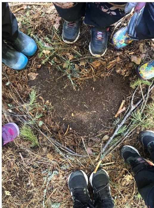
Kuva 4. Luontoteos

Lähtiessämme metsästä takaisin kohti päiväkotia suljettiin metsän reunalla jälleen ”metsän portti”. Kävelimme samaa reittiä takaisin ja lapset havainnoivat ympäristöä. Keskustelimme autoista, pyöristä ja matkan varrella löytyneistä roskista, joita poimimme mukaan viedäksemme ne roskiin. Päiväkodilla kokoontuimme lopuksi loppupiiriin, jossa käytiin läpi metsäretkellä tapahtuneet asiat. Lapsilta kysyttiin, mikä oli ollut kivaa, mikä vaikeaa ja mitä erityisesti jäi mieleen. Lasten mielestä mukavinta oli taideteoksen tekeminen ja leikkiminen. Vaikeana asiana koettiin olevan löytää mahdollisimman erilaisia tarvikkeita metsästä ilman, että keräisi eläviä asioita teokseen. Erityisesti retkestä oli jäänyt mieleen eväät, joita söimme metsässä.