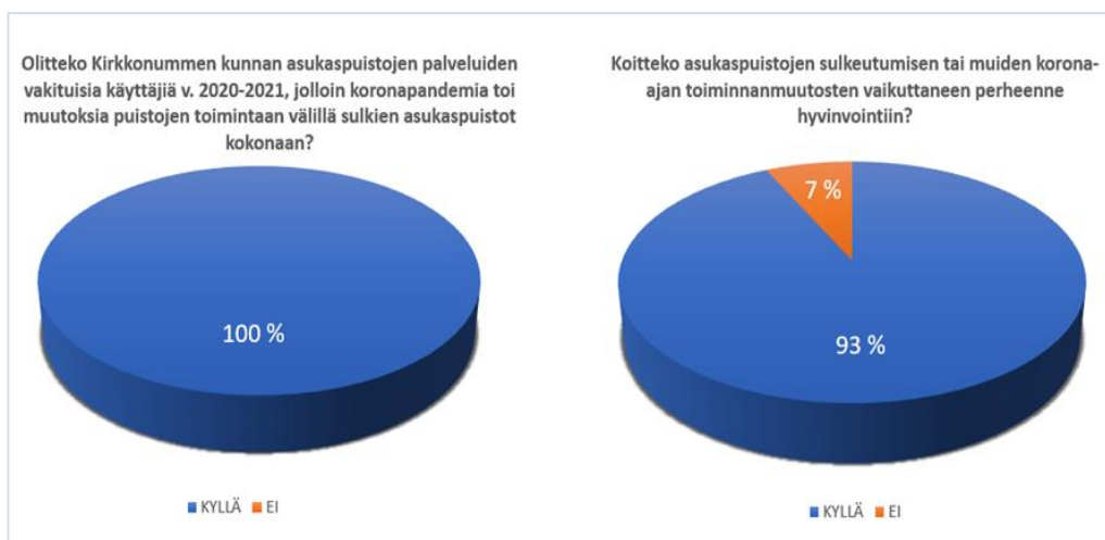
Kuvio 1: Vakituiset asiakkuudet ja toiminnanmuutosten vaikutukset koettuun hyvinvointiin

Asiakaskyselyn vastaajilta selvitettiin taustojen kartoittamiseksi Kirkkonummen kunnan asukaspuistojen mahdollisen asiakkuuden lisäksi, olivatko he kokeneet koronapandemian aiheuttamien toiminnanmuutosten vaikuttaneen perheidensä hyvinvointiin, ja kuinka usein he olivat vierailleet asukaspuistoissa ennen näitä toiminnanmuutoksia (Kuviot 1 & 2). Asiakaskyselyn vastaajista kaikki 14 (100 %) vastasivat olleensa asukaspuistojen asiakkaina aikana, jolloin koronatoimet rajoituksineen vaikuttivat puistojen toimintaan. Heistä peräti 13 (93 %) vastasi kokeneensa, että puistojen sulkeutuminen ja muut korona-ajan toiminnanmuutokset olivat vaikuttaneet heidän perheidensä hyvinvointiin (Kuvio 1).