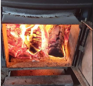
Kuva 3, Sauna lämpiää

tun aikataulunsa mukaisesti, toiset varhain ja toiset paljon myöhemmin, tämä järjestely toimi kaikkien osalta hyvin. Yksi osallistujista ei aikomuksistaan huolimatta pystynyt yöpymään yhteismajoituksessa vaan halusi kotiin nukkumaan, hänelle järjestyi kuljetus ja hän saapui toiselle leiripäivälle linja-autolla.