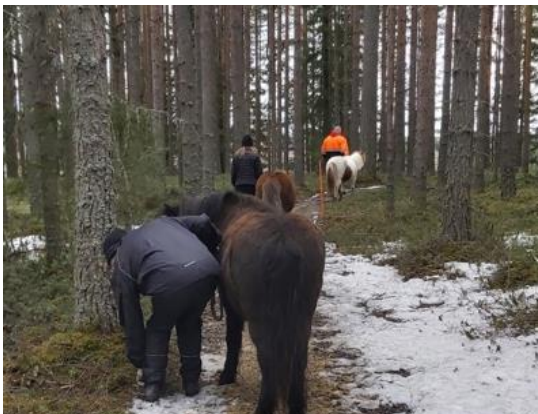
Kuva 1, Metsäretkellä ponien kanssa

Torstaisin tapahtuva ryhmätoiminta toteutettiin iltapäivisin, pääsääntöisesti klo 11.30–14.30 välisenä aikana ennen tallin normaalin tuntitoiminnan alkamista. Toiminta aloitettiin aina hevosten tarhasta hakemisella ja hoitamisella, minkä jälkeen tapahtui kyseiselle päivälle suunniteltu aktiviteetti. Ratsastus oli toiminnoista suosituin aktiviteetti, mutta hevosilla myös ajettiin kärryillä, harjoiteltiin agilityä, tehtiin metsäkävelyjä niitä taluttaen ja perehdyttiin yleisesti asioihin, mitkä vaikuttavat hevosten hyvinvointiin, sekä siihen miten ihminen voi näihin asioihin vaikuttaa. Varusteiden puhdistus ja tallin siisteydestä huolehtiminen jokaisen osallistujan taholta oli yksi hyvistä käytännöistä ja myös hevosten ruokintaan oli mahdollisuus osallistua. ”Hevosen avulla pyritään osoittamaan asiakkaalle niiden asioiden tärkeys, joista oma hyvinvointi syntyy, kuten puhtaus, terveellinen ravinto, säännölliset ruoka-ajat, sopiva liikunta ja riittävä lepo” (Okulov 2019, 18).