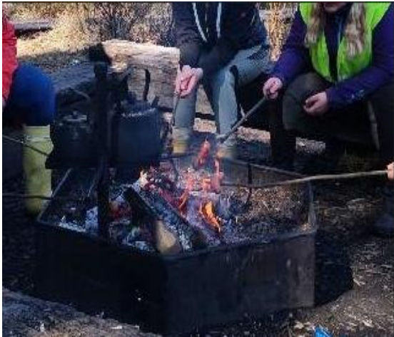
Kuva 8, Retkievästä laavulla