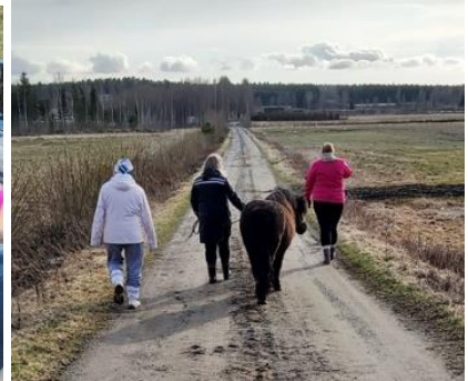
Kuva 5, Iltakävelyllä

Leirin toisena päivänä toiminta alkoi ruokailun jälkeen aamutallilla eli hevosten ruokkimisella ja karsinoiden siivouksella, lisäksi innokkaimmat ja energisimmät leiriläiset siivosivat yhdessä hevostarhaa. Päivän odotetuimpana aktiviteettinä oli maastoratsastus Pilpasuon laavulle, kaikki leiriläiset eivät uskaltaneet maastoon, joten nämä henkilöt jäivät kentälle kokeilemaan hevosagilityä. Maastossa oli mukana neljä leiriläistä ja heidän vetäjänään toimi yksi ohjaaja. Oma toimenkuvani maastoretkellä oli ajaa tallihenkilökunnan jäsenen kanssa etukäteen mönkijällä laavulle, viedä peräkärnyllä evästarvikkeet ja polttopuut ja valmistella laavu nuotioineen tulijoita varten valmiiksi. Oli nautinnollista istua nuotiolla luonnon keskellä, katsella nuotiota, kuunnella ympäröivää hiljaisuutta ja luonnon ääniä, sanoja ei aina tarvita, läsnäolo on myös osallistumista. Lähtö laavulta tuntui hieman haikealta, sen myötä viimeinen leiripäivä alkoi olla loppusuoralla ja kotiinlähtö hämmötti edessä. Ennen kuin ryhmä lähti laavulta takaisin, valokuvasin jokaisen leiriläisen ”oman” hevosensa kanssa ratsailla, luonto taustana valokuvissa oli mitä mainioin.