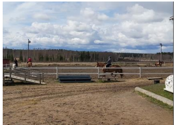
Kuva 2, Ratsastusta kentällä