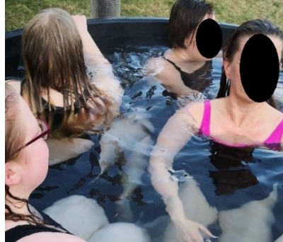
Kuva 4, Paljuilemassa