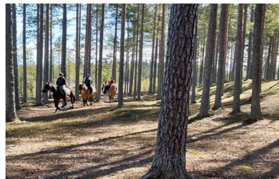
Kuva 7, Saapuminen laavulle