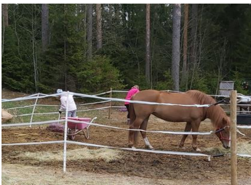
Kuva 3, Tarhan siivousta

Leirin toisena päivänä toiminta alkoi ruokailun jälkeen aamutallilla eli hevosten ruokkimisella ja karsinoiden siivouksella, lisäksi innokkaimmat ja energisimmät leiriläiset siivosivat yhdessä hevostarhaa. Päivän odotetuimpana aktiviteettinä oli maastoratsastus Pilpasuon laavulle, kaikki leiriläiset eivät uskaltaneet maastoon, joten nämä henkilöt jäivät kentälle kokeilemaan hevosagilityä. Maastossa oli mukana neljä leiriläistä ja heidän vetäjänään toimi yksi ohjaaja. Oma toimenkuvani maastoretkellä oli ajaa tallihenkilökunnan jäsenen kanssa etukäteen mönkijällä laavulle, viedä peräkärnyllä evästarvikkeet ja polttopuut ja valmistella laavu nuotioineen tulijoita varten valmiiksi. Oli nautinnollista istua nuotiolla luonnon keskellä, katsella nuotiota, kuunnella ympäröivää hiljaisuutta ja luonnon ääniä, sanoja ei aina tarvita, läsnäolo on myös osallistumista. Lähtö laavulta tuntui hieman haikealta, sen myötä viimeinen leiripäivä alkoi olla loppusuoralla ja kotiinlähtö hämmötti edessä. Ennen kuin ryhmä lähti laavulta takaisin, valokuvasin jokaisen leiriläisen ”oman” hevosensa kanssa ratsailla, luonto taustana valokuvissa oli mitä mainioin.