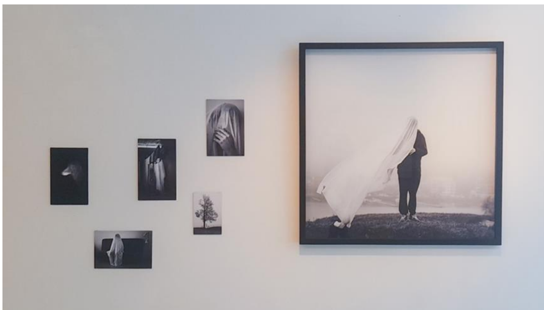
Kuva 10. Ensimmäinen versio ripustuksesta

Minulla ei ole aiempaa kokemusta tämän tyyllisen näyttelyn ripustamisesta, joten apunani oli koulumme pajamestarit. Kokemattomuuteni näkyi epävarmuutena ja ensimmäisen ripustuksen jälkeen en ollutkaan tyytyväinen pienempien teoksien asetteluun. Vaikka ensimmäisessä ripustuksessa oli samankaltaista muotoa, kuin valkeassa kuvan kankaassa, niin koin ettei taulun ja pienempien teoksien välille jäänyt tarpeeksi tilaa (Kuva 10). Suunnittelin ripustuksen kotona uudelleen. Olisin voinut välttyä uudestaan ripustamiselta tarkemmalla ja ennakkoon suunnittelulla. Lopulta siirsin vain yhden teoksen paikkaa kauemmas taulusta. Mielestäni päätös oli hyvä, koska näin pienempien töiden ja taulun väliin jäi tilaa ja teokset eivät niin sanotusti syöneet toisiaan (Kuva 11). Opin tästä, että pienelläkin muutoksella voi olla iso vaikutus kokonaisuuteen ja ennakkoon suunnittelu helpottaa ripustusvaiheessa.