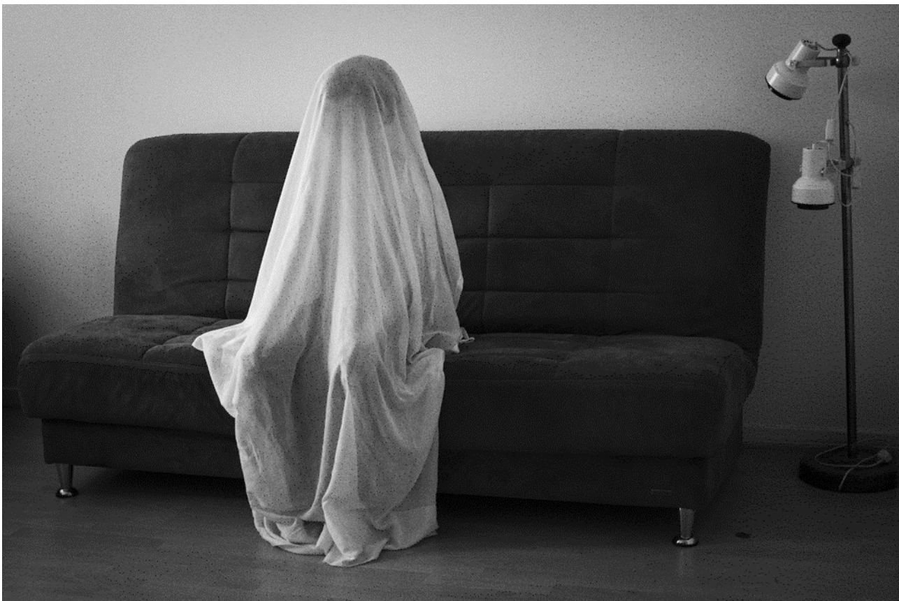
Kuva 4. Kuvani valokuvasarjasta Kummitustarina