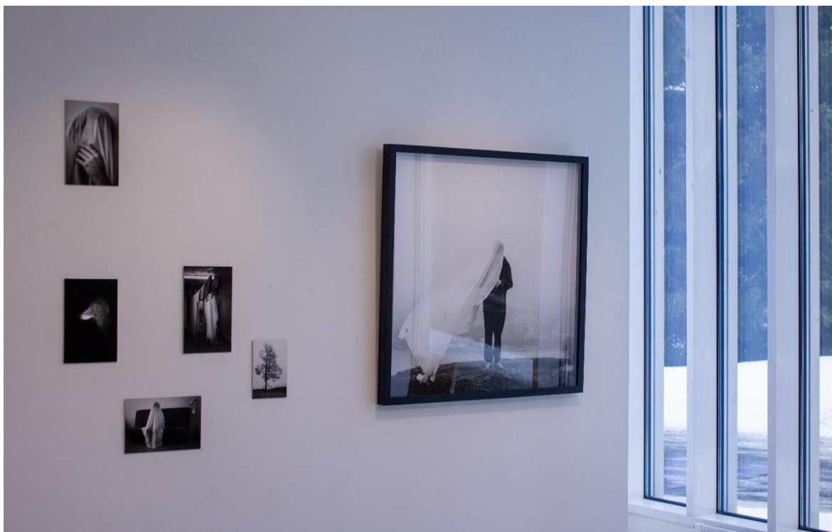
Kuva 12. Teokset seinällä luonnonvalossa ikkunan vierellä

Mietin jälkikäteen olisiko pitänyt enemmänkin leikitellä kuvien koolla ja olisiko kuvien viereen pitänyt laittaa tiivistelmä, jossa olisi lukenut teoksien aiheesta enemmän. Olisiko tiivistelmä avannut liikaa kuvia vai tulisiko kuvat jättää katsojan oman tulkinnan varaan? Tähän minulla ei ole vielä kukaan selkeää vastausta. Museolla oli oma kansio missä oli jokaisen oma näyttelytiivistelmä, mutta koin sen jäävän huomiotta. Koen silti kokonaisuuden olleen näyttelyssä onnistunut, sillä se sai aikaiseksi keskustelua, kehuja ja herätti tunteita.