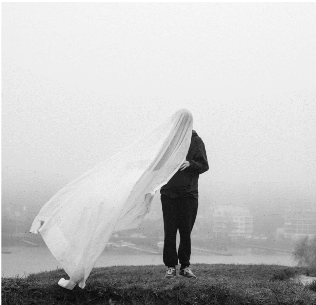
Kuva 8. Kuvani kuvasarjasta Kummitustarina

Ajanpuutteen takia minulla ei ollut aikaa opetella kehystämistä, vaan tilasin kehykset Lasi-Nikku Oy nimiseltä yritykseltä. Lähetin heille tarjouspyynnön ja sain heiltä sopivan tarjouksen takaisin. Opin myös tätä kautta esittämään asiallisen tarjouspyynnön.