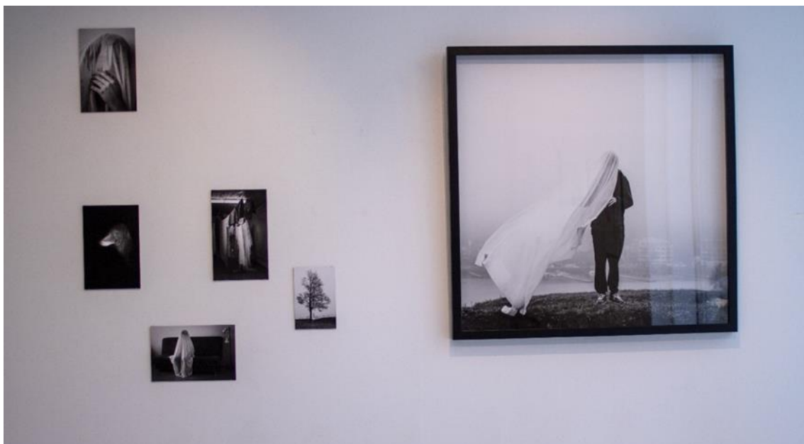
Kuva 11. Lopullinen versio ripustuksesta

Ripustuksessa jouduin tekemään kompromisseja ajan ja tilan suhteen. Kompromissit kumminkin kuuluvat osaksi tekemistä ja oppimista. Ihanteellisessa tilanteessa minulla olisi ollut enemmän tilaa teoksille ja enemmän erikokoisia teoksia. Teoksilleni löytyi kumminkin hyvä paikka museosta. Teokset ovat ikkunan vieressä, josta näkyy koskea ja samankaltaista maisemaa kuin kuvissa, mikä loi mielenkiintoisen jatkumon teoksista ulos ja takaisin sisään (Kuva 12). Museossa ei ollut säädettäviä valoja, joten ikkunoista tuleva luonnonvalo oli edukseen, jotta ainoa valonlähde teoksille ei olisi keltasävyinen kohdevalo ja valot eivät niin pahasti heijastunut lasiin.