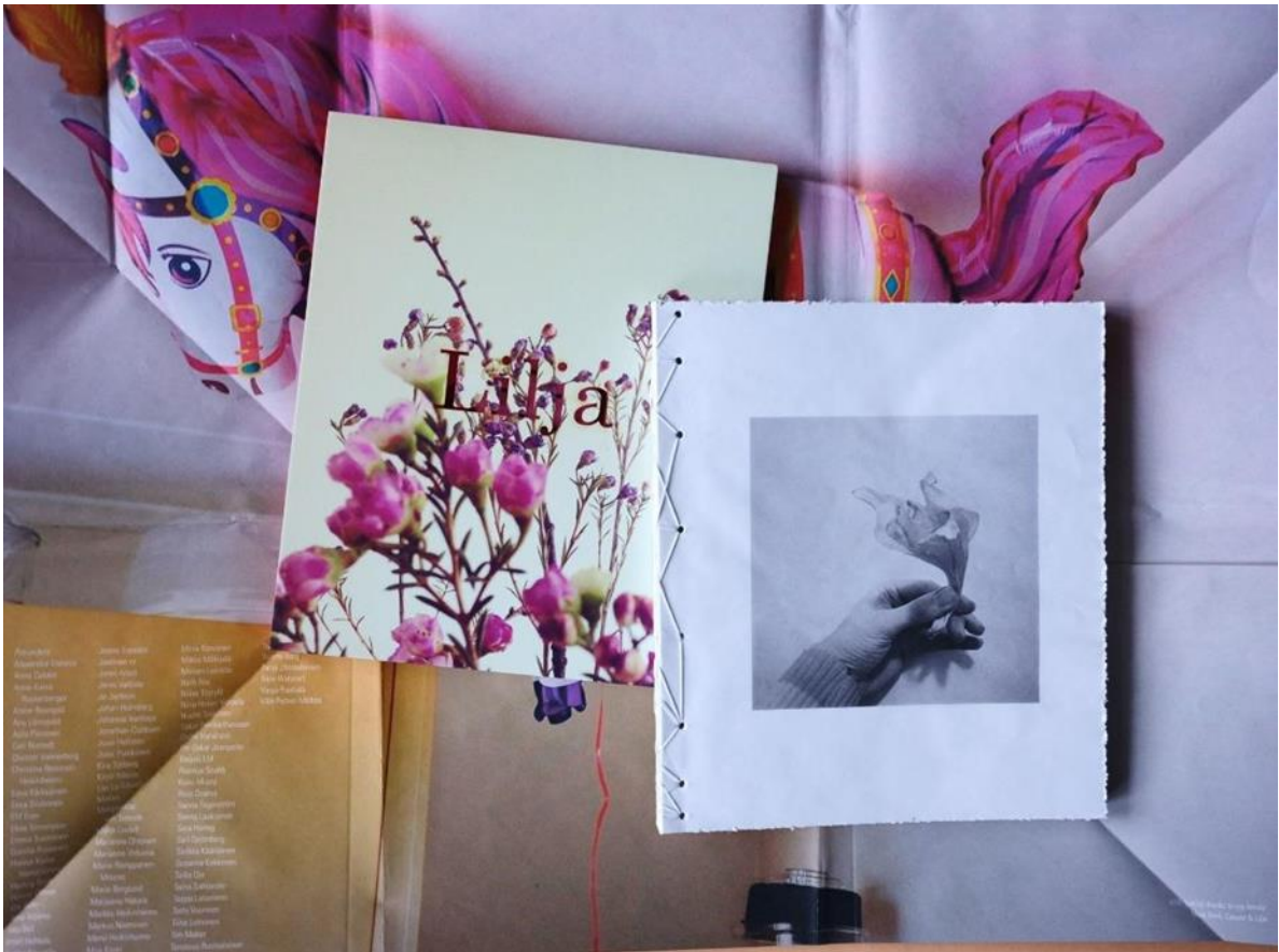
Kuva 2.