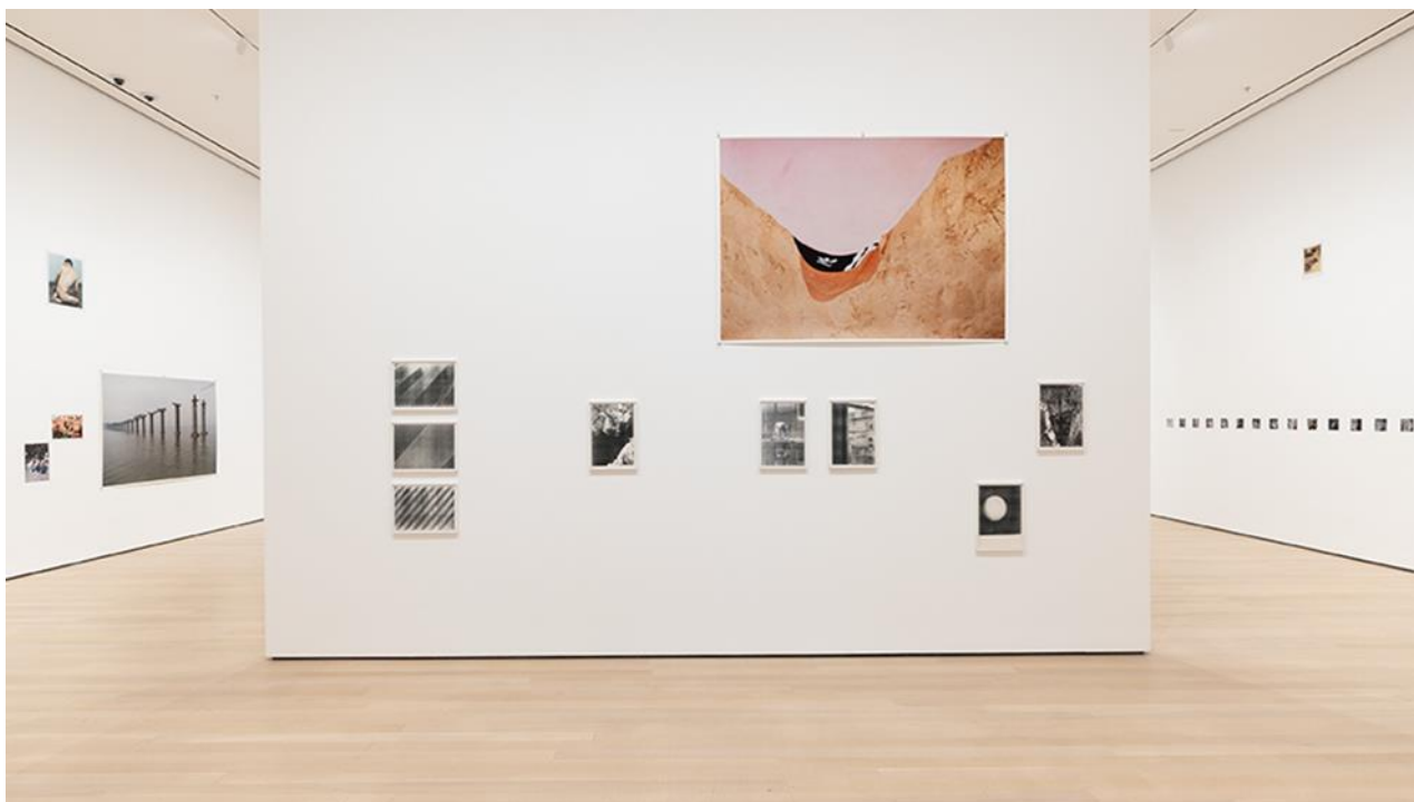
Kuva 7. New Yorkin Modernin taiteen museo (Tillmans 2023)

Halusin yhden kuvistani melko isoksi, joten päätin tulostaa sen 100 cm x 100 cm kokoiseksi. Tätä varten kuva tuli suurentaa koululle ostetulla erillisellä ohjelmalla, jota varten sain apua opettajaltani, koska ohjelma oli minulle entuudestaan tuntematon. Neljä kuvaa olivat noin 20 cm x 30 cm kokoisia ja pienin kuvista oli kooltaan 15 cm x 22,5 cm kokoinen. Tulostin isoimman kuvan edullisemmalle paperille, koska se sopi budjettiini paremmin. Muut kuvat tulostin Cansonin baryta nimiselle paperille. Cansonin paperi oli mattapintainen ja loi kuviini kauniin samettisen pinnan, joka sopi mielestäni mustavalkoisiin kuviini. Itse tulostamisessa ei ilmennyt ongelmia ja sain siihen apua pajamestarilta.