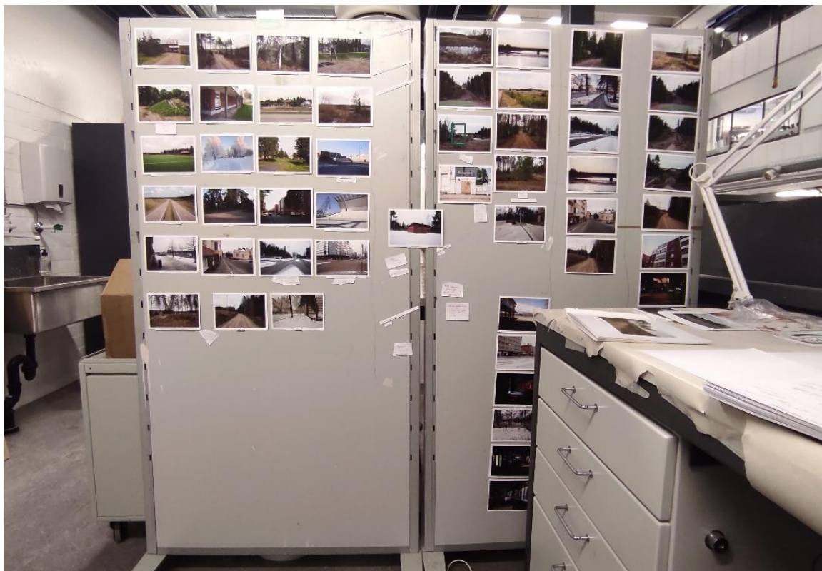
Kuva 11. Työpisteeni kuvakokonaisuuden hahmotteluvaiheessa.

Kirjassa on hyvin monta elementtiä, jotka kaikki vaikuttavat toisiinsa, ja kaikkien niiden kasaaminen yhteen rytmillisesti, kuvallisesti ja kertomuksellisesti mahdollisimman tasapainoiseksi kokonaisuudeksi otti aikansa. Tulostin kuvat noin postikortin kokoisiksi pieniksi mustesuihkuvedoksiksi, luonnoskuvien tapaisesti, ja eri sanapariluonnokset eri paperille, jonka leikkelin niin, että sain kaikki tekstivaihtoehdot erilleen toisistaan, ja pyörittelin niitä työpisteeni seinäpinta-alalla nähdäkseni koko kokonaisuuden kerralla (Kuva 11). Lisäksi tulostin kuvat myös alustavan sivun muotoon ja koostin niistä sekä paperille tulostetuista irrallisista tekstivaihtoehdoista luonnoskirjan (Kuvat 12 ja 13), jonka muodossa kokeilin eri järjestysten ja tekstien toimivuutta kirjana, vaihtelemalla sivujen järjestystä ja tekstejä kuvien alla. Kuvien katsominen kirjasta peräjälkeen, verrattuna kaiken katsomiseen seinältä kerralla, on erilainen kokemus.