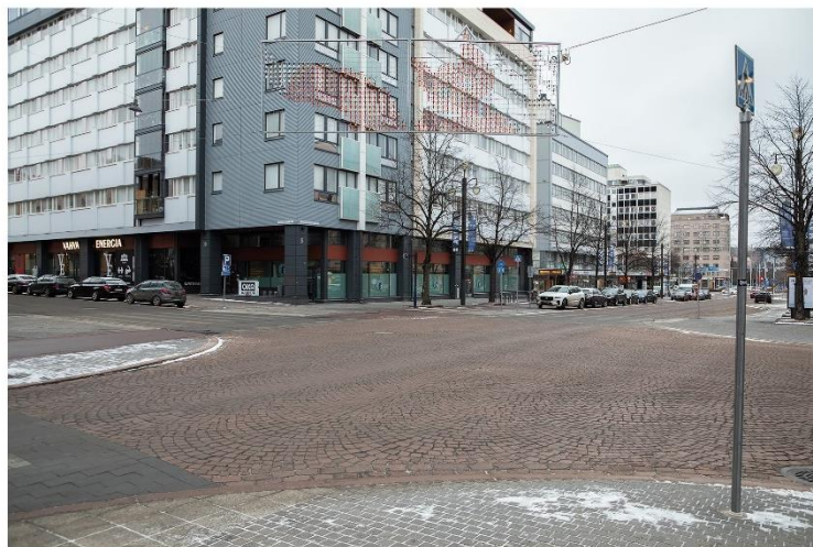
Soitin syntymäpäiväonnittelut papalle

Kuva 7. Kirjani sivu 51, kuva tekstillä Soitin syntymäpäiväonnittelut papalle