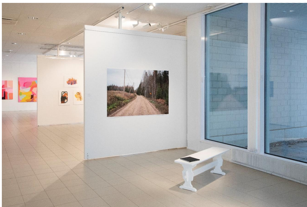
Kuva 18. Valmis esillepano taidemuseolla

Kirjan lukemista varten esillepanoon lukupenkiksi etsin pirttipenkin tukemaan kirjassa olevia maalaismaisemia. Pirttipenkki on kalusteena sellainen, joka varmasti on tiettyä ajanjaksona löytynyt lähes jokaisesta maalaistalosta, myös omasta lapsuudenkodistani, sekä molemmilta isovanhemmiltani. Maalasin penkin valkoiseksi, jotta siinä olisi pieni kontrasti perinteisen ja modernin välillä, ja jotta se sopisi museoympäristöön ja kirjan alustaksi paremmin. Mielestäni kirja tulee siitä paremmin esiin kuin ajan kellastamalta männyn sävyiseltä penkiltä. Asetin kirjan suoraan penkille, enkä nostanut sitä jalustalle, jotta se olisi helpommin lähestyttävä (Kuva 18). Lisäsin vielä myös teostietoihin tiedon siitä, että kirjaa saa lukea ja penkille istua, ole hyvä! (Kuva 19). Lukupenkin ja seinälle ripustetun mustesuihkuvedoksen väliin jätin väljyyttä, jotta elementit istuivat kyseiseen tilaan luonnollisesti ja kutsuvasti, ja jotta halutessaan seinällä olevaa suurta kuvaa voi katsoa penkillä istuen, tai yksityiskohtia lähempää seisten, jolloin penkki ei ole kuvan katselun esteenä (Kuva 20.)