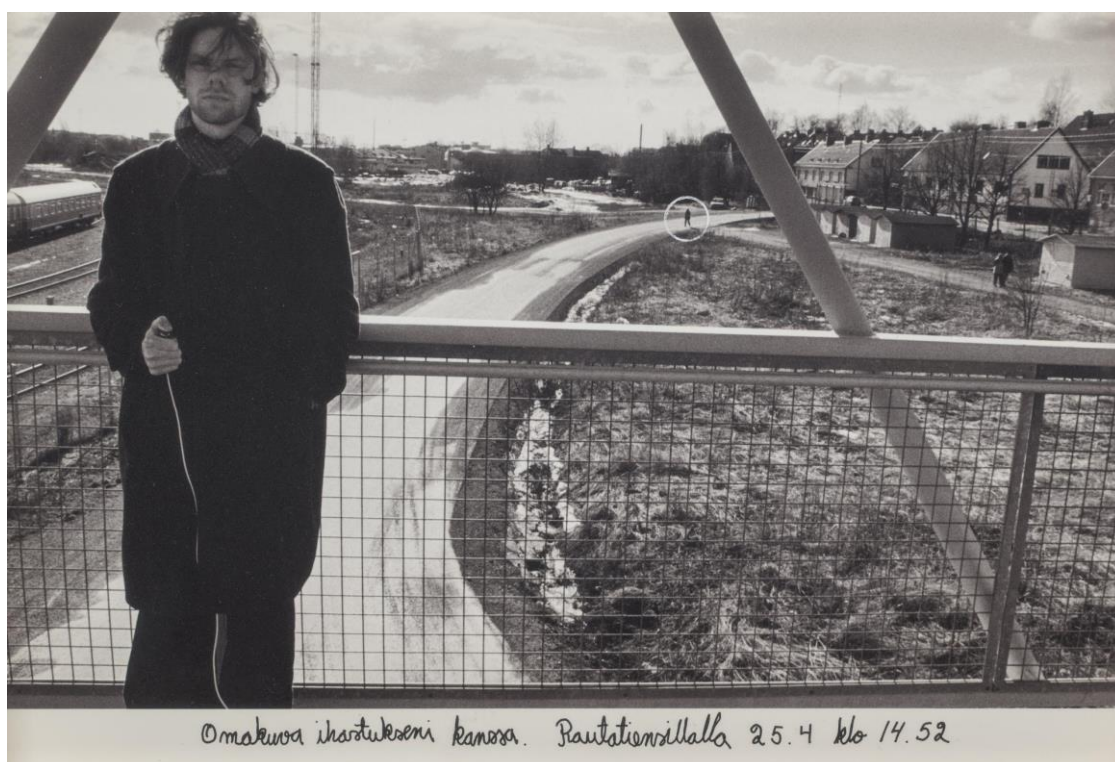
Kuva 1. Sivua Jari Silomäen kirjasta Harjoitelmia aikuisuuteen (Suomen valokuvataiteen museo 2017)

Suomalainen valokuvataiteilija Jari Silomäki käyttää kuvan ja sanan välistä vuorovaikutusta oleellisena osana teoksiaan. Silomäen teos Harjoitelmia aikuisuuteen vuodelta 2001, on valokuvakirja nuoren miehen kasvamisprosessista, ihastuksesta ja kipukohdista. Kirja koostuu kuvista ja kuvapareista tai -sarjoista, joiden viereen, alle (Kuva 1), tai kuva-alan päälle on kirjoitettu lauseita. Tarina rakentuu kuvien ja tekstien keskinäisten suhteiden, sekä näiden osien esitysjärjestyksen kautta. Kuvia on esitetty myös näyttelyn muodossa Suomen valokuvataiteen museossa vuonna 2017. (Suomen valokuvataiteen museo 2017.)