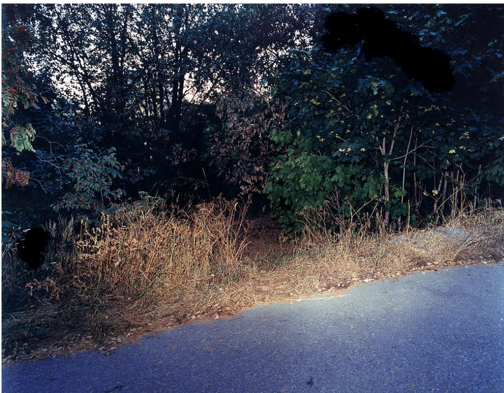
Kuva 4. Kuva Jouko Lehtolan kuvasarjasta OD Helsinki. 2.7 1999 A path between Sivakkapolku and Hiihtäjätie, male, cause of death: Heroin overdose (Jouko Lehtolan säätiö)