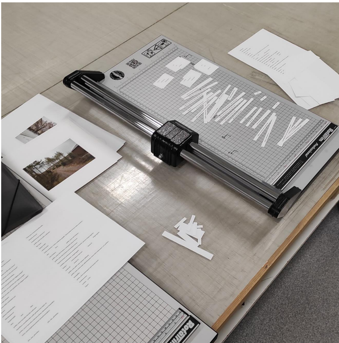
Kuva 12. Irrallisiksi lapuiksi leikeltäviä eri tekstivaihtoehtoja ja irrallisia kuvasivuja