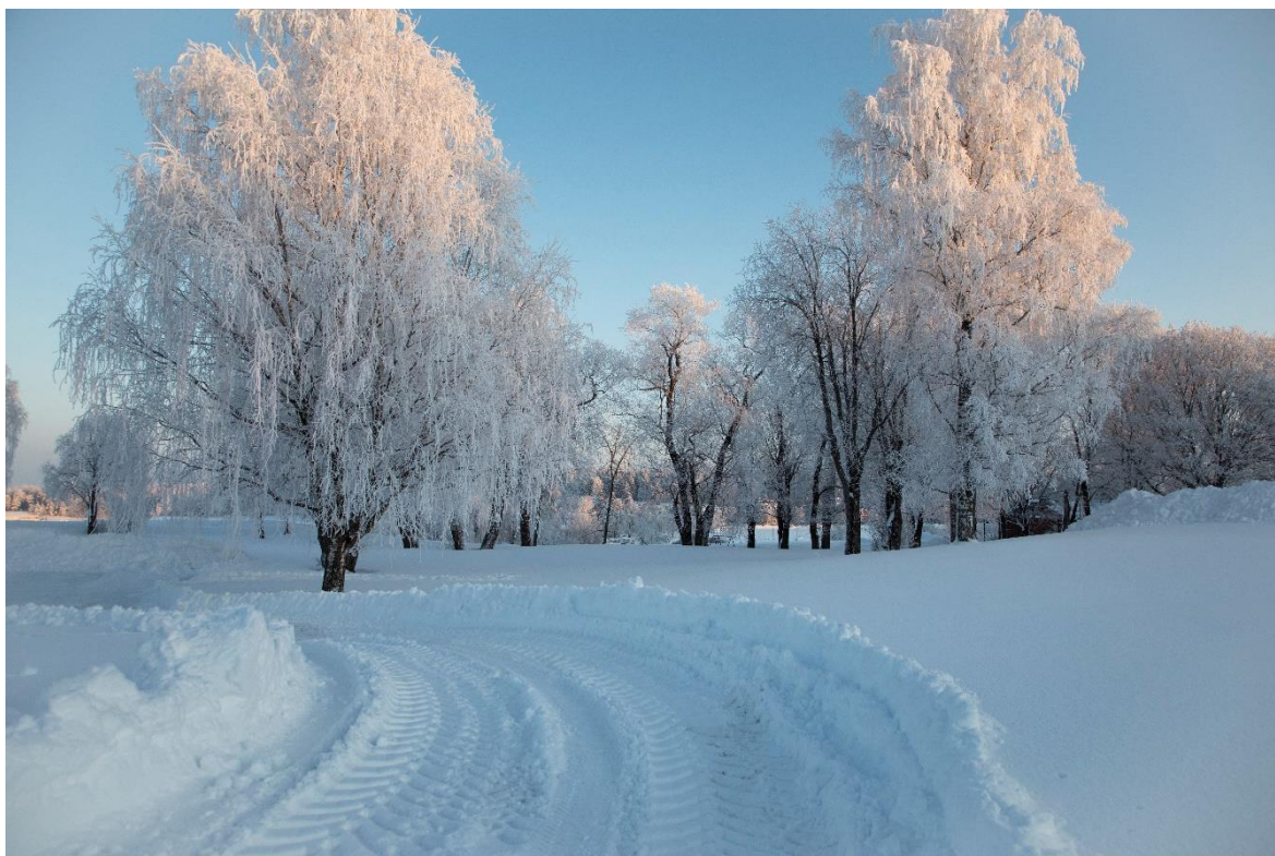
Kuva 5. Talvella kuvaamani muutaman vuoden takainen kesäisen musiikkifestivaalin tapahtumapaikka

Joihinkin kuviin hain tietoisesti kiinnostavia ristiriitoja tekstin lisäksi myös sää- ja vuodenaikaolosuhteilla. Esimerkiksi paikan, jossa joitakin vuosia sitten on kesällä järjestetty musiikkifestivaalit, kuvasin tarkoituksella talvella (Kuva 5), sillä talvisena maisema näyttää nopealla vilkaisulla lähes miltä tahansa puiselta suomalaiselta talvimaisemalta traktorin jälkieneen, eikä juurikaan festivaalialueelta. Kyseinen paikka ei välttämättä muutenkaan ensimmäisenä toisi mieleen musiikkifestivaalin tapahtumapaikkaa, mutta vielä vähemmän talvella.