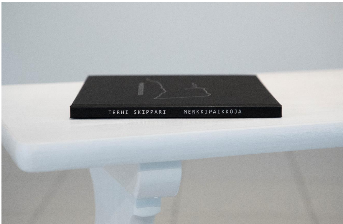
Kuva 16. Valmiin kirjan selkämys

selvisi, että käyttämälleni pintamateriaalille foliointia tehdessä viivan paksuus ei saa olla alle 0,4 mm. Etukannessa käyttämäni fontin kapeimmat kohdat olivat niin kapeita, ettei fontti olisi mahtunut tarpeeksi paksuine viivoine vain sentin paksuiseen selkämukseen, jonka leveyden määrittä sivumäärä ja painopaperin paksuus.