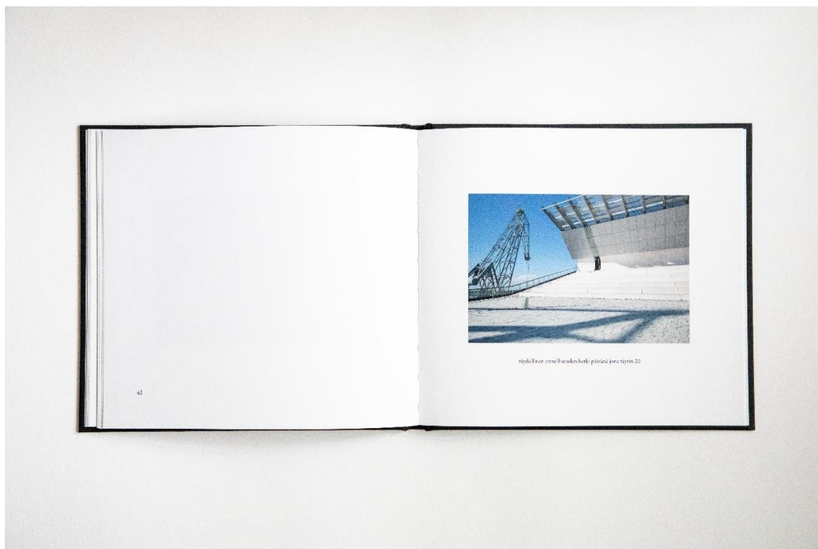
Kuva 14. Yksi valmiin kirjan aukeamista

esittää aina yksinään yhdellä aukeamalla (Kuva 14) enkä esimerkiksi kuvapareina, sillä en koe niiden muodostavan selkeitä muisto- tai kuvapareja, vaan olevan yksittäisiä muistoja muistojen ja asioiden tarinallisessa jatkumossa.