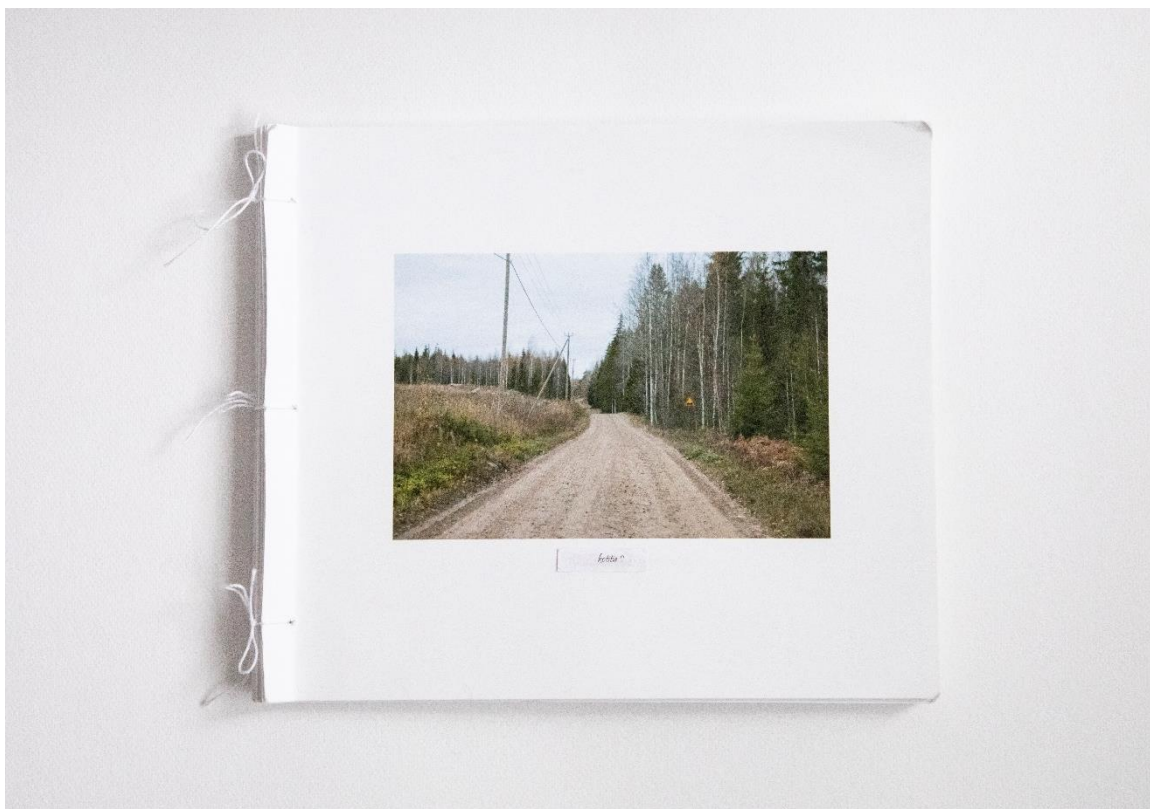
Kuva 13. Irrallisista kuvasivuista ja eri tekstivaihtoehdoista moneen kertaan erilaiseksi koottu luonnoskirja

Lopullinen kuvajärjestys hahmottui useiden eri kokeiluiden kautta todellista muistojen kronologista järjestystä mukailleen, muttei kuitenkaan täysin sitä seuraavaksi. Muutamien kuvien tekstit vielä muuttivat muotoaan samalla kun kuvajärjestys muotoutui, ja myös tekstien osalta pyrin rytmittämään teosta eri tekstirakenteiden mukaan tasapainoiseksi, jottei niidenkään tyyli hyppisi liian rajusti ja usein tekstirakenteesta toiseen. Myös kuvien visuaalinen maailma erilaisine ympäristöineen ja vuodenaikoineen rytmitti kuvia visuaalisesti, mikä myös täytyi ottaa huomioon.