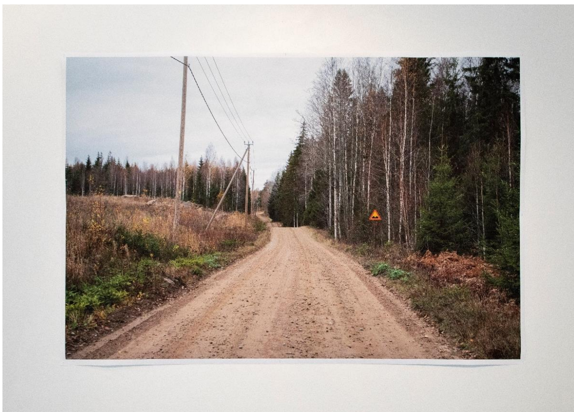
Kuva 17. 154 cm leveä mustesuihkuvedos kirjan ensimmäisestä kuvasta taidemuseon seinälle ripustettuna

Seinälle näyttelyyn valikoitui suureksi 154 cm leveäksi mustesuihkuvedokseksi kirjan ensimmäinen kuva (Kuva 17). Kuva lapsuudenkodin kotitiestäni avaa kirjan ja sen tarinan. Myös epäpaikkamaisuus toteutuu osuvasti kyseisen kuvan kohdalla, sillä samanlaisia hiekkateitä on koko Suomi tulvillaan. Kuva on myös visuaalisesti ja vertauskuvallisesti kiinnostava. Mutkitteleva tie, jonka päätepiste ei vielä näy, on monitulkintainen kuva-aihe.