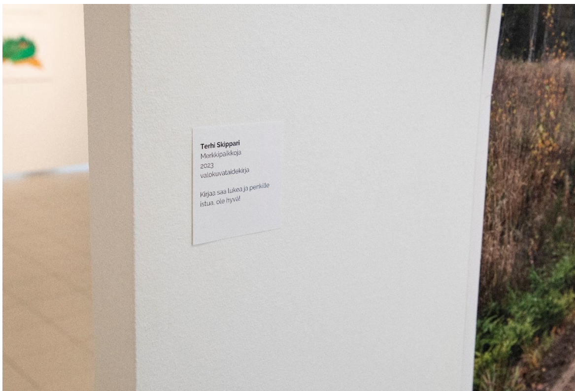
Kuva 19. Teoksen esillepanon yhteydessä esitetty teostieto