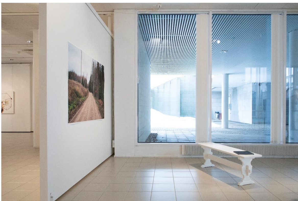
Kuva 20. Esillepano kuvattuna sivusuunnasta