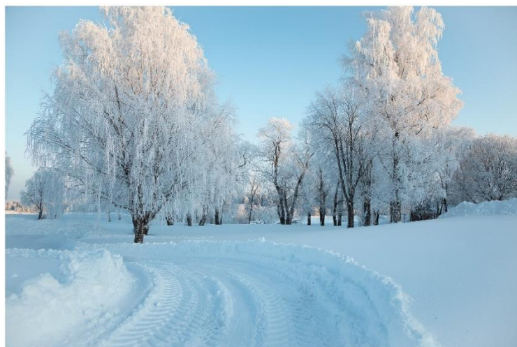
paikka, jossa näin toistaiseksi parhaan Apulanta-keikan

Kuva 6. Kirjani sivu 27, kuva tekstillä paikka, jossa näin toistaiseksi parhaan Apulanta-keikan