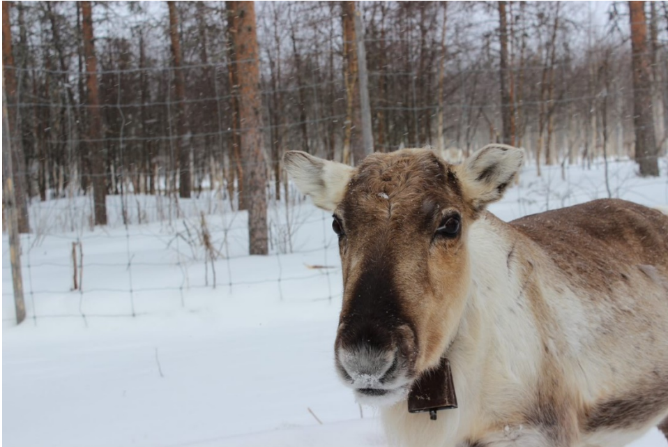
Kuva 3. Poro on eksoottinen eläin myös monelle suomalaiselle.

17 tilalla (kuvat 1, 2 ja 3). Suurin osa tiloista on mukana siksi, että he haluavat lisätuloja matkailusta tilan kannattavuuden parantamiseksi.