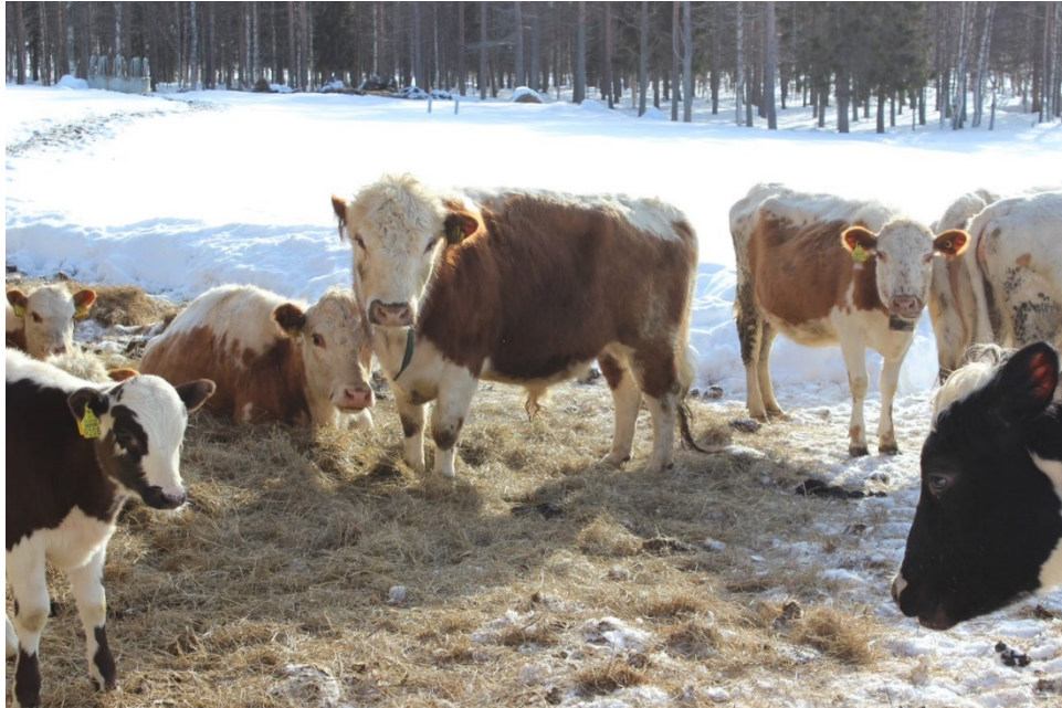
Kuva 2. Pihatossa asustavat naudat ulkoilevat tyytyväisenä.

eikä tekeminen lopu kesken. Tämä säästää luontoa, kuten myös matkustamisesta syntyvien päästöjen väheneminen lähimatkailua suosittaessa.