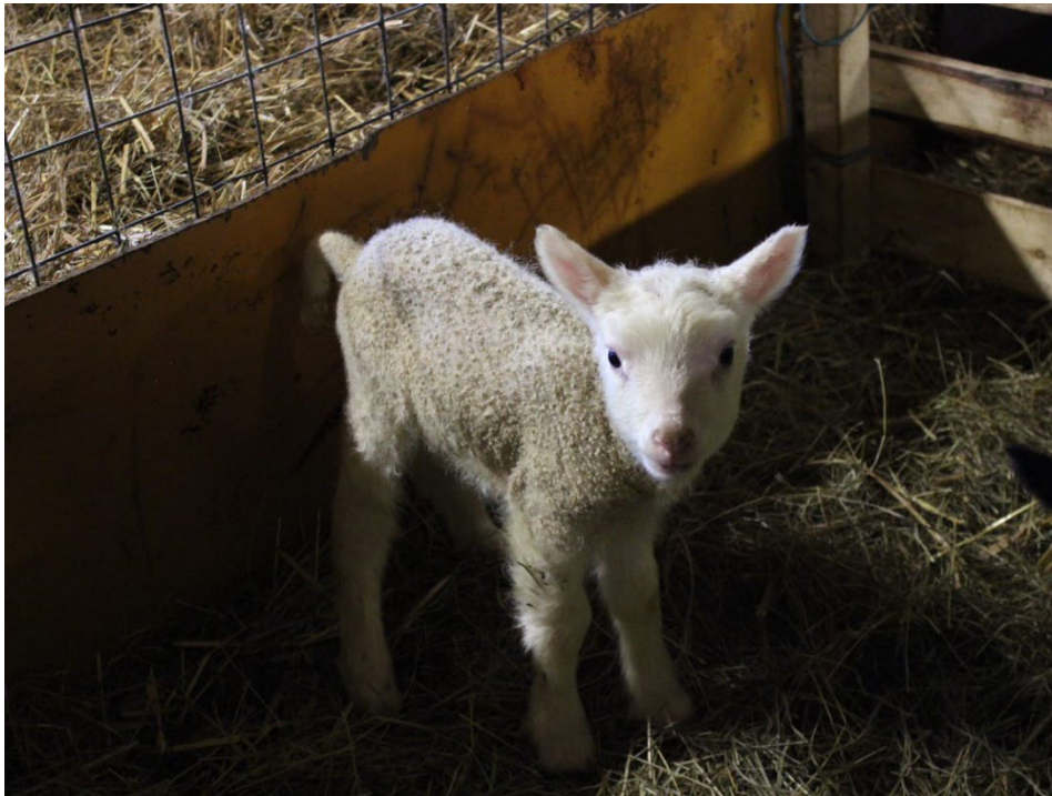
Kuva 1. Pieni karitsa on hellyttävä näky.

Tulevaisuuskuvia piirtäen, on tärkeää tarkastella megatrendejä, jotka tarkoittavat suuria muutoksia viime aikoina (Hiltunen 2021, 15). Niiden avulla ei voida ennustaa tulevaisuutta, mutta kokonaiskuvan ymmärtäminen trendeistä toimii työkaluna, jolla voidaan tarkastella ympäröivän maailman muutoksia (Sitra 2023). Megatrendit ovat tärkeä perusta tulevaisuuden ennakoinnissa (Hiltunen 2021, 16).