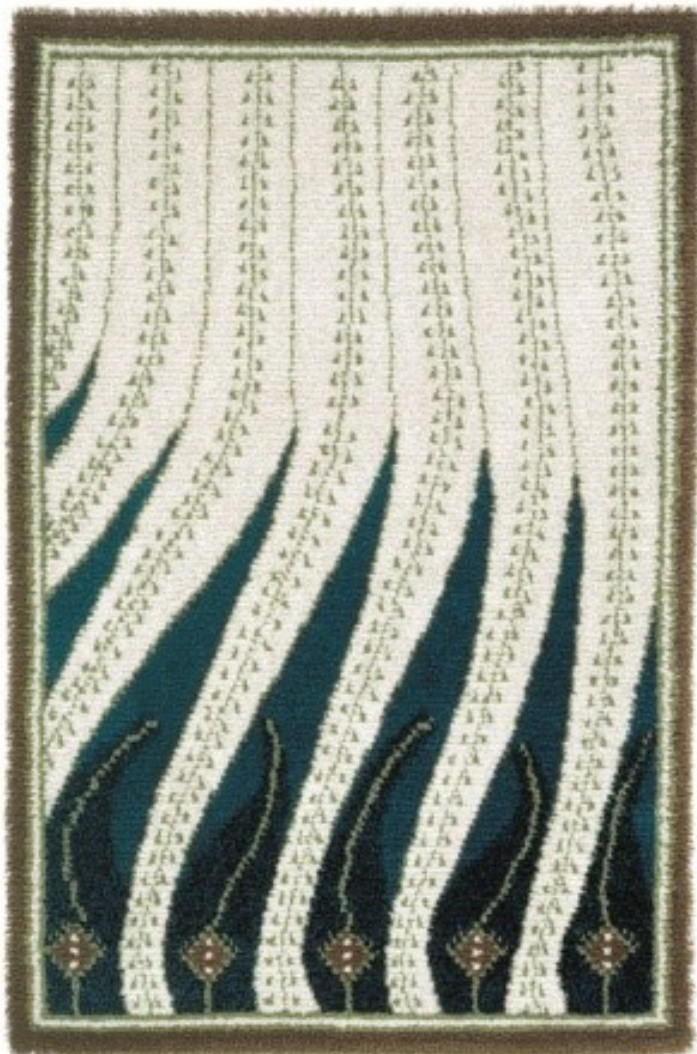
Kuva 4. Akseli Gallen-Kallela, Liekki, 1900 (Suomen Käsityön Ystävät c)

penkkiryijy, "Liekki", oli muiden tekstiilien tapaan valmistettu Suomen Käsityön Ystävissä. (Svinhufvud 2010, 16.) Tätä kuvan 4 jugend-tyylistä ryijyä pidetään modernin ryijytaiteen suunnannäyttäjänä (Suomen Käsityön Ystävät b).