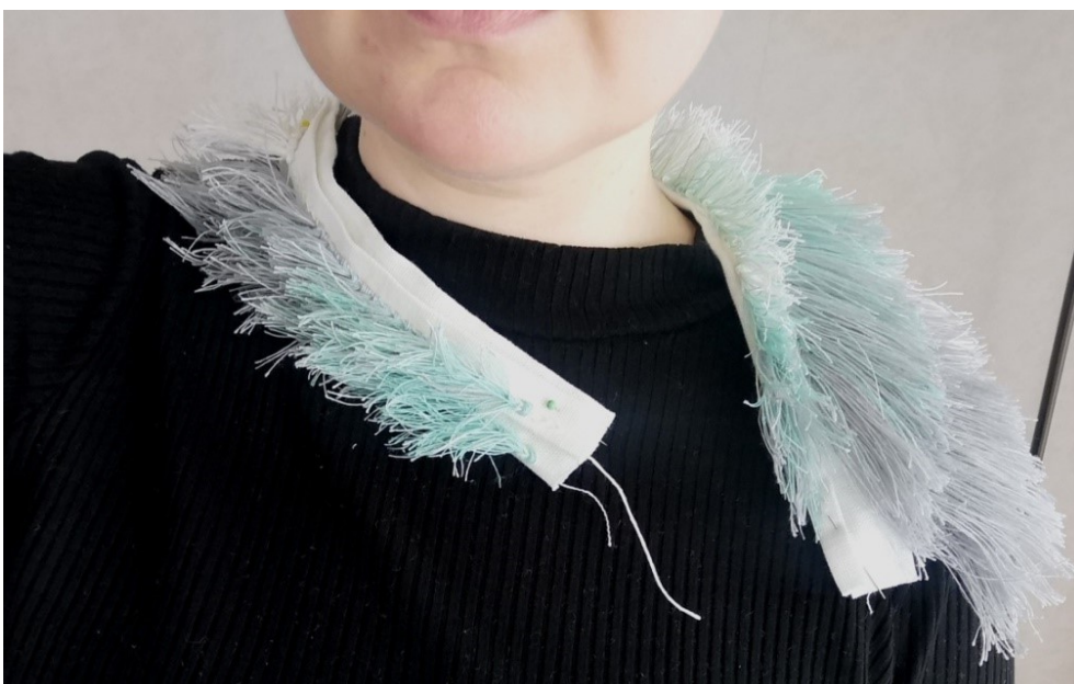
Kuva 20. Teoksen asettelun suunnittelua

Työskentelyn edetessä ja aikataulun tiukentuessa ajatus monia osia ja metallirakenteita sisältävästä rintakorusta tuntui liian haastavalta. Vaihdoin tavoitteeksi kaulan ympäri kiertyvän teoksen, jossa rakenteena on yksinkertainen muotoon vasaroitu paksu hopealanka. Langan valmistus olisi riittävän nopeaa, mutta näyttävyys säilyisi. Tekstiiliosia tulisi kaksi, jo valmistunut isompi osa sekä samankaltainen pienempi osa. Kuvassa 20 esitetään ajatus teoksen asettelusta hartioille. Rakenteen suunnittelussa käytin apuna prosessin alussa syntynyttä kokeilukappaletta.