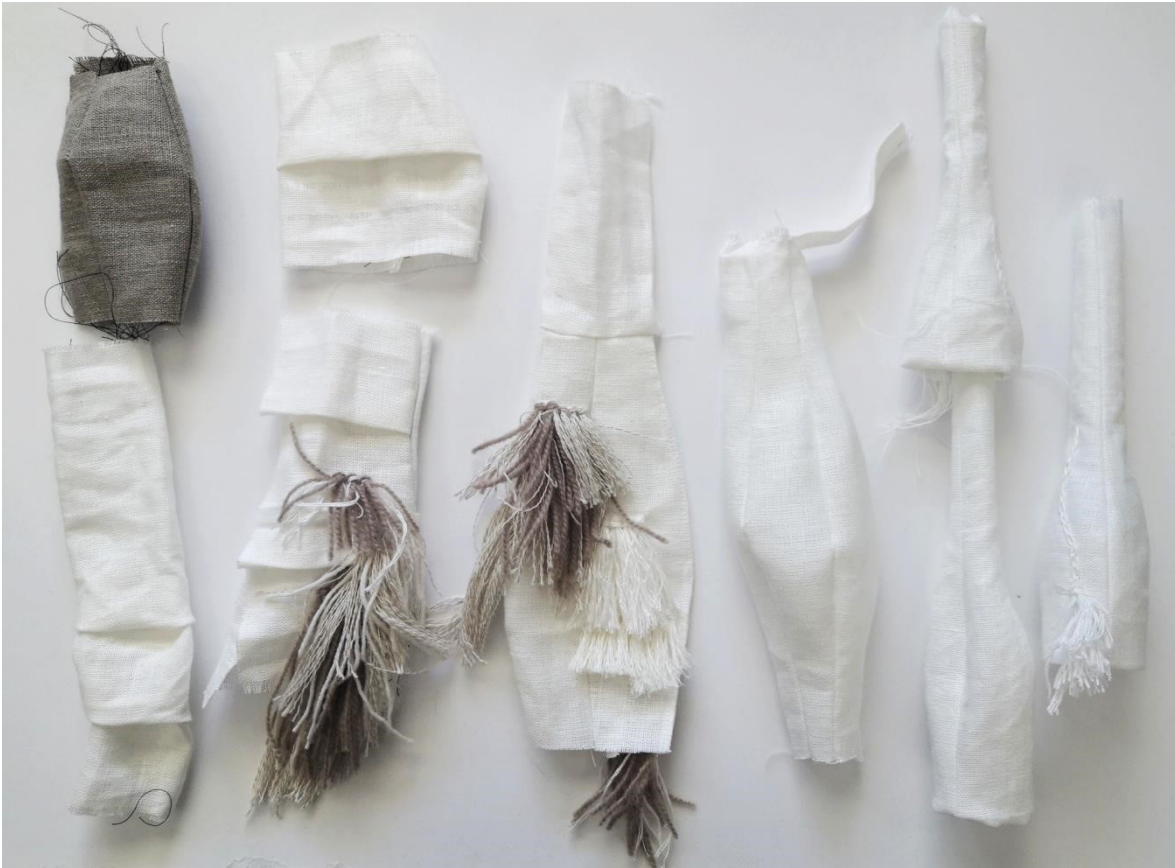
Kuva 23. Pisaramuodon löytyminen