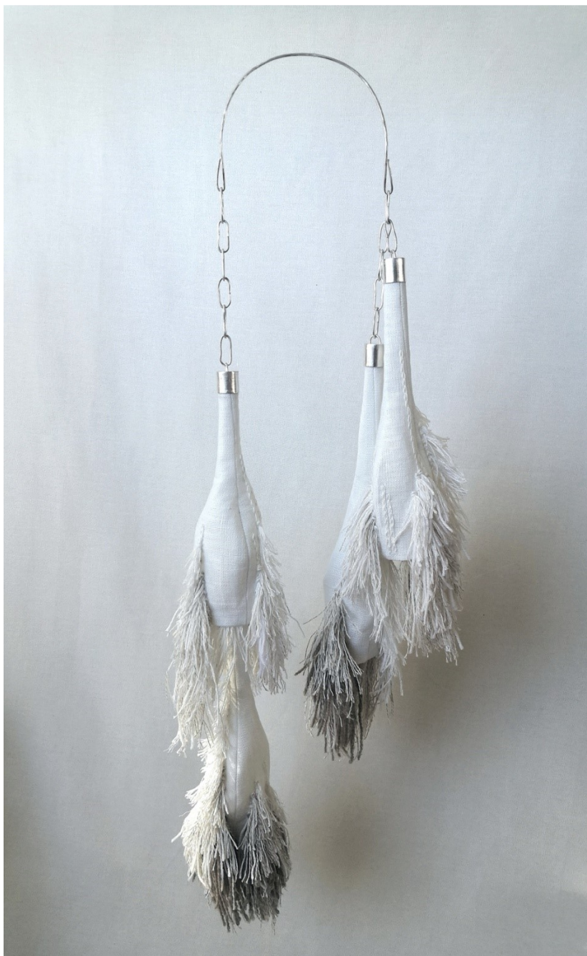
Kuva 27. Harmauden tuntu , 2023, pellava, villa, puuvilla, hopea, 68 x 22 x 12 cm

Harmauden tuntu , ryijy keholle, on valmistettu pellavasta, villasta, puuvillasta ja hopeasta (Kuva 27). Teos ripustetaan niskan taakse (Kuva 28) tai sitä voi kantaa myös muuten.