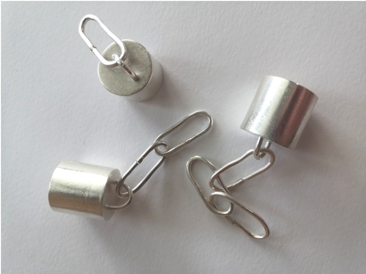
Kuva 33. Hopeaosia

Hopeaosien toimivuus on molemmissa teoksissa kohtalaisen onnistunut. Halusin ilmaista talvista kylmää säätä metallin ihokosketuksen avulla, mutta myös tekemällä hopean pintaan jäätä inspiroitunutta tekstuuria. Hopeiset ketjulenkit ovat tarkoituksella hieman erimuotoisia, jotta niissä olisi vaihtelevien valumien tunnelmaa (Kuva 33).