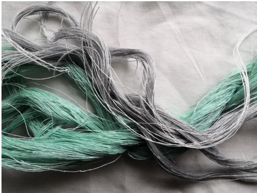
Kuva 13. Aivnapellavaa Viima-teokseen

ohut pellavalanka, jota kutsutaan aivnapellavaksi, on hieman kiiltävöpintaista ja helposti muotoutuvaa, joten se soveltui suunnitelmaani hyvin. Näiden lankojen lisäksi teokseen valikoitui myöhemmin karkeampi ja jäykempi ohut valkoinen pellavalanka.