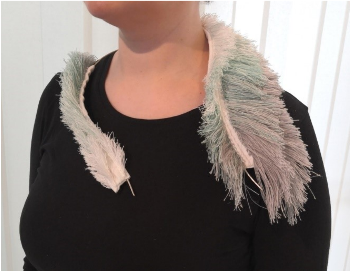
Kuva 30. Kylmyyden halaus keholle ripustettuna