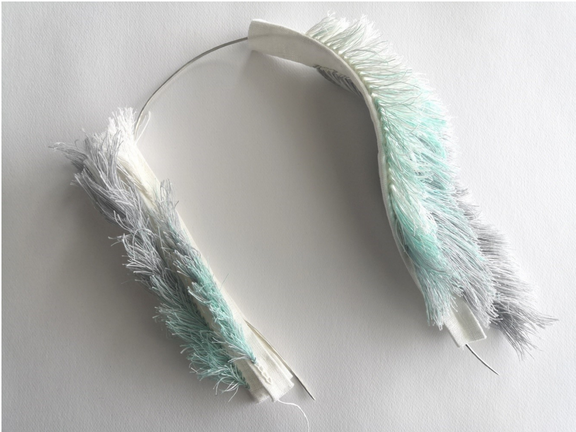
Kuva 21. Toisen tekstiiliosan suunnittelua

Kuvassa 21 on jo valmis muotoon vasaroitu hopealanka, joka on pujotettu isomman tekstiiliosan sisälle kapeaan kujaan.