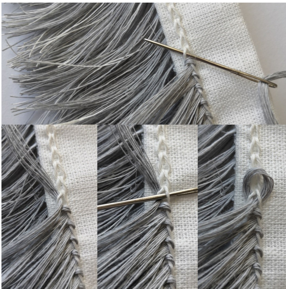
Kuva 17. Gordionin solmun ompelu ketjusilmukkapistoihin

Kokeilujen myötä kehitin sattumalta oman tavan ommella nukkasolmuja kankaaseen. Perinteisessä Gordionin solmussa nukkalangat kiertyvät kahden pystysuuntaisen loimilangan ympärille. Valitsemani pellavakangas oli tiheää, joten sen läpi oli vaikeaa ommella paksuja lankanippuja. Etsin tapaa, jolla ompelisin solmut kankaan pintaan niin, että kangas ei veny. Päädyin kokeilemaan ketjusilmukkapistojen kirjailua kankaaseen, ja siten syntyi nukkasolmulle sopiva pohja (Kuva 17). Tekniikka mahdollisti kauniin ja siistin lopputuloksen, joka oli minulle tärkeä tavoite työskentelyssä. Oman tekniikan kehittäminen oli ensimmäinen askel kohti perinnekäsityön ja nykytaiteen yhteen sulauttamista.