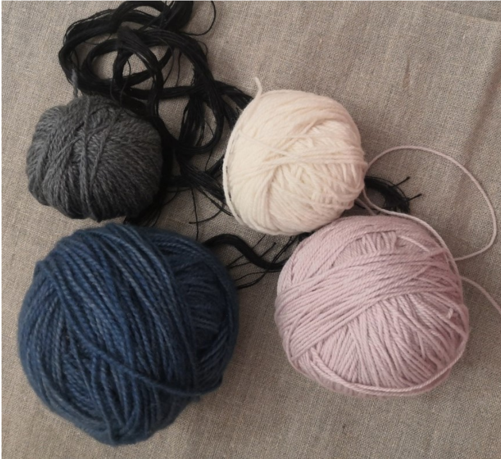
Kuva 15. Lankoja Avanto-teokseen

Avannossa käymisen kokemus tai jo pelkkä ajatus siitä, on kontrasteja täynnä. Valitsin tummia ja kylmiä sävyjä kuvaamaan vettä ja vaaleita, puhtaita sävyjä kuvaamaan jään päällä olevaa kimaltavaa lunta ja viileää ilmaa (Kuva 15).