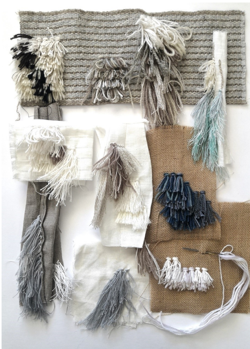
Kuva 16. Nukkalanka- ja materiaalikokeiluja prosessin eri vaiheissa

Työskentely alkoi kokeilemalla erilaisia lankoja ja pohjakankaita. Tein useampia nukkalankasekoituksia ja ompelin niitä pellava- ja puuvillakankaisiin (Kuva 16). Kokeilut antoivat käsitystä siitä, mitkä materiaalit toimivat yhdessä, ja mitä niistä mahdollisesti valitsen teoksiin. Rakensin prototyyppiosia myös muista materiaaleista, kuten paperista, mutta huomasin nopeasti, että se ei anna oikeanlaista kuvaa materiaalien toimivuudesta. Liimakan-kaalla vahvistettu pellavakangas vaikutti heti hyvältä valinnalta teosten pohjakankaaksi sen siistin pinnan ja napakkuuden vuoksi. Laadukas valkoinen kangas soveltui hyvin valitsemaani talviteemaan ja myös näyttäisi arvokkaalta hopean rinnalla.