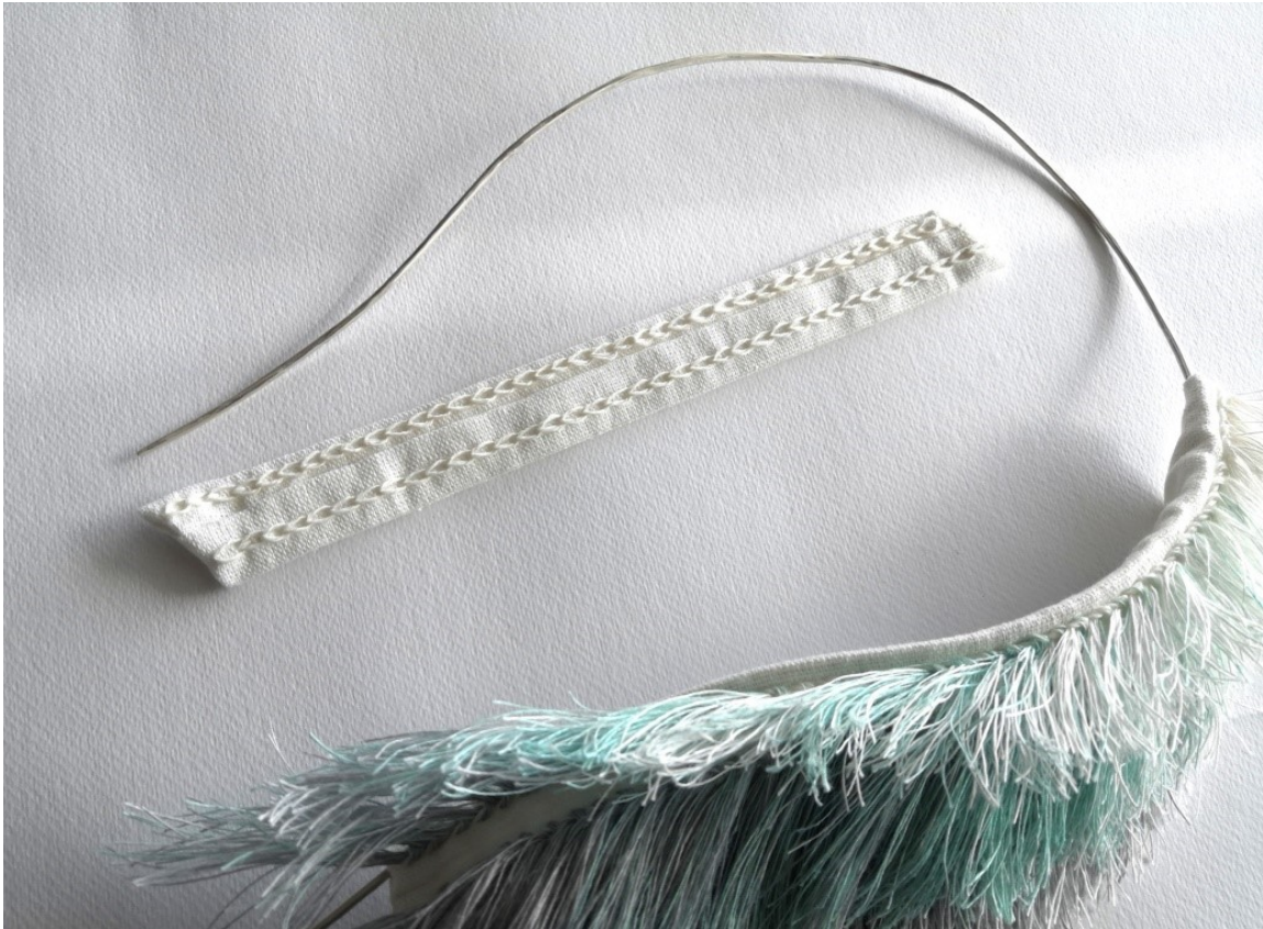
Kuva 22. Viiman toinen osa ennen nukan ompelua