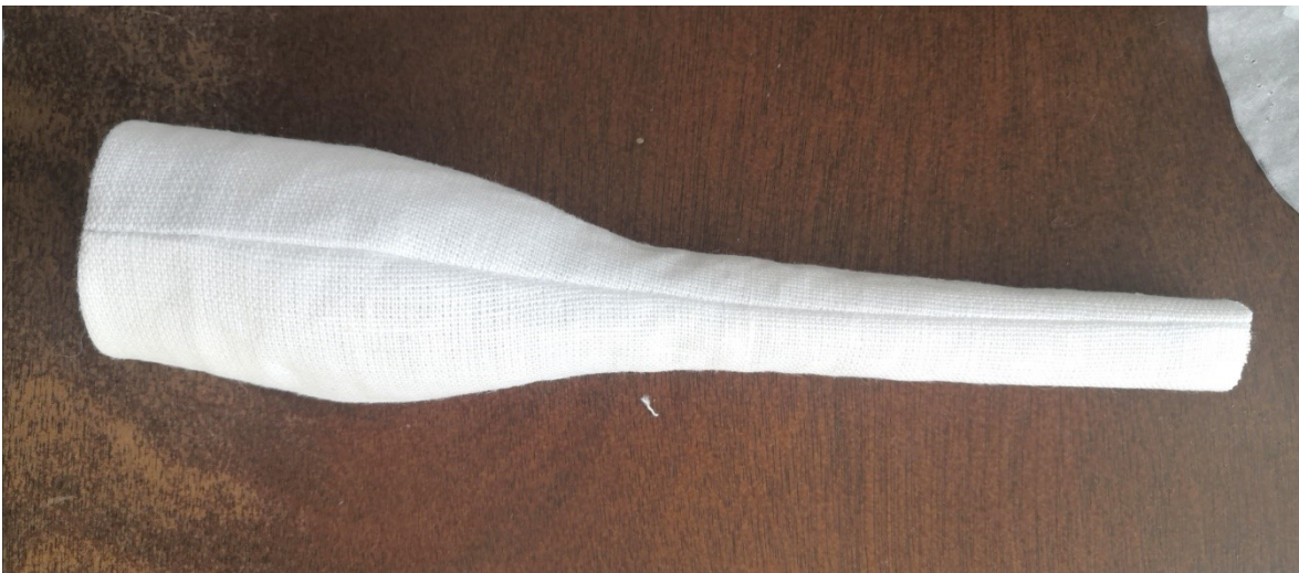
Kuva 24. Pisaran mallikappale

Pisaran muotoiset osat tuntuivat välittömästi teemaan sopivalta valinnalta, koska räntäsade on märkää. Tämän muodon kautta teokselle löytyi ajatus ilmentää valittua säälmiötä ja työskentelyn suunta selkeni.