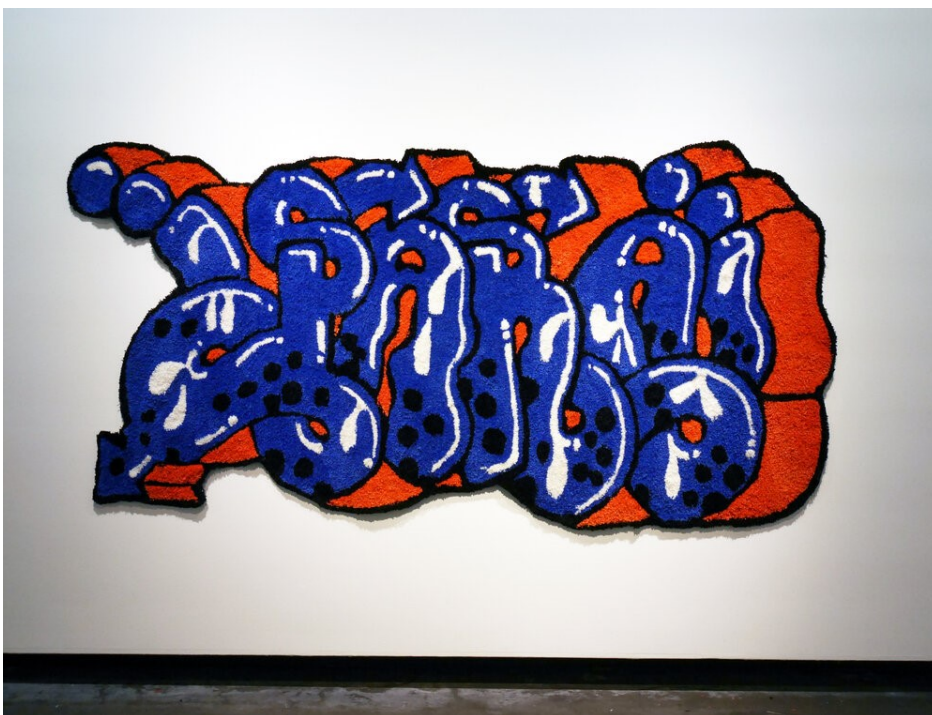
Kuva 10. Niina Mantsinen, Para, 2020 (Mantsinen 2023)

Ryijyn kuvitus on monipuolista ja muoto vapaa, mm. värikkäät katutaide- tai sarjakuva-tyyliset ryijyt ovat suosittuja. Niina Mantsisen tuftattu teos kuvassa 10 on hyvä esimerkki ryijyperinteen risteyttämisestä nykytaiteeseen.