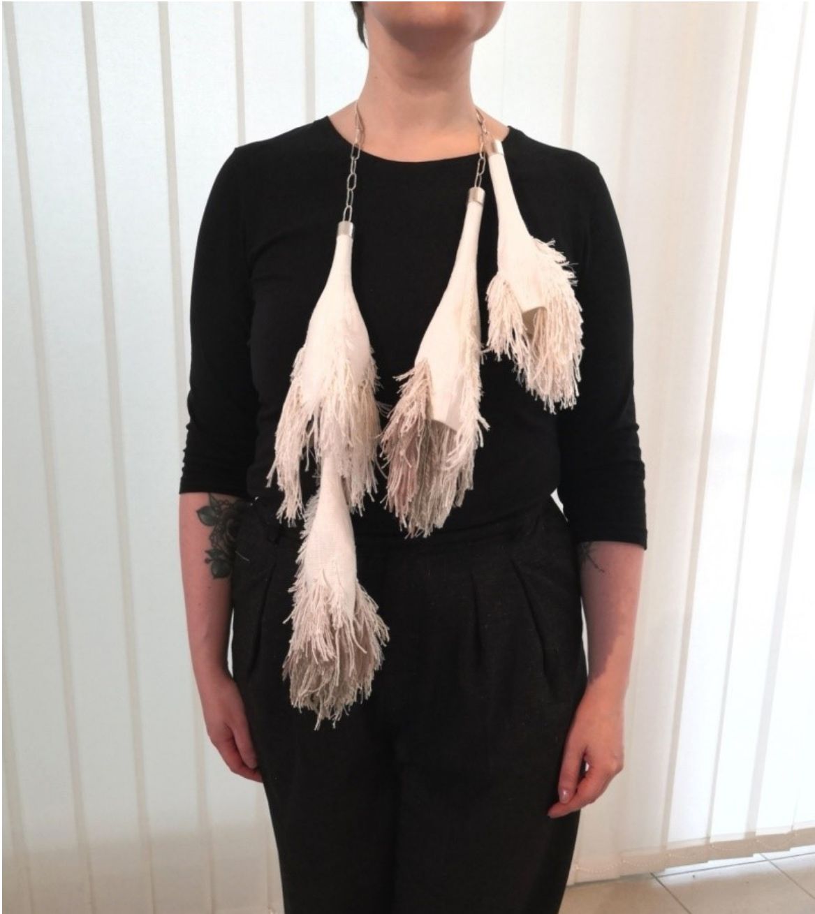
Kuva 28. Harmauden tuntu keholla