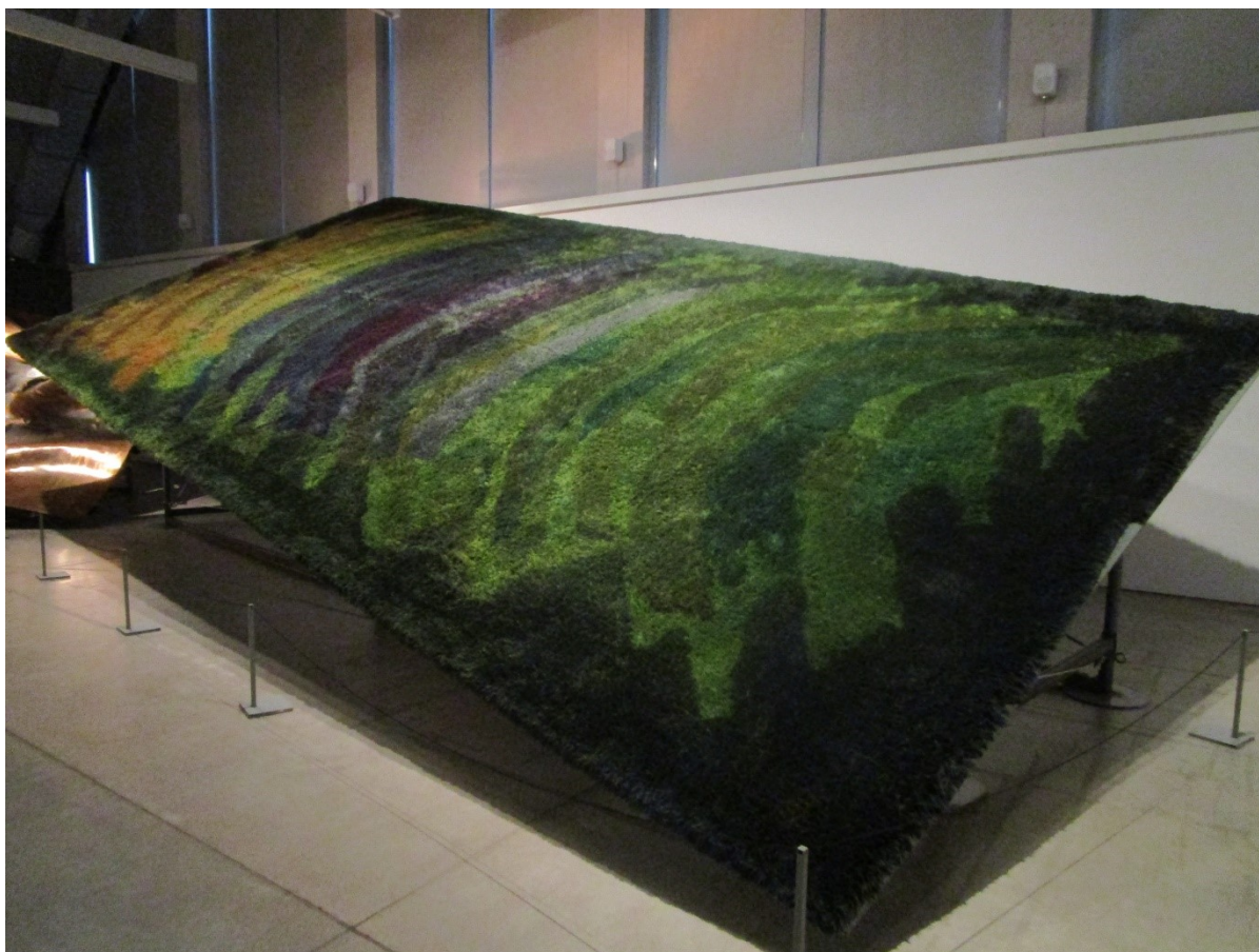
Kuva 7. Uhra Simberg-Ehrström, Metsä, 1967 (Kimmo Pyykkö -taidemuseo 2019)

1900-luvun puoleessa välissä ryijytaide muuttui yhä vapaammaksi ja värikkäämmäksi. Uhra Simberg-Ehrströmin (1914–1979) vaikutus ryijytaiteeseen oli huomattava. Hänen suurissa ryijyissään on runsas värimaailma ja liukuvat maalaukselliset pinnat, mistä on syntynyt ilmaisu valööriryijy. Vuonna 1967 syntyi 40 neliömetrin kokoinen ”Metsä”-ryijy (Kuva 7), joka esiteltiin Montrealin maailmannäyttelyssä. Toteutukseen on käytetty yli 300 eri sävyä. (Suomen Käsityön Ystävät b.)