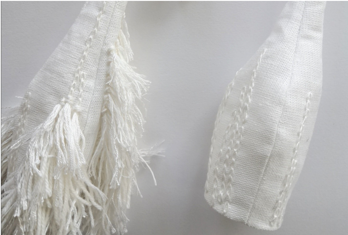
Kuva 25. Pisaraosien vaiheita

Valmistin yhteensä viisi hieman vaihtelevan kokoista pisaraa, joihin kirjailin ketjusilmukoita ryijynukkaa varten (Kuva 25). Teoksen lopullinen muoto oli selkeytynyt: ”räntäpisarat” asettuvat kaulan molemmin puolin, valuen raskaina alaspäin hopeaosien päistä. Teokseen tuli lopulta neljä tekstiiliosaa, joista kaksi yhdistin niin, että toinen pisara roikkuu toisen sisältä. Pisarat ovat ontoja ja niiden sisällä on kevyt tekstiilivuoritus, joka piilottaa ompeluiden nurjan puolen ja kankaan saumavarat.