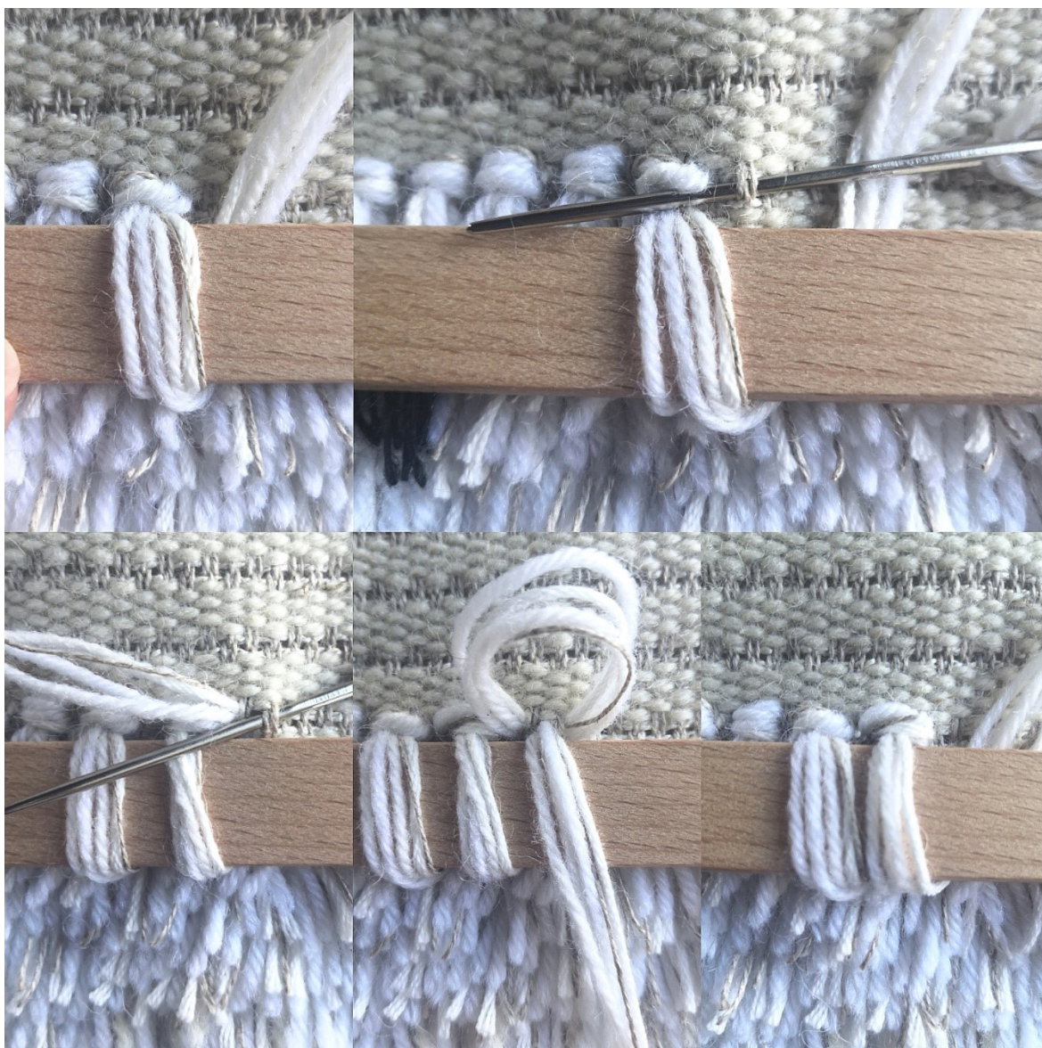
Kuva 3. Gordionin solmun ompelu neulalla