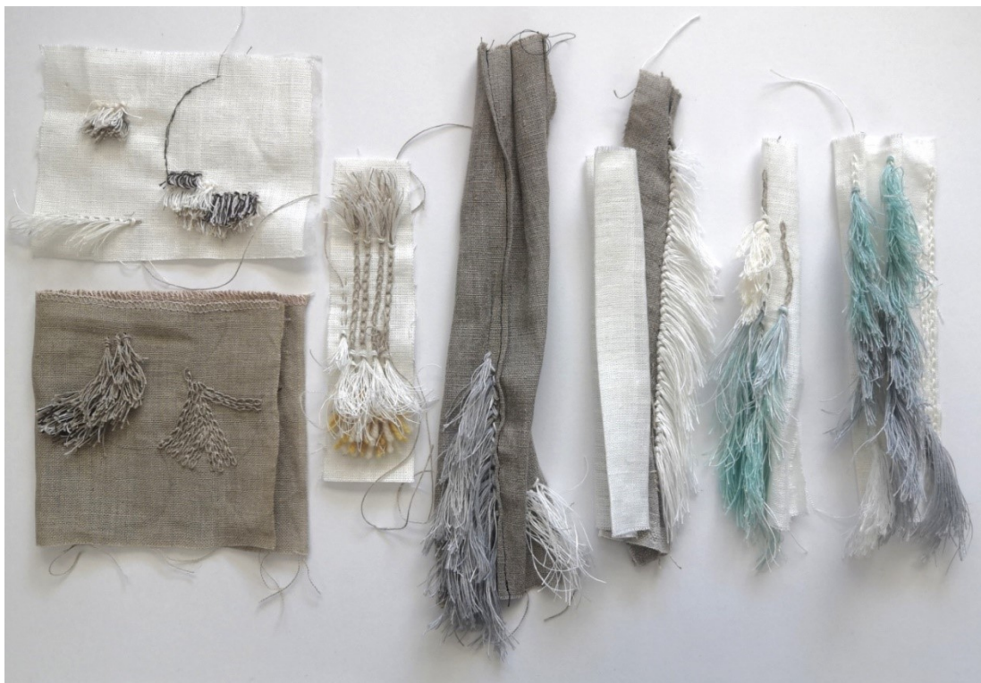
Kuva 18. Viima-teoksen suunnitteluvaiheita

Kuvassa 18 on Viima-teoksen materiaali- ja tekniikkavalintojen vaiheita. Halusin toteuttaa pitkittäisiä nukkarivejä tai tässä tapauksessa jonoja, jotka muodostavat kovaa tuulta ilmaisevaa liikkeen tuntua. Kankaisen pohjan muodoksi suunnittelin kapeita ja pitkiä osia. Kuva esittää oleellisia kokeiluja, joiden kautta Viima-teoksen muoto ja tekniikka kehittyivät, ja päätös lopullisista materiaaleista syntyi.