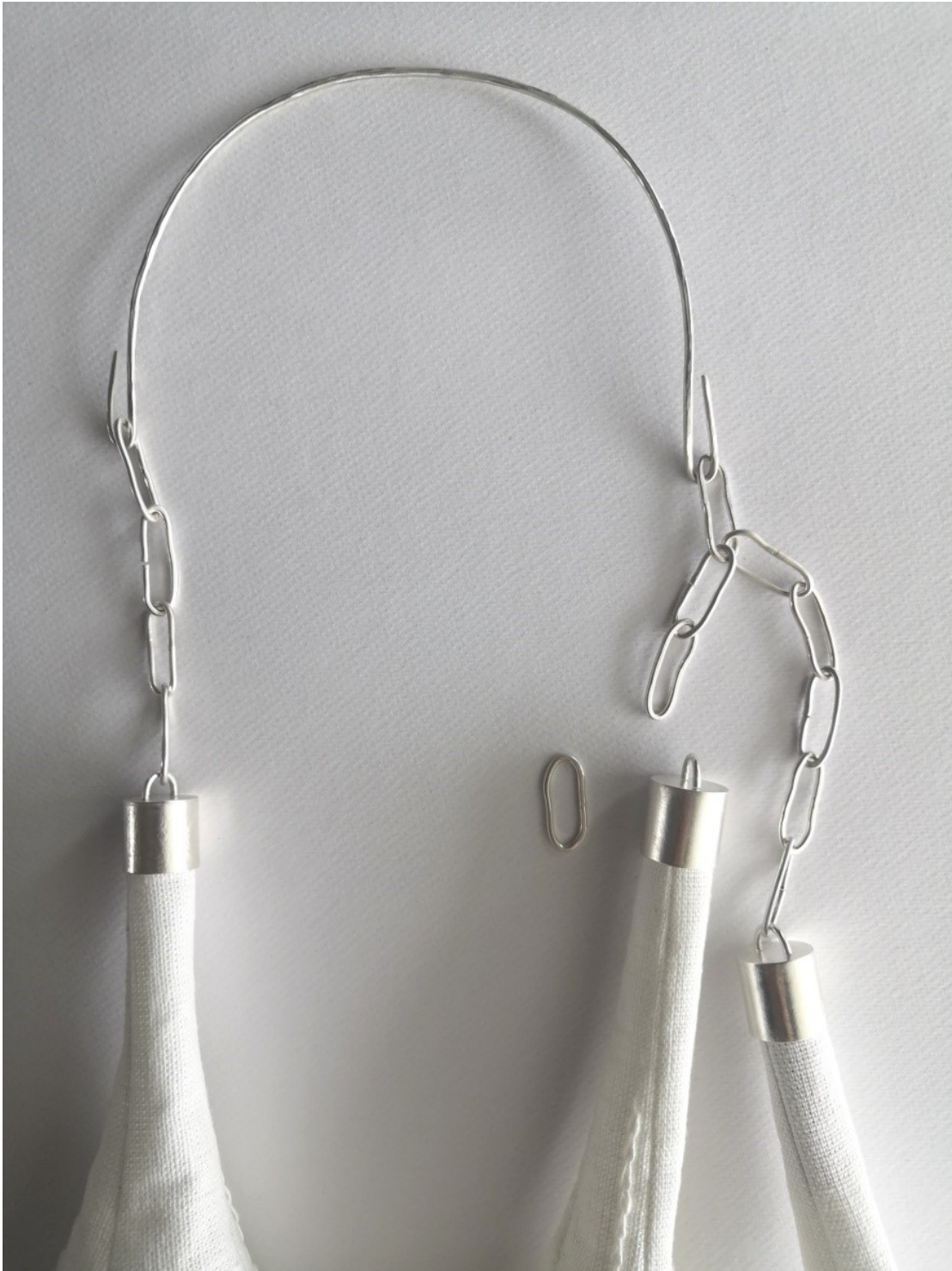
Kuva 26. Röntä-teoksen rakenteiden suunnittelua

Tekstiiliosien sisälle kiinnitin pyöreät puutapit, jotta osat istuisivat napakasti hopeaosiin. Hopealengkien lopullinen määrä varmistui sitten, kun olin valmistanut kaikki osat täysin valmiiksi ja kokeillut teoksen istuvuutta vartalolla. Halutessa lenkkejä voi lisätä tai poistaa, koska jätin ne auki.