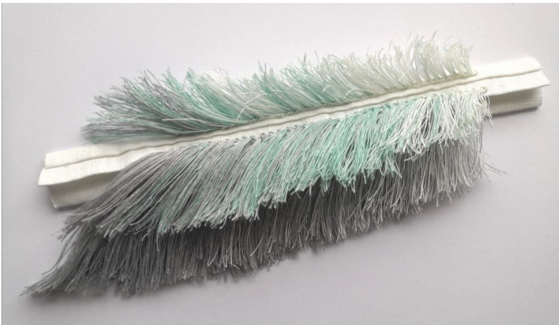
Kuva 19. Viiman ensimmäinen osa

Työskentelyn edetessä ja aikataulun tiukentuessa ajatus monia osia ja metallirakenteita sisältävästä rintakorusta tuntui liian haastavalta. Vaihdoin tavoitteeksi kaulan ympäri kiertyvän teoksen, jossa rakenteena on yksinkertainen muotoon vasaroitu paksu hopealanka. Langan valmistus olisi riittävän nopeaa, mutta näyttävyys säilyisi. Tekstiiliosia tulisi kaksi, jo valmistunut isompi osa sekä samankaltainen pienempi osa. Kuvassa 20 esitetään ajatus teoksen asettelusta hartioille. Rakenteen suunnittelussa käytin apuna prosessin alussa syntynyttä kokeilukappaletta.