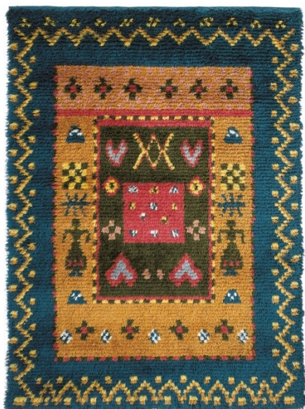
Kuva 1. Kangasala-ryijy (Suomen Käsityön Ystävät d)

Perinteisen ryijyn kuva-aiheet olivat geometrisia ennen 1900-luvun vaihdetta. Suosittu kuvio oli ns. verkonpohja, eli vinoruudutus. Geometristen kuviointien lisäksi kuva-aiheita otettiin mm. verhoilukankaista ja käyttötekstiileistä. Merkkausliinujen kirjaimet, numerot, eläimet, ihmishahmot ja kukkakuviot siirtyivät tyylielästä ryijyihin. Morsiusryijyihin kudottiin taikamerkkejä tai onnea tuovia symboleja kristillisten merkkien lisäksi. Elämänpuut, tiimalasit ja tulppaanit säilyttivät suosionsa sukupolvien ajan. Suvuilla oli omat tyyppilliset kuvionsa, joita varioitiin. Ryijyjen kuvioinnit vaihtelivat myös asuinalueen mukaan. (Sopanen & Willberg 2008, 23–34.) Kuva 1 esittää kansanomaisesti kuvioitua Kangasala-ryijyä.