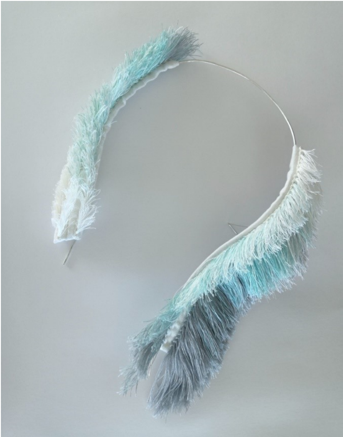
Kuva 29. Kylmyyden halaus , 2023, pellava, hopea, 40 x 28 x 6 cm

Kylmyyden halaus , ryijy keholle, on valmistettu pellavasta ja hopeasta (Kuva 29). Teos asetetaan hartioille, kuten kuvassa 30, tai kohtaan, joka miellyttää kantajaansa.