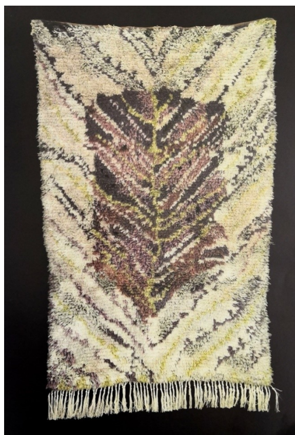
Kuva 5, vas. Eva Brummer, Sininen hetki, 186 x 128 cm (Designmuseo 2009, 113)