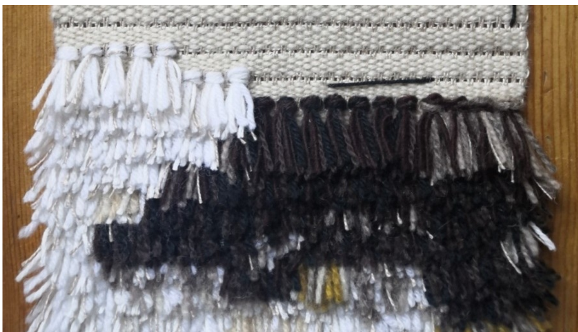
Kuva 2. Perinteinen laakanukkainen ryijy villasta, puuvillasta ja pellavasta

Ryjy voidaan toteuttaa eri tekniikoilla, perinteisimmin kangaspuissa kutoen tai käsin ommellen. Kuva 2 esittää neulalla ommeltua ryijypintaa valmiiseen kudottuun ryijypohjaan. Solmutyyppejä on erilaisia, tässä on käytetty hyvin yleistä Gordionin solmua (kutsutaan myös smyrnasolmuksi). Jokainen nukkatupsu ommellaan yksitellen neulalla. Kuvan ryijyn nukka muodostuu viiden langan yhdistelmästä, jolloin yhdessä tupsussa on 10 langanpätkää. Tätä nukkapintaa kutsutaan laakanukkaiseksi, koska nukan suunta on näkyvässä ja rivit erottuvat kerroksittain. Pinnan ja sävyjen vaihtelut saadaan varioimalla lankojen määrää, laatua ja nukan pituutta. (Karsikas 2016, 27–29.)