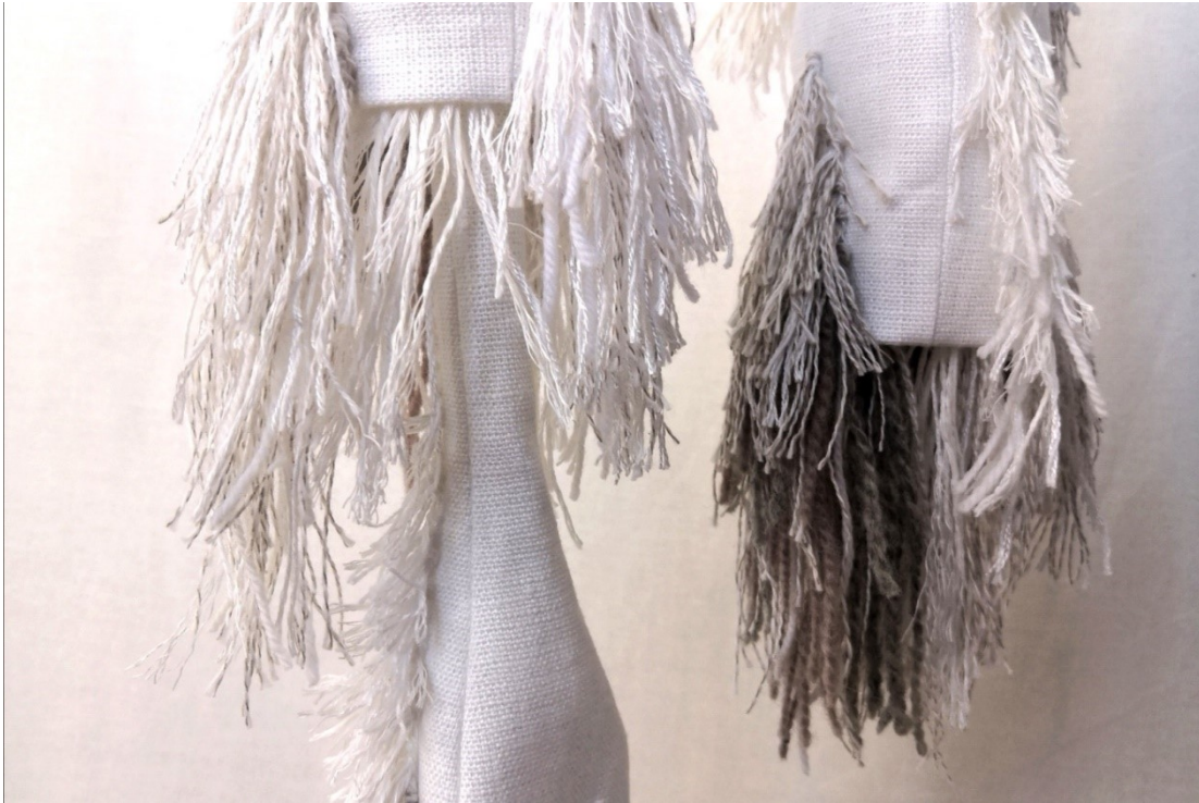
Kuva 31. Harmauden tuntu, yksityiskohta

Kylmyyden halaus -teoksen tekstiiliosissa pitkät pellavanukat toimivat hyvin ja tuovat haluamaani liikkeen tuntua teokseen (Kuva 32). Sävyt liukuvat hienosti tummasta vaaleaan, mikä korostaa tuulen kaltaista vaikutelmaa. Erilaatuiset langat käyttäytyivät eri tavoilla. Aivinapellava on pehmeämpää kuin teoksen valkoinen lanka, joten aivina soveltui paremmin pitkään nukkaan, jossa oli hyvä olla joustavuutta. Valkoinen karheampi pellavalanka piti muotonsa hyvin, joten sen avulla teokseen sai ryhdikkäitä muotoja. Tekstiiliosat muotoutuivat hopealangan avulla kauniisti vartalolle istuviksi.