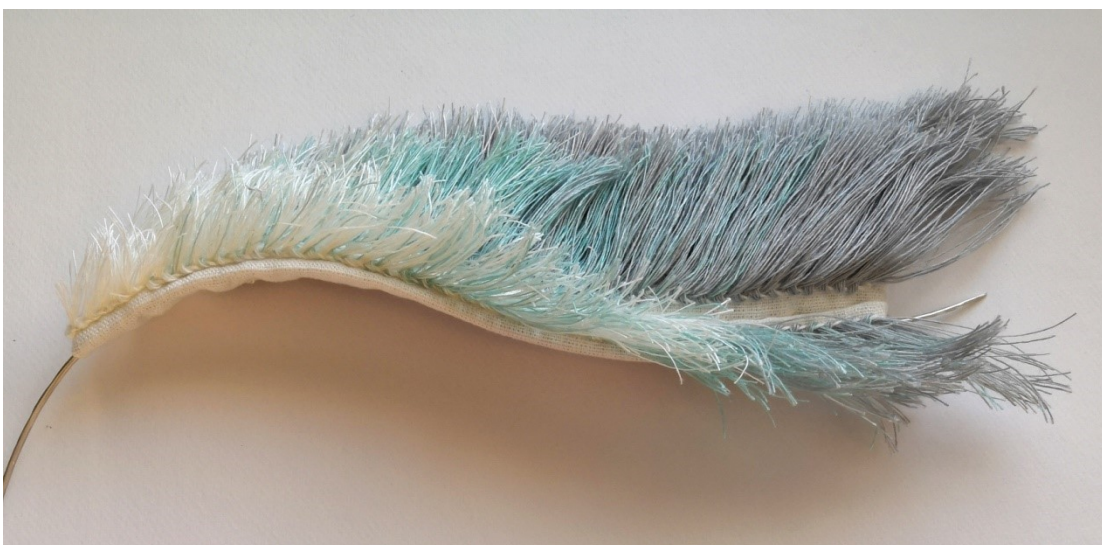
Kuva 32. Kylmyyden halaus, yksityiskohta

Kylmyyden halaus -teoksen tekstiiliosissa pitkät pellavanukat toimivat hyvin ja tuovat haluamaani liikkeen tuntua teokseen (Kuva 32). Sävyt liukuvat hienosti tummasta vaaleaan, mikä korostaa tuulen kaltaista vaikutelmaa. Erilaatuiset langat käyttäytyivät eri tavoilla. Aivinapellava on pehmeämpää kuin teoksen valkoinen lanka, joten aivina soveltui paremmin pitkään nukkaan, jossa oli hyvä olla joustavuutta. Valkoinen karheampi pellavalanka piti muotonsa hyvin, joten sen avulla teokseen sai ryhdikkäitä muotoja. Tekstiiliosat muotoutuivat hopealangan avulla kauniisti vartalolle istuviksi.