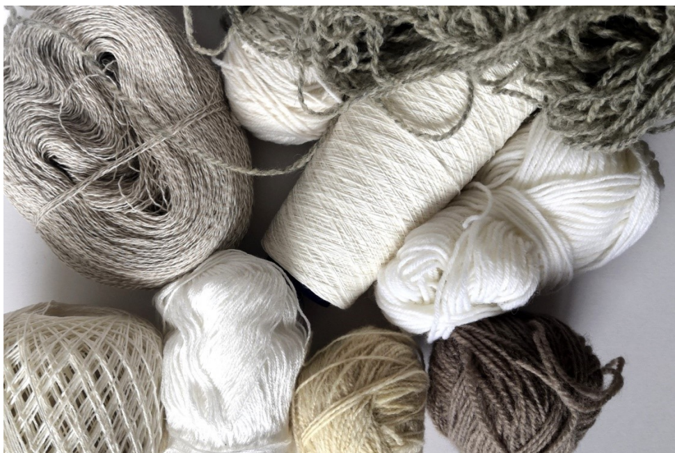
Kuva 14. Erilaisia lankoja Röntä-teokseen

Räntä-teokseen valitsin harmahtavia ja luonnonvalkoisia lankoja (Kuva 14). Erilaiset langat kuvaavat hyvin räntäsateen vaihtelevaa voimakkuutta ja tunnelmaa. Sävyt ovat neutraaleja, mutta myös vähän ankeita, kuten räntäkeli.