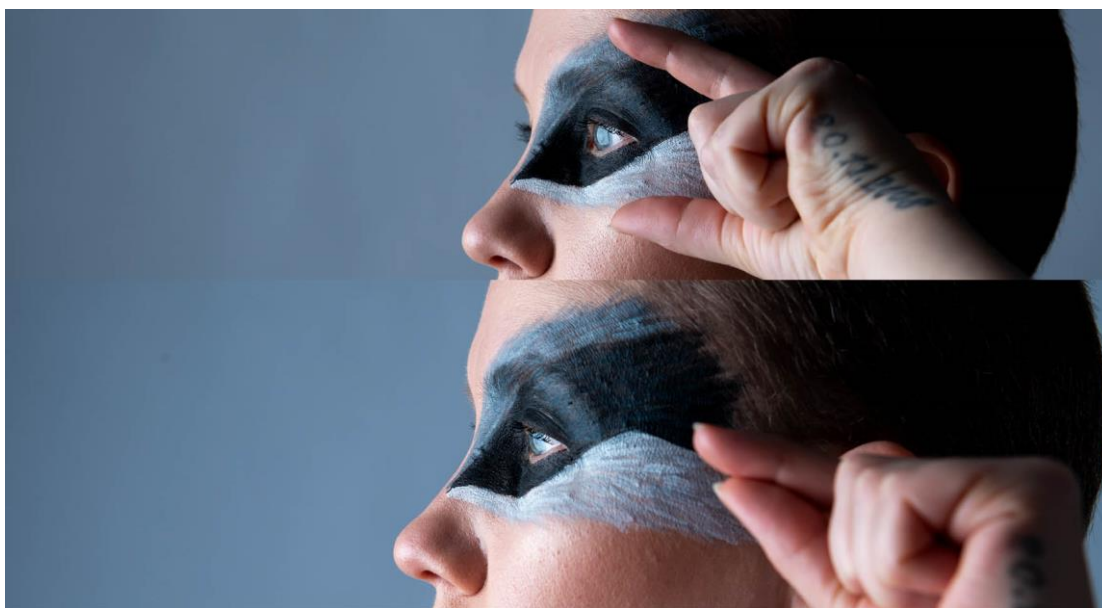
Kuva 6: Galleria Nosteen näyttelystä Viittoen, Mäyrä

Uusien mallien edessä taiteilijan tulee ollakin tyyni eikä tule kommentoida kenenkään ruuminosia, varsinkaan negatiivisesti.