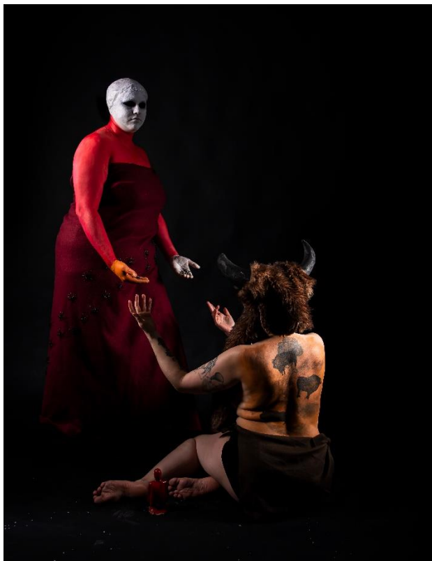
Kuva 15: Minna Heikkilä, Iktomi ja Tokahe, 2023, toinen versio

pään valkoiseksi, mustasin silmät onton näköisiksi, maalasin rintakehän sekä käsi- varret punaisella ja toisen käden keltaisella ja toisen punaisella. Mallin ympärille kiedottiin punainen huopa, johon ommeltiin kiinni hämähäkkejä. Iktomissa käytettiin samoja värejä kuin ensimmäisessä versiossa, mutta eri tavalla tuoden molemmat hahmot esille yhtä vahvasti sekä dramaattisesti. (Kuva 15)