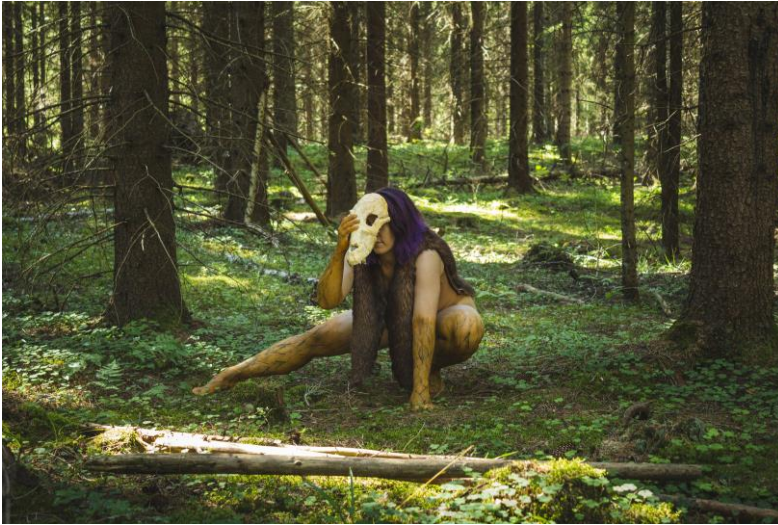
Kuva 7: Näyttelystä Unohdetut Suomen mytologian naiset, Hongotar