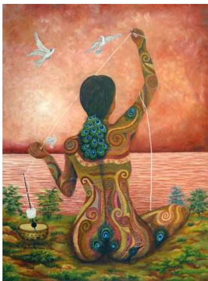
Kuva 5: Paula Nicho Cumez, Process and Vision of the Peace Accords, 2007, öljy kankaalle (Latin American cultural center)

Hän maalaa öljyväreillä kankaalle ja käyttää maalauksissaan vahvoja värejä sekä viivoja. Hän kuvaa itse maalaustapaansa surrealistiseksi ja hänen teoksistaan löytyy paljon mayojen kuuluisia jumalia sekä jumalattaria. (The Helen Moran collection.)