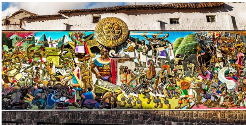
Kuva 4: Great Mural of Cusco, Juan Bravo Vizcarra, 1992