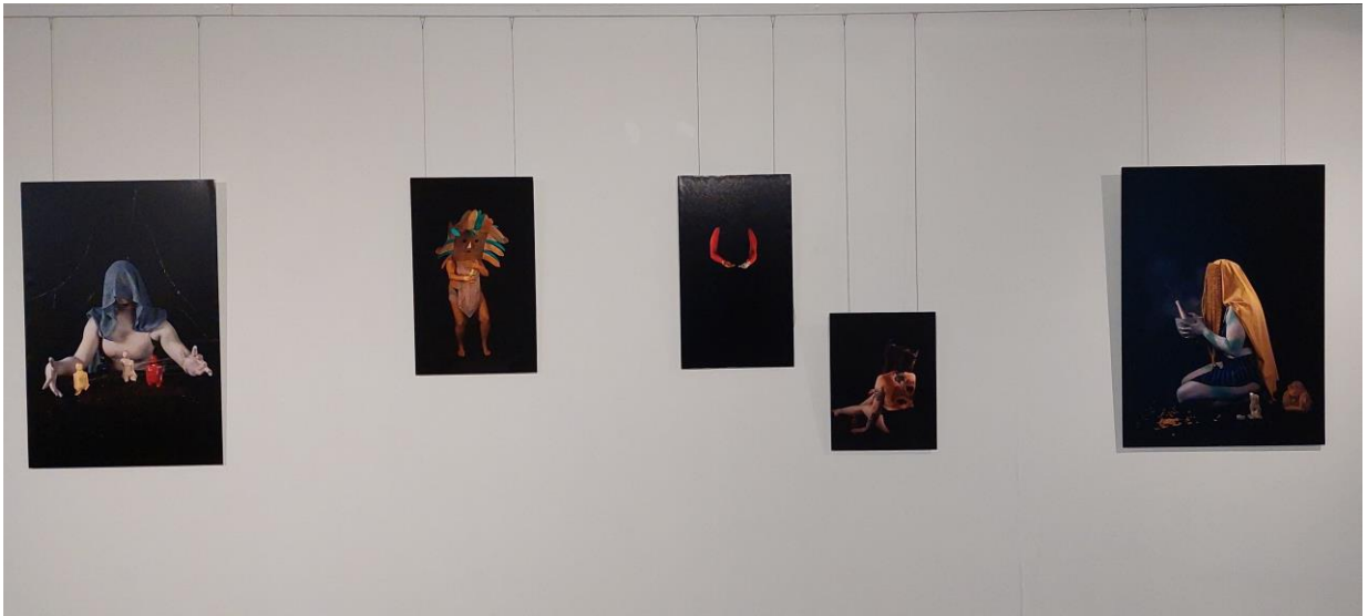
Kuva 18: Valokuvateos Ihmisen synty, Imatran taidemuseolla