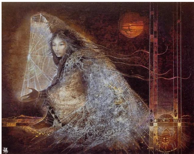
Kuva 3: Susan Seddon Boulet, Spider Woman kirjasta Goddesses, 1994 (Turningpoint gallery 2022)