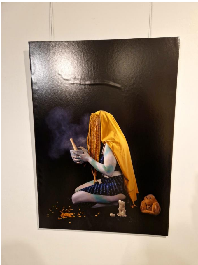
Kuva 17: Xmucane Imatran taidemuseossa esillä, pahiten kupristunut teos

Mutta kuvat kupruilivat, vaikka niitä kuin yritti silittää kiinni. Kukaan ei osaa sanoa mistä tämä johtuu eikä niitä voitu enää millään pelastaa.