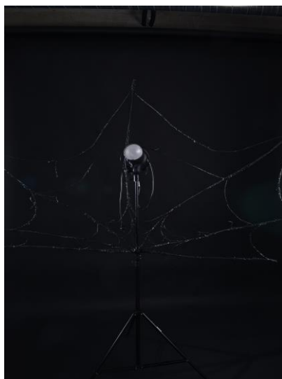
Kuva 8 ja 9: Keskeneräinen patsas ja valmisseitti koekuvauksissa