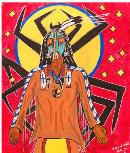
Kuva 2: Icke Wicasa, Iktomi, Akryyli kankaalle, 2017 (Wicasa 2022)

Wicasan teokset ovat enimmäkseen akryylimaalauksia kankaalle ja ne käsittelevät siouxien jumalia, rituaaleja sekä uskomuksia (Kuva 2). Hän on myös maalannut nahkaan sekä myös erilaisiin esineisiin. (Wicasa 2022.)