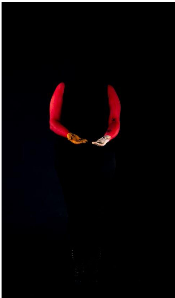
Kuva 13: Minna Heikkilä, Iktomi, 2023, mustesuihkuvedos dilite-levylle,

Iktomin nimi kääntyy suomeksi kujellija ja häntä on kuvailtu pitkäksi mieheksi, jonka keho on maalattu punaisella, valkoisella ja keltaisella maalilla ja hänellä oli mustat pitkät hiukset. Häntä kuvataan myös usein taiteessa hämähäkiksi tai hämähäkimäiseksi olennoiksi. Tämän vuoksi maalasin mallin kädet näitä värejä käyttäen ja mustat pitkät hiukset korvasin mustalla pipolla ja vaatteilla tuoden Iktomille ominaista mysteerisyyttä. Hämähäkit ovat taas mallin kädessä, joita hän ojentaa katsojalle ja näin houkuttelee katsojaa tulemaan luokseen (Kuva 13).