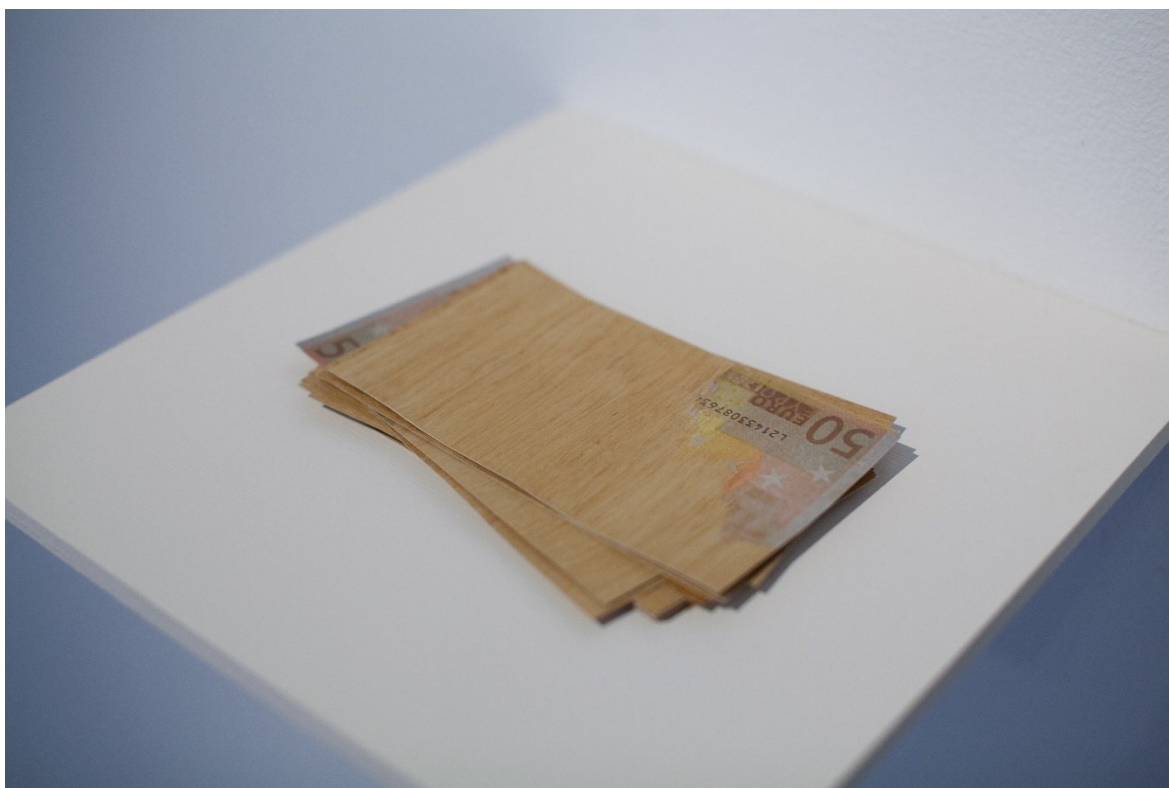
Kuva 10. Illusion of Value, 2023 kuvaaja: Ninni Kola

Tein teokselle pienen hyllylevyn, jonka päälle asettelin setelit. Teoksen olisi voinut laittaa myös jalustalle, mutta koin että jalustalla teosta katsottaisiin eri tavalla ja sitä katsottaisiin enemmänkin veistoksena kuin installaationa ja jalustalle nostaminen luo myös symbolista arvoa sille nostetuista asioista ja en halunnut nostaa seteleitä tai teosta arvoon. Halusin näyttää setelit sellaisina kuin ne itse koen. Kuvassa 10 on lopullinen installaatio museolla.