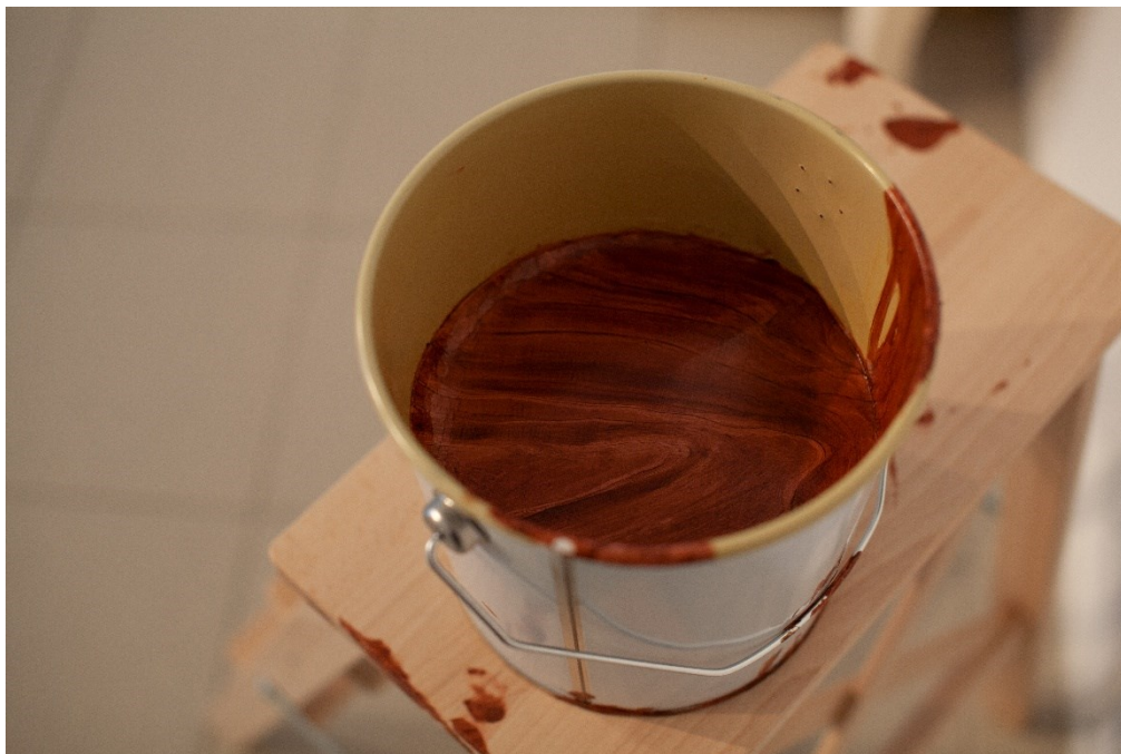
Kuva 7. Maalipurkki

Tämä ei onnistunut ja lopulta ratkaisin ongelman laittamalla maalipurkin sisään maitokartongin, jonka myös ootrasin. Koska maaliämpäri kapeni pohjaa kohti, kartonki rypistyi hieman reunoista, mutta mielestäni lopputuloksen kannalta tämä virhe teoksessa oli kohtalaisen pieni, eikä syönyt tehoa illuusiolta liiaksi (kuva 7).