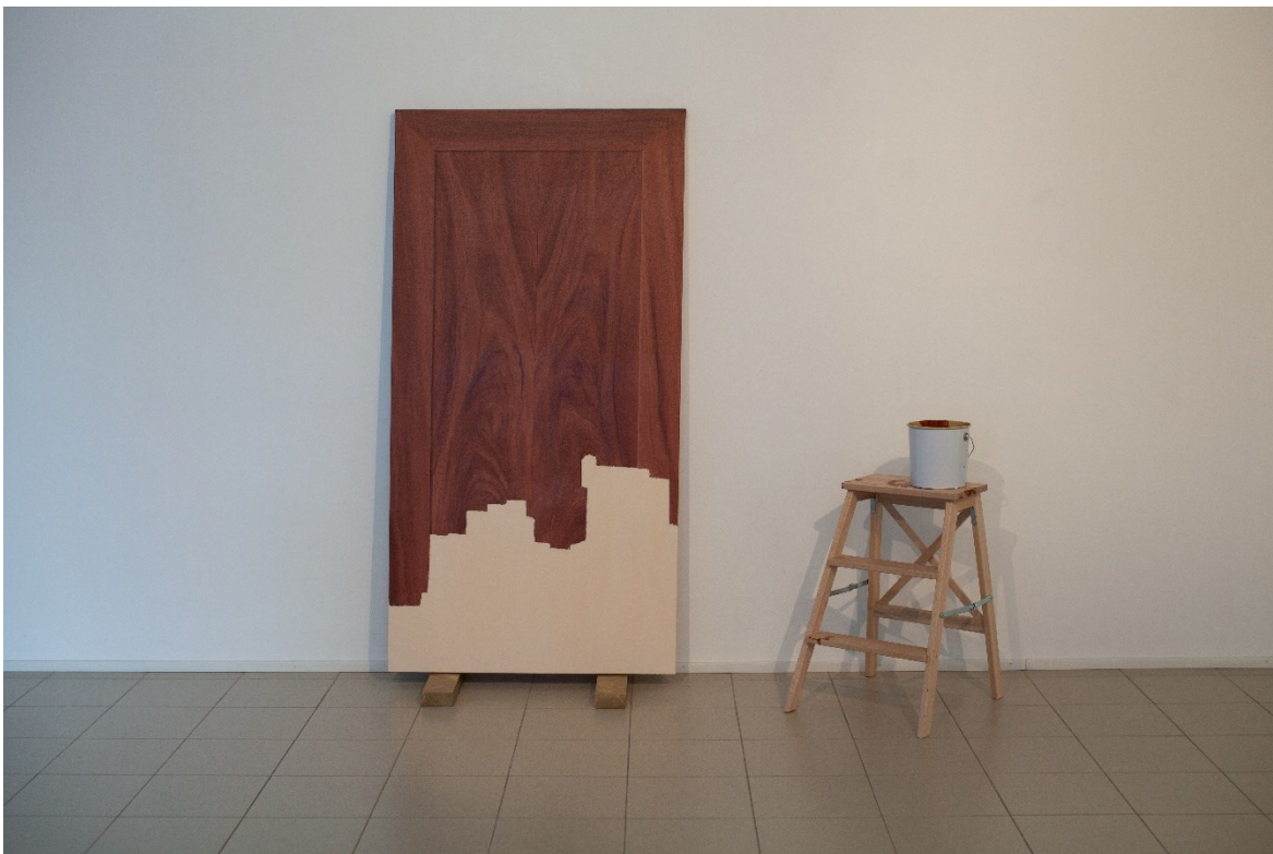
Kuva 9. Value of Illusion, 2023