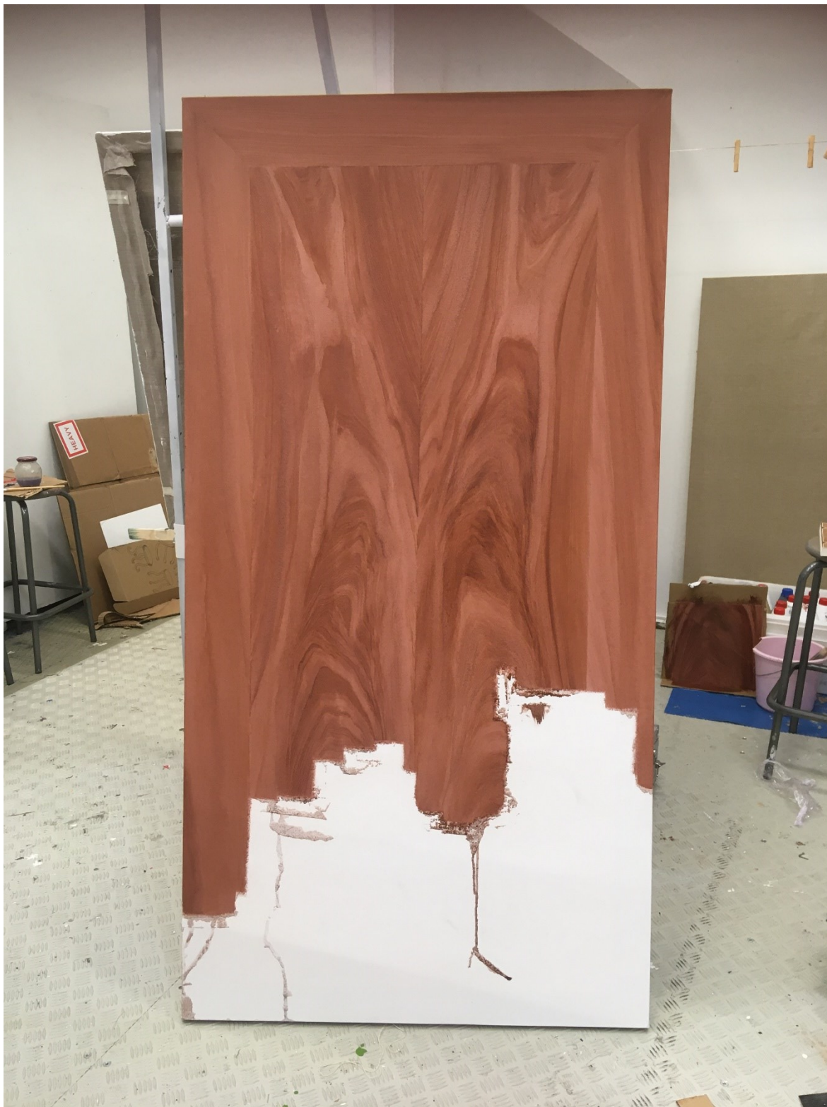
Kuva 6. Ootrausliemen valumat

Olin hankkinut installaatiota varten myös puijen jakkaran, jonka päälle asetan maalipurkin, jossa "puumaalia" on. Halusin maalata maalitahroja jakkaraan, jotta se näyttäisi enemmän siltä, että sitä on käytetty. Kastoin maalipurkin pohjan ootrauksen pohjamaaliin ja laitoin sen jakkaran päälle ja liikuttelin sitä hieman kuten voisin kuvitella sen maalaustyön aikana