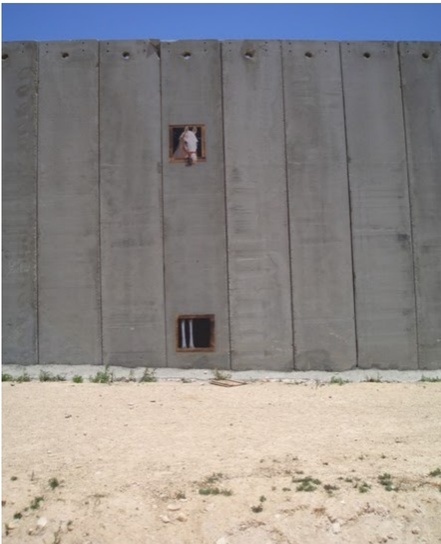
Kuva 2. Banksy, Segretation Wall, 2005 (Banksy)

Suomalaisista taiteilijoista Antti Oikarinen on työskennellyt myös illuusioiden parissa trompe l'œilin hengessä. Hänen näyttelyssään Maalauksia , oli esillä hyvin realistisesti maalattuja teoksia, jotka imitoivat häkellyttävän tarkasti mm. vaneria, lastulevyä sekä lautaa. Näyttelyn esittelytekstissä Serlachius-museoiden verkkosivuilla (Maalauksia 2017) todetaan seuraavaa: