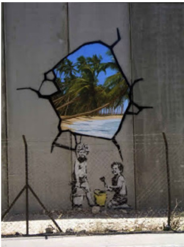
Kuva 1. Banksy, Secretation Wall, 2005 (Banksy)

Nykytaiteessa illuusiota ja trompe l'œilia hyödynnetään usein katutaiteessa. Nykytaiteilijoista mm. Banksy on toteuttanut useita muraaleja Palestiinassa sijaitsevaan muuriin tekniikkaa hyödyntäen. Kuvassa 1 on muuriin maalattu teos, jossa kaksi lasta tekee hiekkakakkuja muurissa ammottavan reiän edessä. Reiästä paljastuu kaunis hiekkaranta. Toisessa teoksessa samaisessa muurissa kuvassa 2 on maalattu ikkunat tai luukut, joissa ylemmässä näkyy hevosen pää ja alemmassa jalat. Teokset ilmentävät hyvin trompe l'œilin henkeä näillä illuusioilla, joista aukeaa jokin näkymä ja kuvassa 2 on mielestäni myös huumoria mukana.