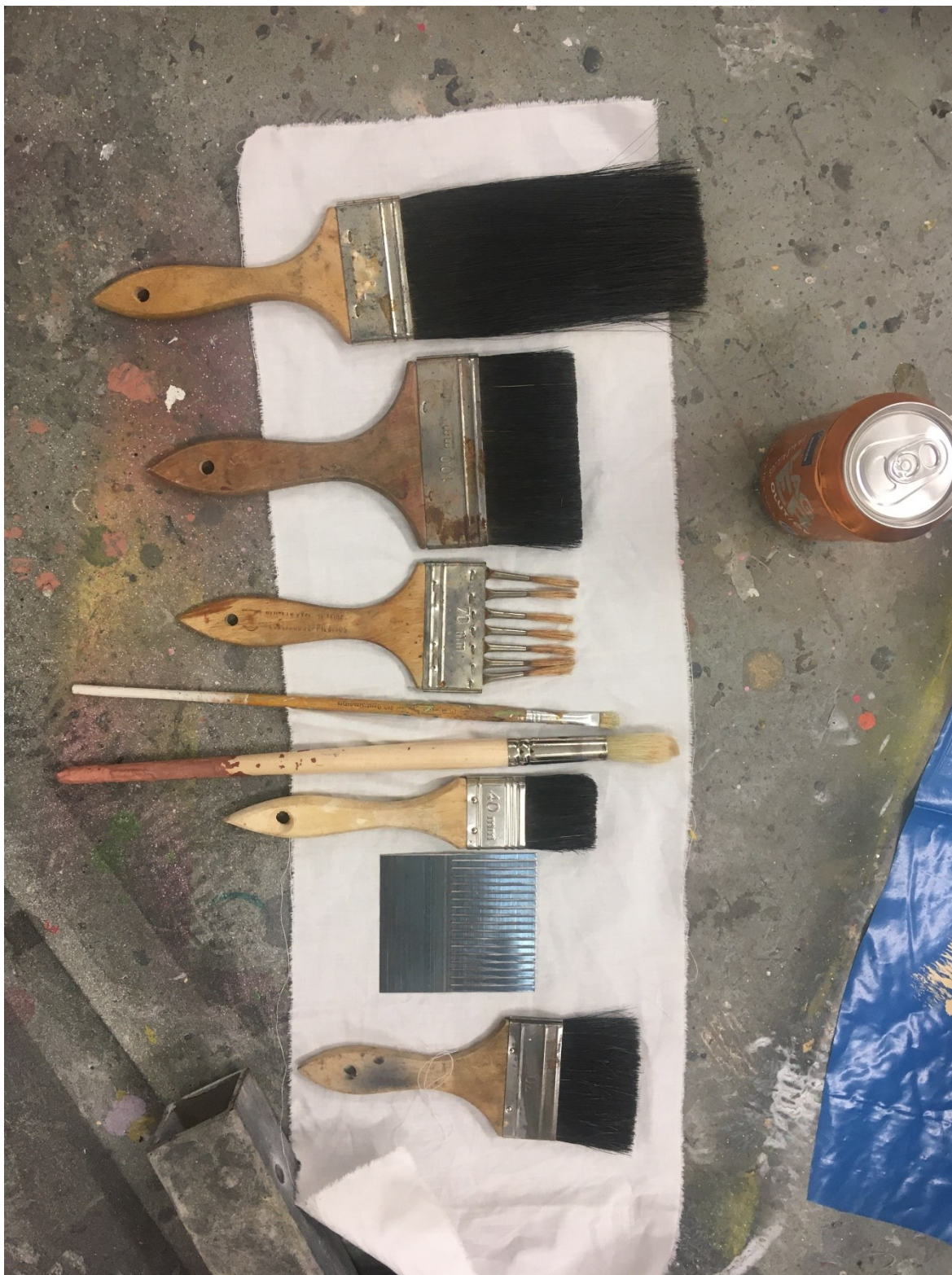
Kuva 3. Ootraustyövälineitä

sävyä ja syvyyttä ja yksityiskohtia. Lopullinen lakka valitaan yleensä puun tummuuden mukaan ja nyrkkisääntönä on, että tummalle puulle kiiltävä lakka ja vaalealle puulle himmeä.