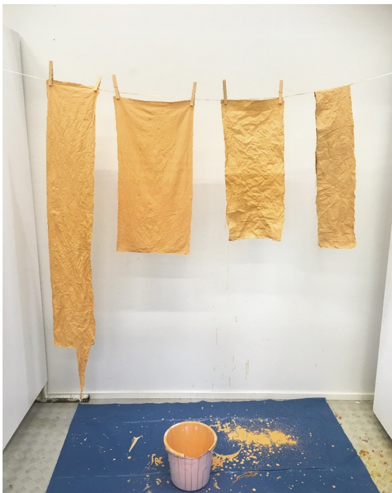
Kuva 4. Maalaukokeiluja erilaisille kankaille.

Lopulta päädyin illuusion paljastamisessa jättämään osan kuva-alasta maalaamatta. Tämä yrityksen ja erehdyksen prosessi, joka lopulta vei näinkin yksinkertaiseen ratkaisuun, vaikutti myös teoksen sisältöön oleellisesti. Siinä alkoi kiteytyä teoksen lopullinen muoto ja tarkoitus. Teoksessa maalari on aloittanut työnsä, mutta se on jäänyt kesken. Tämä sai ajatuksiani uusille urille ja hieman humoristisen idean maalipurkista, jossa olisi ”puumaalia” valmiina, jota voisi helposti sivellä maalattavaan pintaan ja se muuttuisi puuksi kuin itsestään. Tästä pienestä huumorista ja eräänlaisesta tuplahuijauksesta löysin myös linkin trompe l’œilin luonteeseen, jota käsittelen luvussa 2.1. Teknisen taituruuden näyttäminen tällaisessa valossa, kuin se olisi helppoa ja huoletonta ja syntyisi kuin itsestään, luo jännittävän ristiriidan. Pohdin myös voisiko ripustuksella paljastaa illuusion ja voisiko teoksella olla jonkinlainen tuki, jolla se seisoisi, jolloin katsoja pääsisi sen kiertämään. Totesin kuitenkin, että tällainen tukirakenne veisi liikaa huomiota teokselta ja koin, että siitä tulisi väkisinkin osa näin vähäeleistä teosta ja se muuttaisi teoksen tulkintaa.