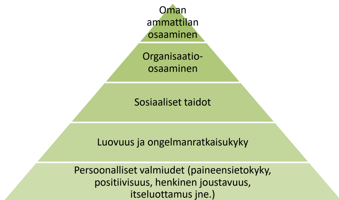
Kuva 1. Osaamispyramidi (Viitala 2006, 116)