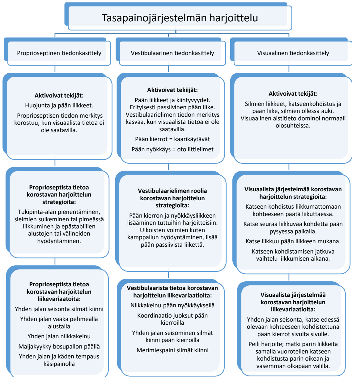
Kuvio 3: Tasapainojärjestelmän harjoittelu (Lesinski ym. 2015; Jeffreys 2006; Moreira ym. 2021; Klostermann & Hossner 2018; Jaakkola 2010; Kauranen 2011; Carriot ym. 2013; Zemková 2014 mukailten)

päätöksentekoon. (Moreira ym. 2021.) Sarto ja kumppanit (2020) ehdottavat, että kognitiiviset harjoitteet fyysisten tai motoristen harjoitteiden aikana olisivat mahdollisimman lajispesifejä.