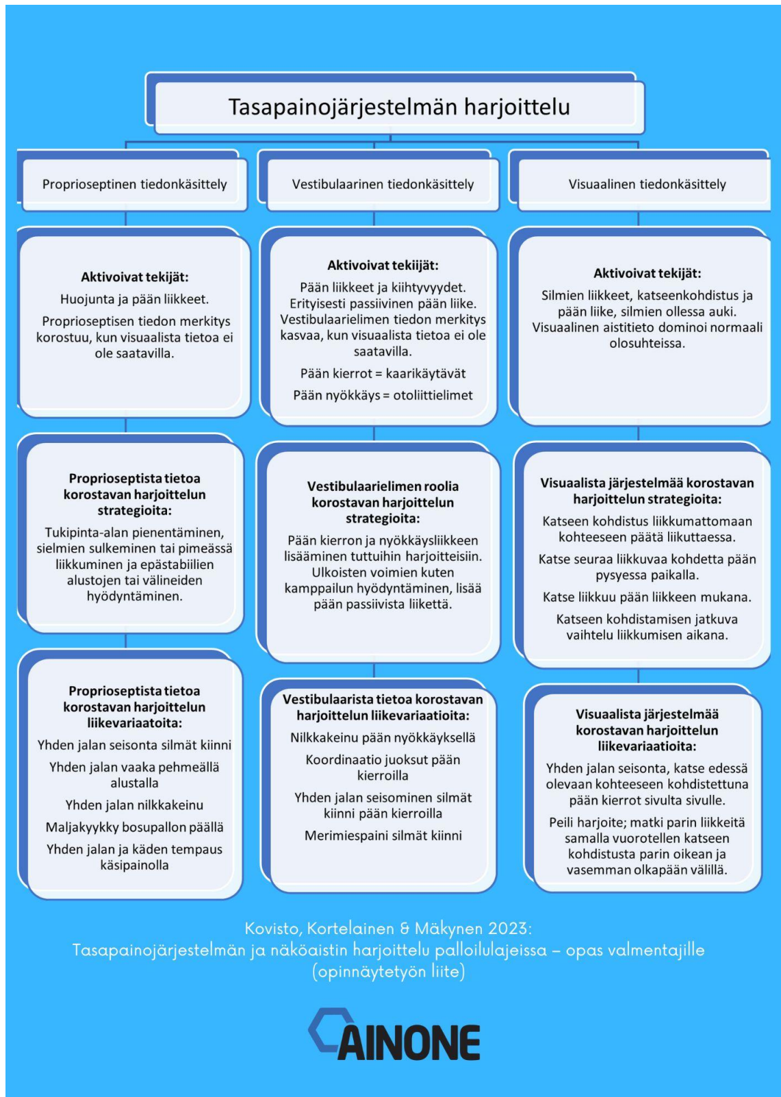
Liite 2 Tasapainojärjestelmän harjoittelu