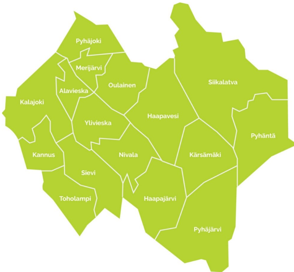
KUVA 1. Vestia Oy:n toimialue (Vestia Oy 2021)

Vestia Oy toimii omakustannusperiaatteella ja yhtiö ei jaa osinkoa (Vestia Oy 2012). Mahdollinen hyvä tulos jaetaan kuntalaisille edullisina hintoina sekä tehokkaina ja laadukkaina palveluina. Yhtiön toimintakustannukset katetaan kuntalaisilta kerättävillä jäte- ja perusmaksulla, kertymä muodosti yhteensä (90 %) kaikista tuloista, hyötyjätteiden myynnillä ja muilla palveluilla (10 %). Vestia Oy:n toimialueen jäteastian tyhjennys hinnat ovat samansuuruiset jokaisessa kunnassa. Liikevaihto oli 9,47 milj. euroa vuonna 2021 (8,94 milj. euroa vuonna 2020). (Vestia Oy 2012, 2021.)