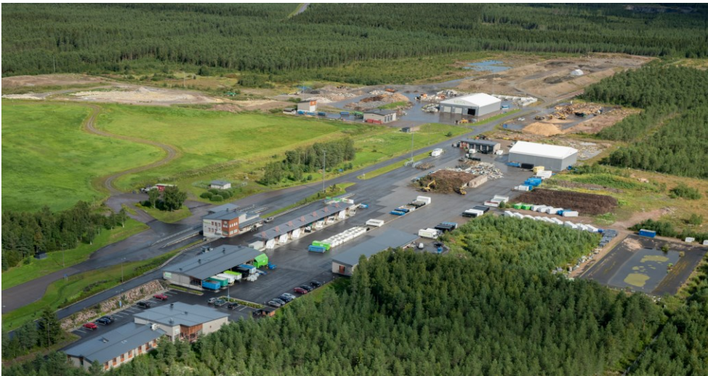
KUVA 1. Ylivieskan jätekeskus. (Vestia Oy 2021)

Päätoimipaikkana toimii Ylivieskan jätekeskus (KUVA 1), jonka kokonaispinta-ala on noin 40 hehtaaria ja jossa käsitellään kaikki kerätty ja vastaanotettu jäte. Hyötyjätteet välivarastoidaan erillisille niille varatuille käsittelykentille. Pilaantuneille maille löytyy oma varastointi- ja käsittelykenttensä. Biojäte kuljetetaan Stormossenille, joka valmistaa biomassasta biokaasua. Poltettava jäte kuljetetaan osittain Vestia Oy:n omistamaan Westenergy Oy:n jätteenpolttolaitokseen, jossa jätteestä tuotetaan sähköä ja kaukolämpöä. Kaikesta puujätteestä tehdään puuhaketta, joka menee voima- tai kaukolämpölaitoksille. Vestia Oy:ltä lähtee jatkokäsittelyyn myös metallia, kartonkia, sähkö- ja elektroniikkaromua sekä vaarallista jätettä. (Vestia Oy 2018, 12.)