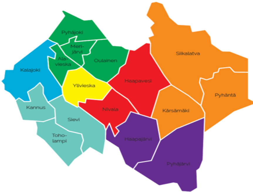
KUVA 3. Urakka-alueet (Vestia Oy 2023)

Vestian asiakaspalveluun tuli vuoden 2021 aikana yhteydenottoja 12 487 puhelua ja sähköposteja noin 9000 kappaletta. Yhteydenotot puhelimitse koskevat jäteastian tyhjennyksiä, muuttoja, uusien kohteiden ilmoittamista jätteenkuljetusreitille, ylimääräisiä tyhjennyksiä ja lajitteluneuvontaa. (Vestia Oy 2021.)