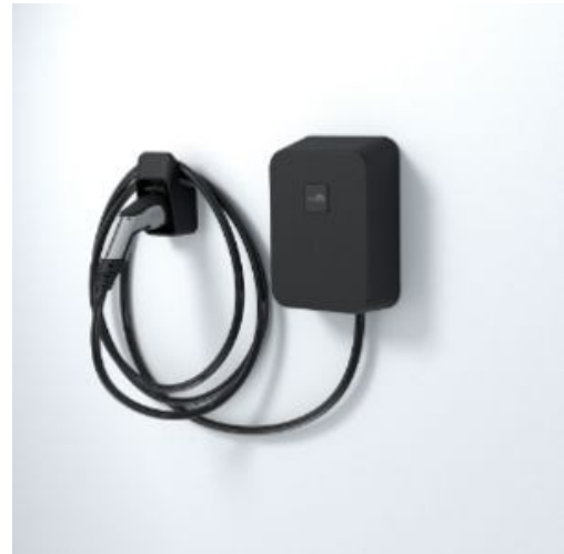
Kuva 2 Kiinteälatausasema kiinteällä latausjohdolla (Lataustapa 4)