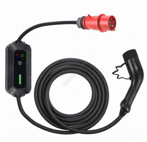
Kuva 1 Kolmivaiheinen pistorasialiitännäinen latausasema (Lataustapa 2)