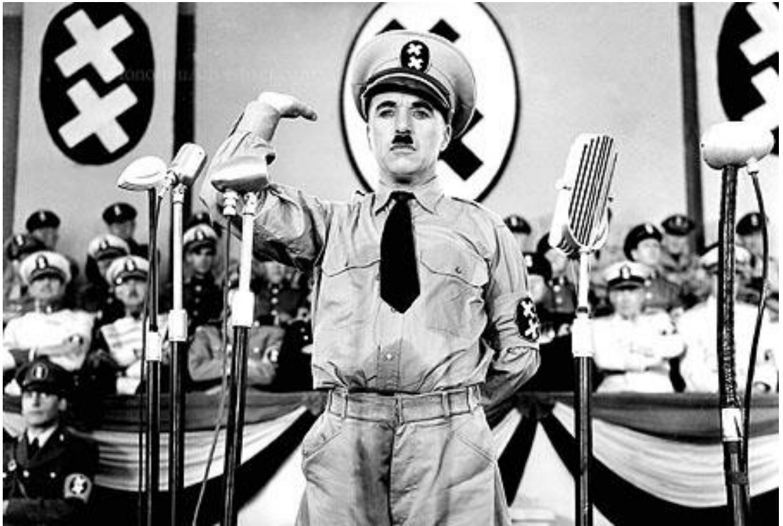
Kuva 1. Diktaattori (1940) muodostaa tarkoituksellisen ironian.

logiikan ymmärtämisen kannalta on hyödyllistä hahmottaa millaisessa valossa elokuvan tapahtumat ovat nähtävissä.