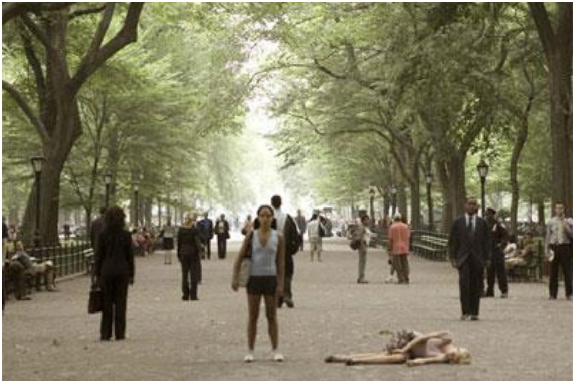
Kuva 5. The Happening on analogia yhteiskunnasta.

Analogia on ilmeinen. Jos emme tee jotain omista teoista johtuville todellisille uhillemme, olemme pian mennyttä.