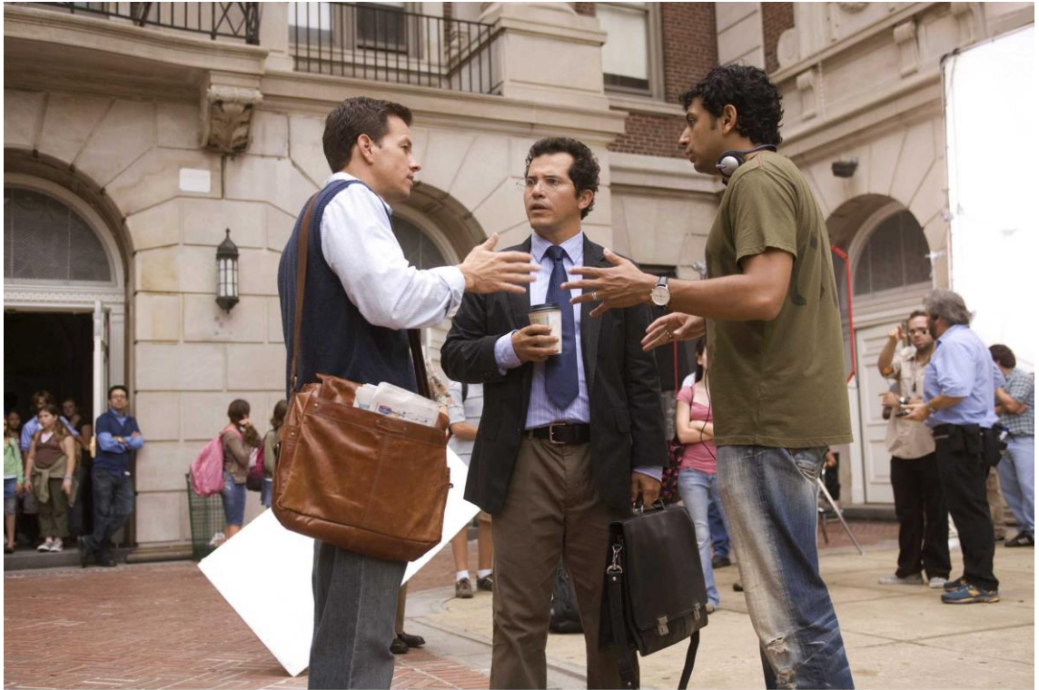
Kuva 3. Shyamalan ohjeistaa näyttelijät tarkkaan. 2008.