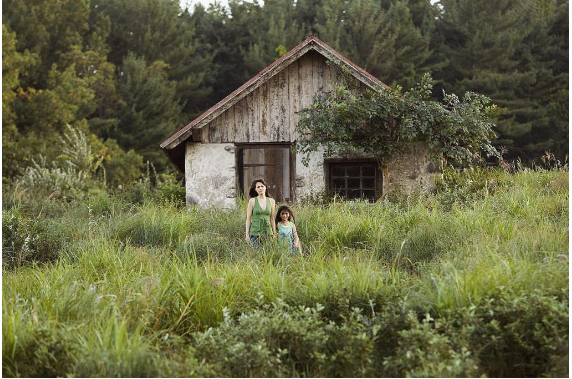
Kuva 4. The Happening issa maaseudun taloilla on allegorinen funktio.

The Happeningin sisäistekijän voi nähdä kertovan blockbusteria parodioivan b-elokuvan kehyksissä allegorista tarinaa. Talot toimivat tarinassa eräänlaisina sijainteina päähenkilöiden tunnemuistissa ja muut henkilöt blokkeina, joita he ovat välilleen rakentaneet. Elliotin ja Alman parisuhde on taas nähtävissä vasten ihmiskuntaa, joka on aiheuttanut luonnonkatastrofin ja pakenee sen seurauksia.