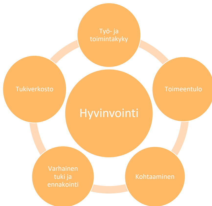
Kuvio 3. Opinnäytetyön pääteemat

Tässä luvussa kerromme haastatteluiden (n=6) tutkimustuloksista pääteemojen mukaan. Kaiken perustana on hyvinvointi, jonka huomioiden avaamme teemojamme: 1) työ- ja toimintakyky, 2) toimeentulo 3) tukiverkosto, 4) varhainen tuki ja ennakointi ja 5) kohtaaminen. Hyvinvoinnilla tarkoitamme ihmisen kokonaisvaltaista hyvinvointia, johon kuuluu sosiaalinen, psyykinen ja fyysinen hyvinvointi. Jokainen hyvinvoinnin osa-alue tarvitsee toistansa tukeakseen kokemusta hyvästä elämästä. Hyvinvoinnilla on suora vaikutus hyvään terveyteen, joka yhdistettynä hyvään työkykyyn luo merkittävän vaikutuksen elämänlaatuun (Hult jne., 2020).