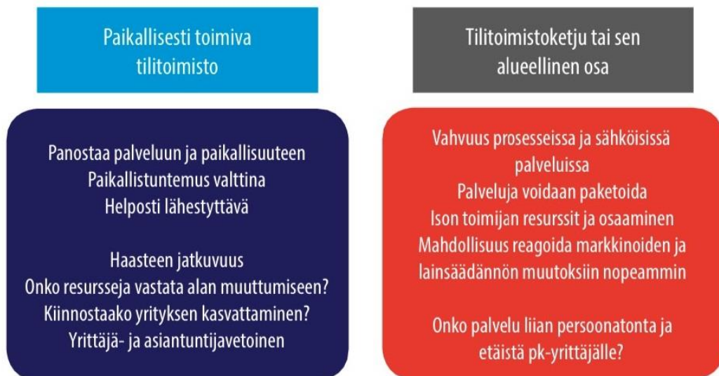
KUVA 1. Polarisoitunut taloushallintoala 2

Taloushallintoalalla on jo jonkin aikaa ollut nähtävissä jakaantumista pieniin paikallisesti toimiviin tilitoimistoihin ja suurempiin tilitoimistoketjuihin. Työ- ja elinkeinoministeriön (2019) tuoreimmassa taloushallintoalan toimialaraportissa (kuva 1) kuvataan alan polarisoitumista ja eri kokoisten tilitoimistojen eroavaisuuksia. 1