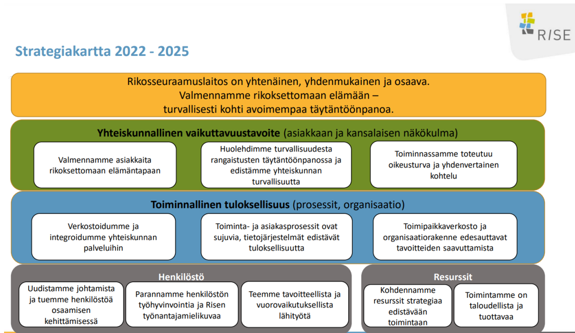
Kuva 1: Rikosseuraamuslaitoksen strategiakartta vuosille 2022-2025 (Rikosseuraamuslaitos 2022a).

tuloksellisuudesta, yhteiskunnallisesta vaikuttavuustavoitteesta ja henkilöstöön ja resursseihin liittyvistä strategisista tavoitteista. (Rikosseuraamuslaitos 2022a.)