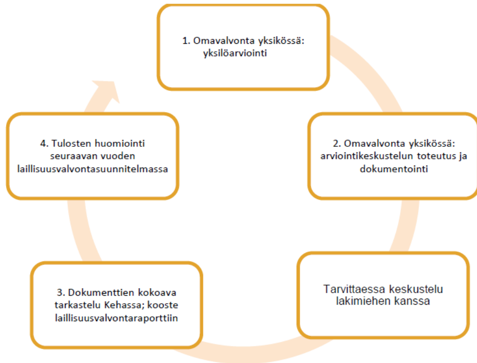
Kuva 2: Omavalvontamenetelmän prosessikaavio (Rikosseuraamuslaitos 2022h, 35).

käytettyjä työkaluja. Työkaluina tarkoitetaan arviointikäsi kirjoja itsearvointiin sekä asiakirja-pohjia ryhmäkeskustelun raportointiin. (Rikosseuraamuslaitos 2022g.)