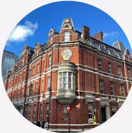
Church Street/Edmund Street

Nähtävyyksien kiertelyn ohella voi tutkia Birminghamin hyviä ostosmahdollisuuksia. Kaupunki tarjoaakin parhaimman valikoiman ostospalveluita Länsi-Midlandsin alueella. Kauppoja on tunnetuimmilta merkeiltä aina pienempiin putiikkeihin asti. Birminghamin pääkävelykadut New Street ja High Street ovat kaupungin kauppakadut, joiden varrelta löytyy lukemattomia määriä erilaisia myymälöitä. Ostosreissun jälkeen voi nauttia esimerkiksi teatteriesityksistä, konserteista, jalkapallon huumasta yleisössä tai kaupungin kukoistavasta yöelämästä.