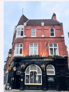
The Shakespeare pubi