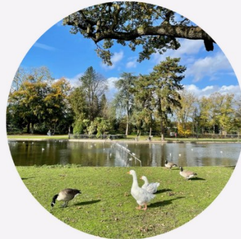
Lampi Cannon Hill Parkissa