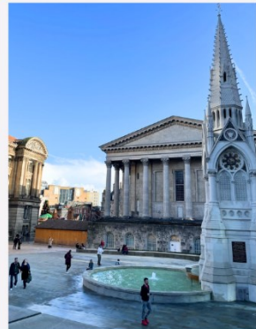
Victorian aukio ja kaupungintalo

Kuningatar Victorian mukaan nimetyllä aukiolla sijaitsee kaupungin Council House (1879) sekä Town Hall (1834). Council Housessa toimii museo- ja taidegalleria. Town Hall on valmistumisestaan asti toiminut musiikin, politiikan ja puhujien näyttämönä. Siellä on esiintynyt monia historiallisesti merkittäviä henkilöitä kuten kirjailija Charles Dickens ja säveltäjä Felix Mendelssohn.