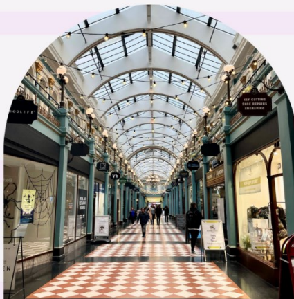
Great Western Arcade

Rag Market on yksi Ison-Britannian isoimmista sisätila markkinoista. Markkinoilla on noin 350 myyntipistettä ja siellä myydään muun muassa vaatteita, keittiötarvikkeita, kankaita ja koristeita. Hinnat ovat budjettiystävälliset.