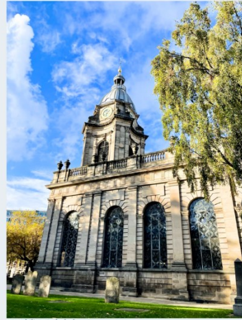
St. Philip's Cathedral