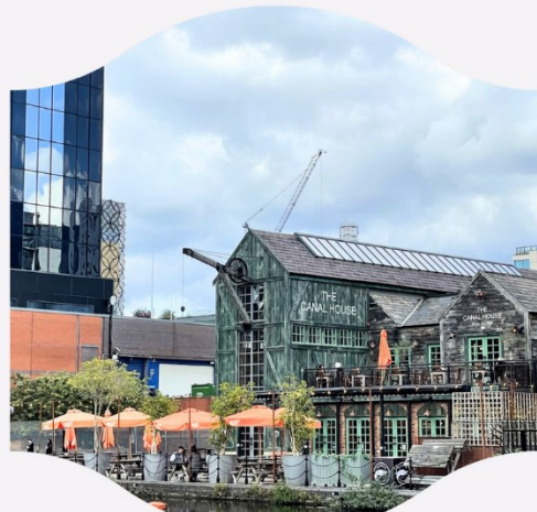
The Canal House ravintola