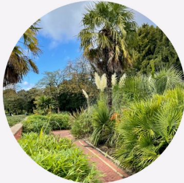
Cannon Hill Park