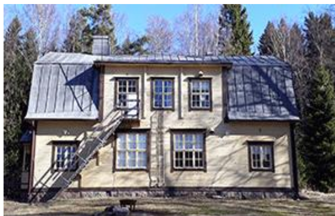
Kuva 2. Kuuselan koulu eteläsuunnasta