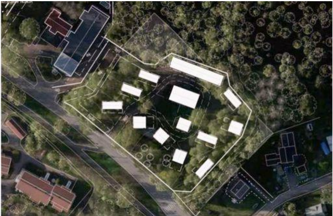
Kuva 1. Rakennekuva Kuuselan minitalokylästä, koulu kuvassa keskellä (suurin rakennus)

Hamarin kylässä meren äärellä Porvoossa sijaitsee vuonna 1913 valmistunut Kuuselan koulu eli Haikko-Gammelbacka lägre folkskolan. Koulu rakennettiin Sahasaarilla sijaitsevan höyrysahan työläisten lapsille ja koulukäytössä se on ollut aina vuoteen 2018 asti. Koulu peruskorjataan alkuperäistä ilmettä mukailevaksi. Koulun päädyssä olevaa kaksi opettajan asuntoa kunnostetaan asuinkäyttöön. Toinen vuokrataan varsinaiseen asumiskäyttöön, toiseen on kaavailtu airbnb- ja työhuonetoimintaa. Rakennuksen huonejärjestys tulee säilymään