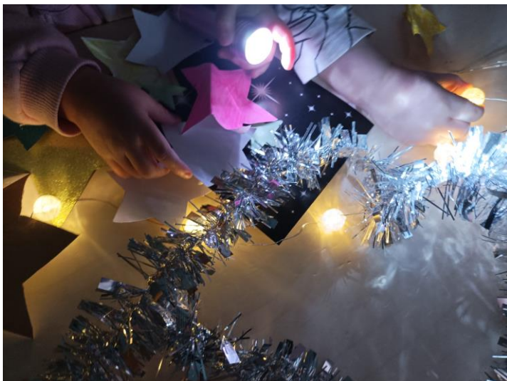
Kuva 33. Ensimmäisen toimintatuokion tähtijahdin loputtua lapsia tutkistelemassa kerättyjä tähtiä. Elina Kokko

vattaja kertoi, että toiminta oli mukavaa ja lapset selkeästi nauttivat toiminnasta. Erityisesti tällä toimintakerralla nousi esiin materiaalit. Kasvattaja piti ajatuksesta, että toiminnassa oli toisaalta paljon elementtejä toisaalta vähän. Salissa oli paljon ns. rekvisiittaa, mutta kuitenkin toiminta oli hyvin vapaamuotoista ja rekvisiittaa oli kaikki tähtiä eli samaa elementtiä.