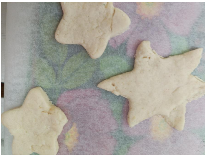
Kuva 20. Valmiita taikinatähtiä kuivumassa leivinpaperilla. Elina Kokko.