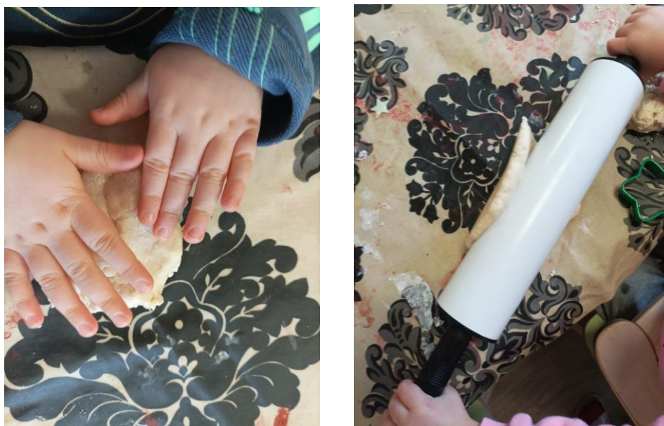
Kuva 16. Taikinan taputtelua toimintatuokiolla. Elina Kokko