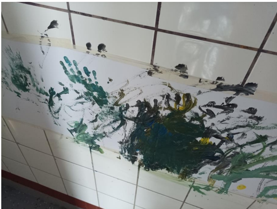
Kuva 25. Valmis maalaus kuivumassa seinällä. Lasten näkemys tähtitaivaasta tällä toimintakerralla. Maalauksessa näkyy värien sekoittamisen lopputulos ja ikuistettuna myös lasten kädenjälkiä. Elina Kokko.