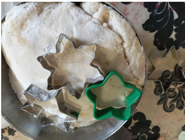
Kuva 1: Toimintatuokiosta 2. Taikinaa ja tähtimuotteja. Elina Kokko

Lähde: Pilke 2017. Saatavilla osoitteesta: https://www.pilkepaivakodit.fi/blogi-taikataikinan-ohje/ .