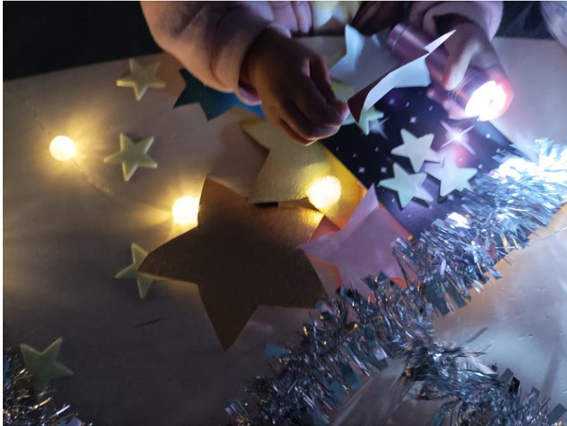
Kuva 10. Lapsi katselemassa löydettyjä tähtiä pöydän ääressä. Elina Kokko.

Katselimme, millaisia tähtiä oli löytynyt ja hieman laskimme niitä. Taskulamput olisivat vielä kiinnostaneet lapsia, mutta nostin ne sivuun, jotta saimme yhdessä lopetettua tuokiomme. Kellopelillä lapset saivat vuorotellen soittaa tähtiääniä, jonka jälkeen itse soitin tuiki tuiki tähtösen, jonka jälkeen yhdessä lauloimme tuiki tuiki tähtönen ja päätimme tuokion.