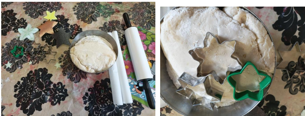
Kuva 13. Tarvikkeet valmiina tuokiota varten. Elina Kokko.