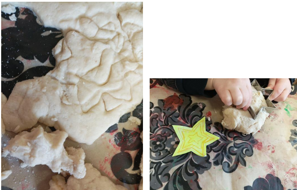
Kuva 18. Muotilla painettuja tähtikuvioita taikinassa tuokion aikana. Elina Kokko.