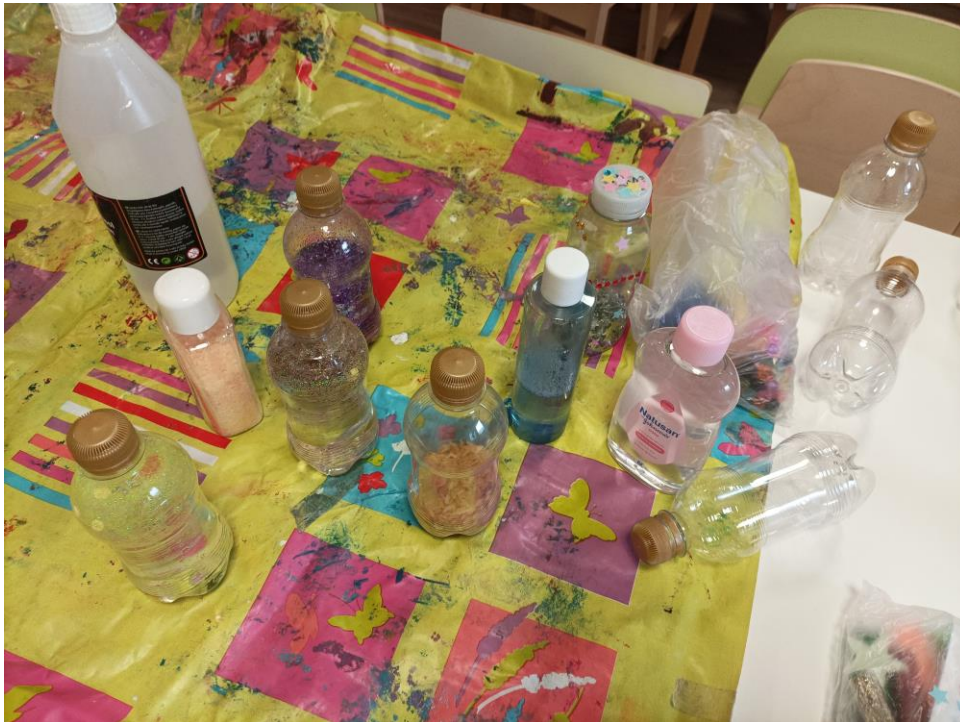
Kuva 2: Tuokiosta 4. Aistipullot ja tarvikkeet. Elina Kokko.