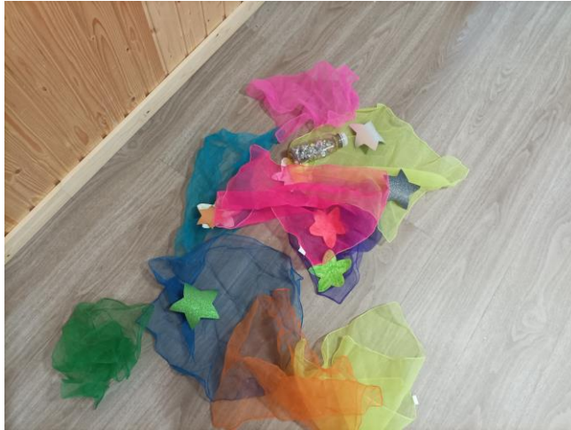
Kuva 7. Ensimmäistä toimintakertaa varten aseteltuja tähtiä ja huiveja. Elina Kokko.