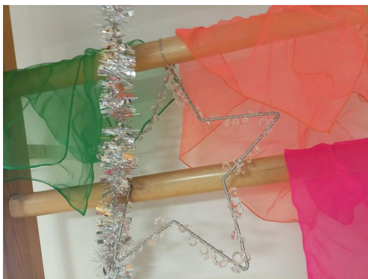
Kuva 6. Visuaalista oppimisympäristöä 1. toimintatuokiolla. Tähti ja revontulia. Elina Kokko.

Mahdollisuus vaikuttaa toimintaan ja toimintaympäristöihin vahvistaa sitoutumista toimintaan kertovat Kirby ym. (2003) Leena Turjan artikkelissa 2017. Kun yksilö kokee osallisuutta hänen uskonsa omiin mahdollisuuksiin kasvaa ja myös hyvinvointi lisääntyy. (Isola 2022). Lapsilähtöinen toiminta mahdollistaa luovuuden, leikin ja itsenäisyyden lasten oppimisprosessissa. Toiminnan ollessa lapsilähtöistä lapsi pääsee osalliseksi oppimisprosessiinsa, kasvattajien toimiessa mahdollistajina. (Hunter-Doniger 2021: 22.)