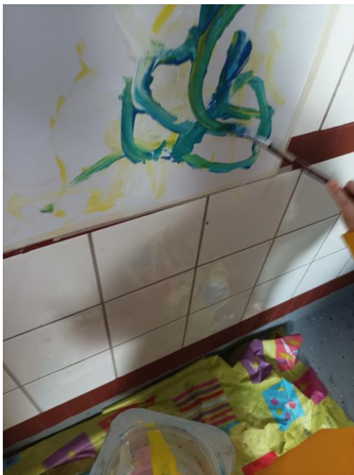
Kuva 22. Lapsi keskittyneenä maalaamassa siveltimellä ja tutkimassa värien sekoittumista. Elina Kokko

Olin näyttänyt pensselillä ilman maalia erilaisia liikkeitä, mitä pensselillä voi tehdä. Lapset innokkaasti kokeilivat. Kun yksi kohta paperia täyttyi maalista, kehotin lapsia siirtymään paperilla, ja he siirtyivätkin. Paperin lisäksi seinän kaakeli täyttyi mustan, keltaisen, valkoisen, sinisen, harmaan, turkoosin eri sävyistä, mutta se ei haittaa, sillä seinän saa helposti puhdistettua. Eräs lapsista sai käsiinsä vahingossa maalia ja tuli näyttämään sitä harmissaan minulle, mutta laitoin omaan sormeeni maalia ja sormen paperille niin harmitus lähti ja lapsi ”puhdisti” kätensä paperille ja ihasteli jälkeä. Tästä toinen lapsi innostui ja laittoi kätensä paperille ja paperille syntyi pieni kädenjälki.