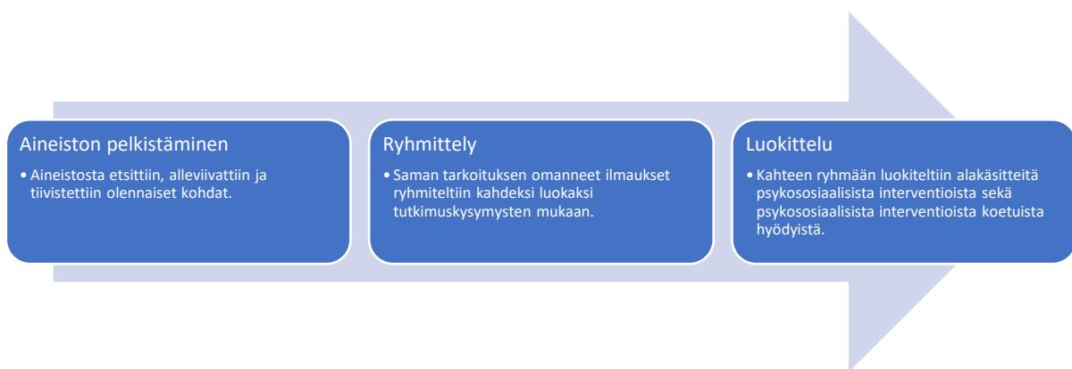
Kuvio 2. Aineistolähtöisen sisällönanalyysin vaiheet (Leinonen 2018, muokattu).

Tähän integratiiviseen kirjallisuuskatsaukseen valikoitui mukaan 11 englanninkielistä artikkelia opioidikorvaushoitoon liittyvistä psykososiaalisista interventioista. Valikoitunut aineisto käytiin huolellisesti läpi ja muodostettiin taulukot 3 ja 4, jotka auttoivat erottelemaan olennaiset asiat tutkimuskysymyksiin vastaten. Sulosaaren ja muiden (2006, 113) mukaan tulokset voidaan esittää taulukkona tai kuviona, joita käytettiin tämän katsauksen tulosten esittämisen tukena. Aineistolähtöistä sisällönanalyysia on tämän integratiivisen kirjallisuuskatsauksen osalta kuvattu tarkemmin kuviossa 2.