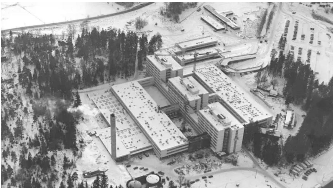
Kuva 2. Jorvin sairaala vuonna 1976.

Tämä peruskorjaus käsittää Jorvin sairaalan vuonna 1976 valmistuneen rakennusosan (kuva 2) osittaisen peruskorjauksen ja muutostyön, sekä tarvittavien väistötilojen toteuttamisen, joita projektin aikana olivat: (erillinen laboratorio ja näytteenotto). [3.]