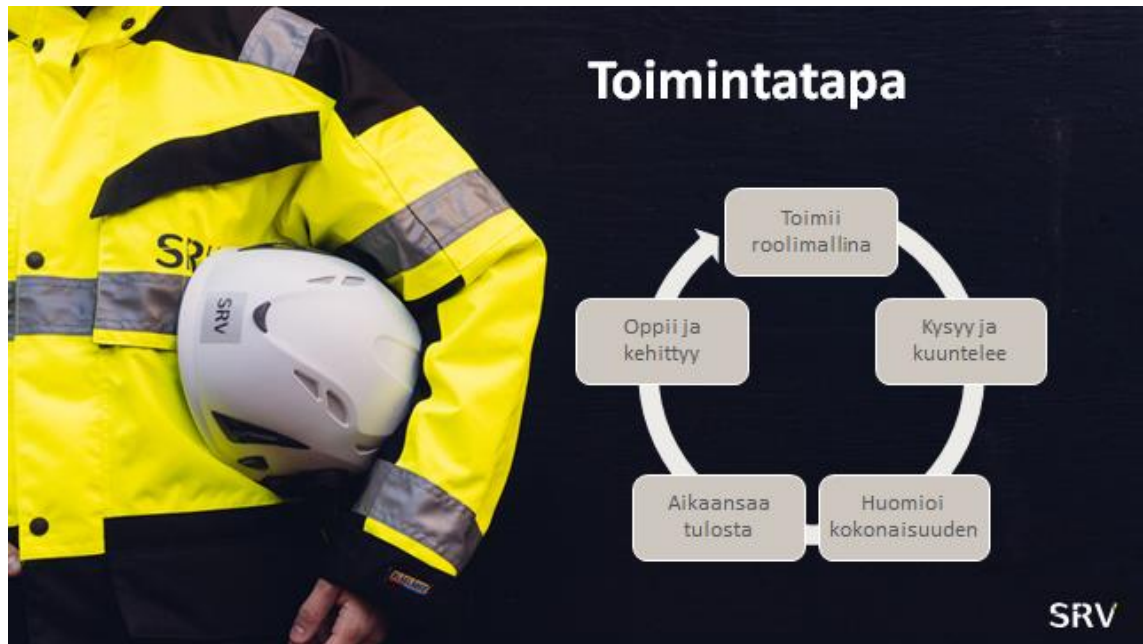
Kuva 1. SRV Rakennus Oy:n toimintatavan prosessi.

Toimintatapa sanoittaa tulosnälkäisen tarttumisen kulttuurin osaksi HR-prosesseja. Taulukossa on esitetty SRV Rakennus Oy:n toimintatavat (taulukko 1). Mallia hyödynnetään mm. kehityskeskusteluissa, arvioinneissa ja rekrytoinneissa. [2.]