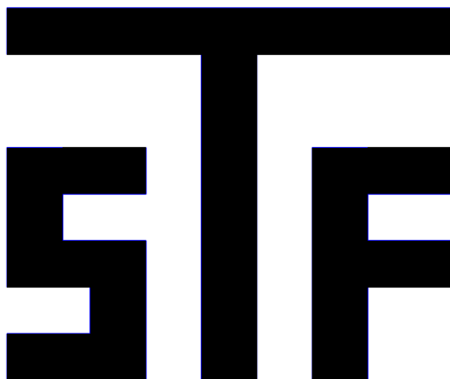
Kuva 5. Tyyppihyväksynnän merkki.

Jos rakennustuote on tyyppihyväksytty, niin sellaisen tuotteen merkitään tyyppihyväksyntämerkillä (kuva 5.). [11.]