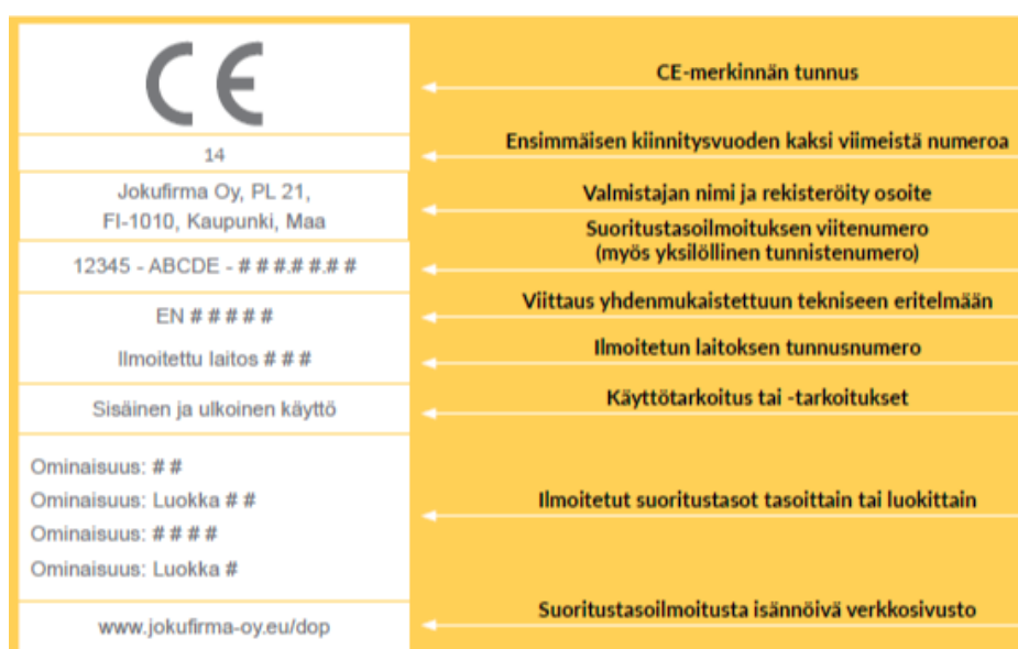
Kuva 4. Malliesimerkki tuotteeseen liitettävästä CE-merkinnästä. [10.]

CE-merkitty tuote on mahdollista hyväksyä käytettäväksi rakennushankkeessa, jos tämän materiaalin ominaisuudet soveltuvat sen käyttötarkoitukseen. CE-merkintä kertoo tuotteen tai materiaalin ominaisuudet ja tekniset vaatimukset kansallisten soveltamisstandardien määrittämässä laajuudessa ja muodossa (kuva 4). [6.]