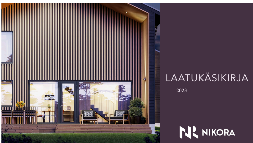
KUVA 3. Laatukäsikirjan kansilehti

Laatujärjestelmän sisällöksi luotiin ulkoasultaan yhteneväisiä dokumentteja ja asiakirjapohjia. Lisäksi käytettiin hyväksi yrityksellä jo olemassa olevaa aineistoa ja Rt-kortistosta kerättyä sisältöä. Laatujärjestelmään luotuja dokumentteja ovat tehtäväsuunnitelma-pohja, henkilöstön koulutuksen seurantarekisteri, työkalu- ja välineluettelo, työkone- ja ajoneuvoluettelo sekä organisaatiokaavio. Laatujärjestelmään luotuja asiakirjapohjia ovat lomake yrityksen lyhyen aikavälin tavoitteiden kirjaamiseksi, lomake yrityksen pitkän aikavälin tavoitteiden kirjaamiseksi, kehityskeskustelulomake, palautelomake, johdon katselmuksen pöytäkirja ja yleinen muokattavissa oleva asiakirjamalli. Rt-kortistosta kerättiin hyödylliseksi koettua materiaalia kuten työhajeita ja ohjeita erilaisten suunnitelmien laatimiseksi. Laatujärjestelmää täydentäväksi dokumentiksi luotiin myös yrityksen laatukäsikirja. Yrityksen laatukäsikirjasta rakennettiin visuaalinen ja kiinnostava kokonaisuus, yleisesti käytettävän pelkän tekstiä sisältävän laatukäsikirjan sijasta. Kuvassa 3 laatukäsikirjan kansilehti.