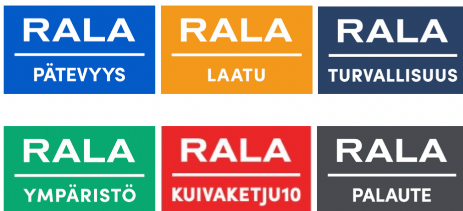
KUVA 1. RALA logot (RALA logot 2023.)

Sertifioidut yritykset voivat osoittaa toimintansa laatua RALA-logoilla omissa yritysmateriaaleissaan (RALA logot 2023.) RALA logot kuvassa 1.