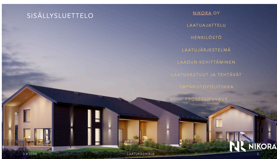
KUVA 4. Laatuksikirjan sisällysluettelo