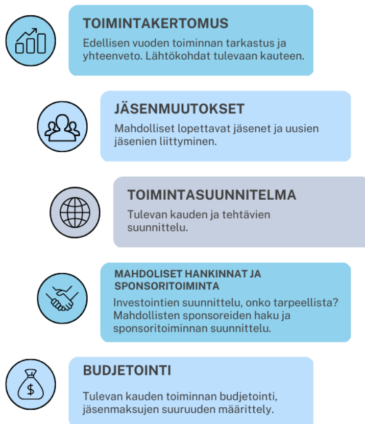
Kuva 2. Hallituksen kokouksen prosessikaavio

Yhtenä kehityskohteena on dokumenttien arkistointi. ”Tällä hetkellä ne ovat sähköpostissa tai hallituksen jäsenen tietokoneella, eli ihan miten sattuu”, sanoo hallituksen kolmas jäsen. Olen itse hänen kanssaan samaa mieltä siitä, että kaikki dokumentit olisi hyvä saada tiettyyn paikkaan, josta me kaikki neljä voisimme niitä tarkastella tarvittaessa. Nostan itse esille Google Drive ohjelmiston, joka on ilmainen käyttää ja vaatii vain gmail sähköpostin. Kaksi neljästä ei ole ennen käyttänyt tätä kyseistä ohjelmistoa, mutta kaikki kyllä tietävät mistä puhutaan. Tämä olisi mielestäni helppo ja yksinkertainen ratkaisu juuri tähän kyseiseen ongelmaan.