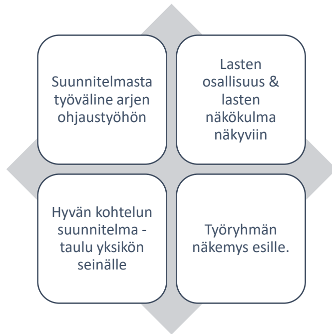
Kuvio 3: Suunnittelupalaverissa esiinousseet työelämäkumppanin toiveet.

Merkittävin kehittämisprosessin onnistumiseen vaikuttava yksittäinen osa-alue on suunnittelu- vaihe. Jotta kehittämishanke olisi tuloksekas toiveiden ja tavoitteiden näkökulmasta katsot- tuna, tulee huomiota kiinnittää erityisesti suunnitteluun ja valmisteluun. Hyvällä suunnittelu- työllä saavutetaan kustannustehokkuutta sekä vältetään ja vähennetään tulevia haasteita ja vaikeuksia kehittämistyön prosessin aikana. Vaikka suunnitteluvaihe esittääkin tärkeää roolia kehittämistyön prosessissa, on myös kyettävä arvioimaan, milloin suunnittelu on toteutettu riittävällä tasolla, ilman että kehittämistyön toteutus viivästyy. Suunnitteluvaiheen tarkoituk- sena on aikaansaada tilanne, jossa työskentely etenee johdonmukaisesti niin, että oikeita asi- oita tehdään oikealla tavalla. Lisäksi suunnitteluvaiheessa on tärkeää kyetä arvioimaan aika- tauluja sekä myös pysymään niissä. Työskentelyn tehokkuus ja resurssien oikea-aikainen hyö- dyntäminen ovat onnistuneen suunnitteluvaiheen kulmakiviä. (Heikkilä yms. 2008, 68.)