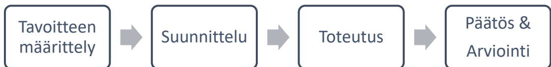
Kuvio 1: Kehittämistoimintaa kuvaava lineaarinen malli.