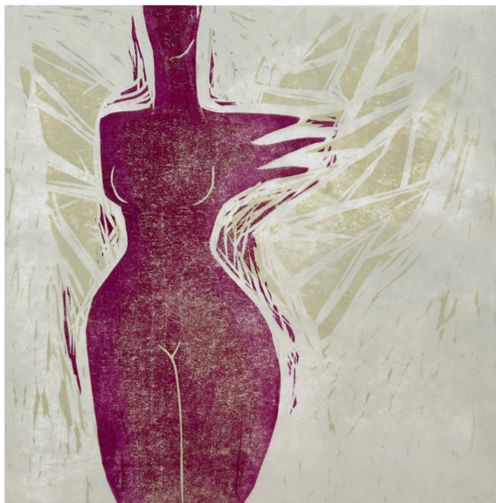
Kuva 5. Rakastettu, öljypuupiirros, 30x30 cm, 2023

Seuraavissa teoksessani vaihdoin katoavan puupiirroslaatan menetelmän useamman painolaatan käyttöön. Teoksessa nimeltään Rakastettu, kuvaan alastonta naishahmoa missä hahmon taustalle olen piirtänyt nyt jo lähes taustan väriin katoavat tyyllitellyt siivet (kuva 5). Tässä teoksessa rakkautta ja rakastetuksi itsensä kokeva naishahmo kuvastaa läheisyyden ja nähdyksi tulemisen merkitystä ihmisen elämässä Useamman painolaatan käyttö vapautti minut leikittelemään ja vapautuneemmin testaamaan teoksen ilmettä ja ilmaisua. Vedostin laatoilta useita, värimaailmaltaan hyvinkin paljon toisistaan eroavia teoksia. Teoksessa niin värivalinnat, kuin testaamani useat eri paperilaadut vaikuttivat teoksen ilmeeseen tunnelmaan huomattavan paljon.