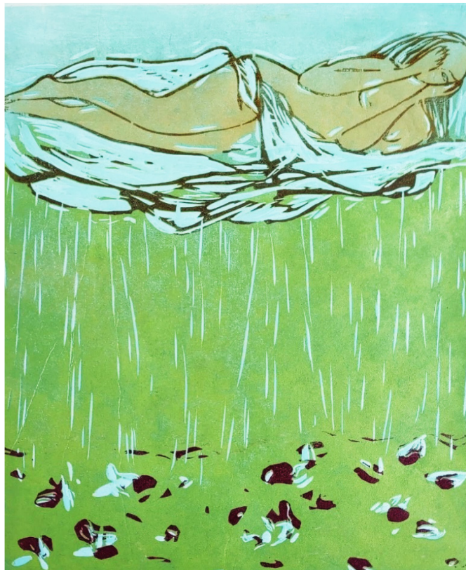
Kuva 4. Lumo, öljypuupiiirros, 30x45 cm, 2022

Työskentelin useiden pienten teosten parissa. Käytin useita eri kokoisia puupiiirros-laattoja ja niiden vedostamista erilaisille puupiirosapereille joko barenilla käsin hiertäen tai grafiikan prässä käyttäen. Mielestäni onnistuneiden pikkuteosten jälkeen palasin työskentelemään hieman isomman, Japanista tilaamani pehmeämpipintaisen shina-puupiiroslaatan pariin. Luonnostelin laatalle jo monia vuosia aiemmin suunnittelemaani aihetta, missä tarkoitukseni oli kuvata pilven päällä lepäävää naishahmoa, jonka kyynelistä syntyy sateen arvoitus (kuva 4). Luonnostelin laatalle monia eri versioita, mutta laatan koko ja se, että teoksen sommittelu säilyisi ryhdikkäänä ja mielenkiintoisena, ei useista luonnoksista huolimatta onnistunut kuvaamaan alkuperäistä ajatustani teoksen aiheesta. Teos, sai lopulta nimekseen Lumo.