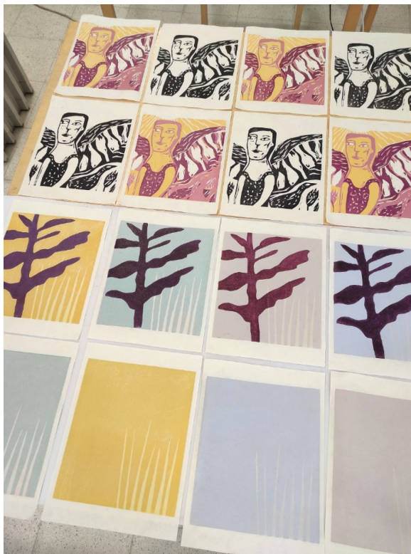
Kuva 1. Oman tiensä kulkija, öljypuupiirros, 23x20cm, 2021

Ensimmäiset valitsemaani aiheeseen syntyneet teokset syntyivät ollessani Heinävedellä Ina Collianderin jalan jäljissä -puupiirroskurssilla vuonna 2021. Teokset kuvaavat omaa tietään kulkevia ihmishahmoja. En osannut vielä kuvia luonnostellessa tarkemmin pohtia syitä, mutta piirsin teoshahmoilleni siivet, ehkä ikonitaiteen kuvamaailma vaikutti teosteni sisältöön ( Kuva 1 ). Sain vaikutteita myös Valamon luostarialueen puista ja kauniista, kuuluisaksi tulleesta kuusikujasta ja piirsin hyvin yksinkertaisella ja pelkistetyllä piirrosjäljellä teoksen Tammilehto ( Kuva 1 ). Näissä teosvedoksissa halusin yksinkertaisen piirrosjäljen lisäksi kiinnittää huomiota teoksen väripintoihin. Tavoitteena oli himmentää omaa, mielestäni liian värikylläistä ilmaisua. Käytin näissä teoksissa hienovaraisia, myös kuvaelementtien välisiä lähivärejä.