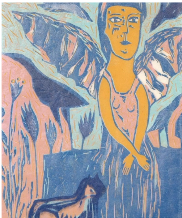
Kuva 2. Lintuja, kissoja ja muita siivekkäitä, öljypuupiirros, 37x31cm, 2021

Myöhemmin työskennellessäni jatkoin omaa tietään kulkevan ihmishahmon ajatusta, ja ikonitaiteeseen pohjautuvan teeman mukaisesti myös tämä hahmo sai itselleen siivet. Siivekäs olentoni, joka varmasti kuvaa elämäntarkoitusta etsivää omaa itseäni, sai rinnalleen kissa- ja lintuolentoja. Omasta mielestäni teoksen ilme toistuu edelleen liian räikeillä väreillä. Työskentelyssäni käyttämä yhden kaiverrettavan laatan öljyväripohjainen puupiirrostekniikka ei, esimerkiksi öljyvärimaalauksen tavoin mahdollista värien myöhempää korjaamista, vaan värin tulee olla harkittuna jo heti vedostusvaiheessa ( kuva 2 ). Suunnittelusta huolimatta värit rakentuvat työskentelyn ja vedostamisen edetessä, eikä aiempiin vedostuskerroksiin ole mahdollisuus enää vaikuttaa.