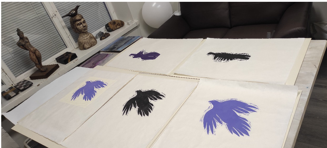
Kuva 6. Opinnäytetyöhön liittyvien kuva-aiheiden ja sisältöjen tutkiminen taidetyössäni jatkuu. Kuvassa aiheeseen liittyviä, valmisteilla olevia teoksia, 2023

Olen opinnäytetyöni aikana edennyt tavoitteissani toivomaani suuntaan. Yhtenäisemmän kokonaisuuden ja oman kädenjäljen vahvistamisen lisäksi jatkan työssäni vielä teosaiheiden syventämistä. Muokkaan teoksen kuvakieltä yksinkertaisemmaksi, pehmennän värien sävyjä ja käytän osassa teoksista maalauksellisempaa vedostusjälkeä (kuva 6). Kuvatakseni laajemmin elämän kirjoa olen siivellisten naisfiguurien lisäksi ottanut kuvamaailmaani mukaan myös maskuliinisia hahmoja, ja uteliasuuteni siivekkäiden olentojen merkityksistä niin eri uskonnoissa kuin taidemaailmassa sai minut tutkimaan luontoa ja lintujen maailmaa. Laajentaakseni teosten kuvamaailmaa olen tutkinut, luonnostellut ja piirtänyt ihmishahmoja ja tyyliteltyt lintuja kuvastamaan tärkeäksi kokemaani luontoyhteyden ja luottamuksen teemaa.