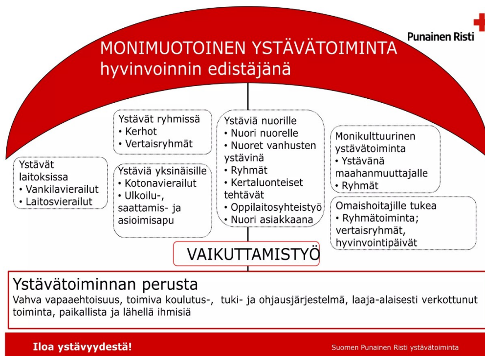
KUVIO 1. SPR:n ystävätöiminnan perusta (Hartikka, 2013)

Suomen Punaisen Ristin ystävätöimintä pitää sisällään eri-ikäisten parissa tehtävää monipuolista toimintaa. Kaaviokuva (Kuvio 1) näyttää toiminnan perustan.