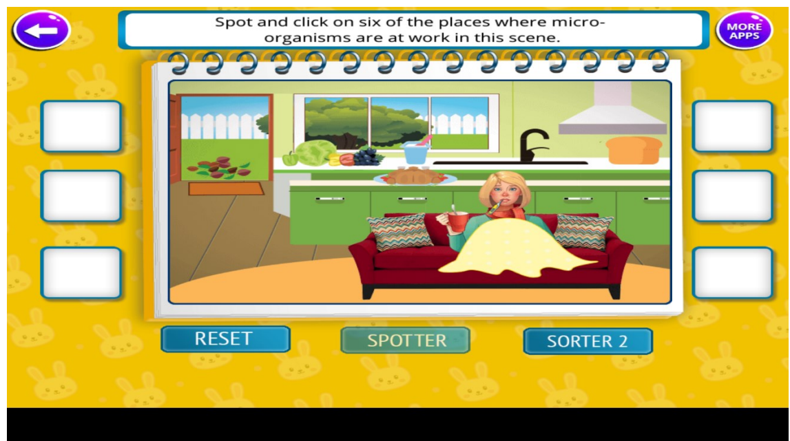
Kuva 4. Kuvakaappaus pelistä Kids Learn Science Experiments

Pelissä on valikko, josta päätetään, mitä minipeliä pelataan. Pelaajan valitessa pelin ruudulle tulee ohjeet, mitä pelaajan tulee tehdä. Jos pelaaja vastaa oikein, kuuluu ääniefekti, ja pelaajan vastatessa väärin pelaaja saa uuden yrityksen ja joissakin tapauksissa esiin voi tulla inforuutu, joka auttaa pelaajaa päättämään oikean vastauksen. Minipelin päätyttyä tulee esiin valikko, josta pelaaja voi palata takaisin päävalikkoon. Jokainen minipeli kattaa yhden aihealueen ja siinä voi olla useampi osio. Yksi minipeli kestää yleensä muutaman minuutin. Monissa minipeleissä on mahdollista saada lisätietoa näpätettävistä asioista. Useat minipelit ovat sanojen tai kuvien vetämistä oikeille kohdilleen tai oikeiden kuvien klikkaamista maisemasta. Esimerkkejä aihealueista ovat ihmisen luut, aistit, tietokoneen osat, eläinten luokittelu sekä ympäristön eläimet. Kuvassa 4 on minipeli, jossa harjoitellaan mikro-organismeja ja napautetaan niitä kuvasta.