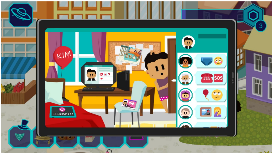
Kuva 7. Kuvakaappaus pelistä Spoofy

Pelissä on tarina, jossa pelaajan täytyy kerätä neljä koneen osaa eri paikoista. Pelaaja voi käydä paikat läpi haluamassaan järjestyksessä, ja ne on mahdollista pelata uudestaan läpi. Pelaaja voi valita yhden neljästä hahmosta, ja hän liikuttaa hahmoa sormella. Pelistä löytyy asusteita, joita pelaaja voi pukea hahmolleen tai muille pelin hahmoille. Pelaajan valittua paikan hänen pitää tehdä erilaisia tehtäviä, jotta hän saa koneen osan. Tehtävät ovat vastaamista kyberturvallisuuden liittyviin kysymyksiin ja erilaisten tavaroiden viemistä tietylle hahmolle, siis erilaisten hahmojen auttamista. Tarvittavat tavarat pitää joko etsiä ympäristöstä tai ne saa palkintona kysymyksiin vastaamalla. Esimerkkejä kysymyksistä ovat oikean vastauksen valitseminen keskustelussa, vahvan salasanan tekeminen, tärkeän informaation poistaminen nettiin menevistä kuvista, sekä huijauksien tunnistaminen. Tehtävää ennen puhuteltava hahmo kertoo tilanteen, johon tehtävä perustuu. Tehtävän jälkeen pelaajan hahmo kertoo lisätietoa kyberturvallisuudesta ja neuvoo, miten pitäisi toimia vastaavassa tilanteessa. Kuvassa 7 pelaajan täytyy näpäyttää yksityistä tietoa antavia asioita, jotka kuvasta pitäisi poistaa, ennen kuin sen laittaa nettiin. Sivussa olevat hymiöt auttavat pelaajaa keksimään oikeat asiat.