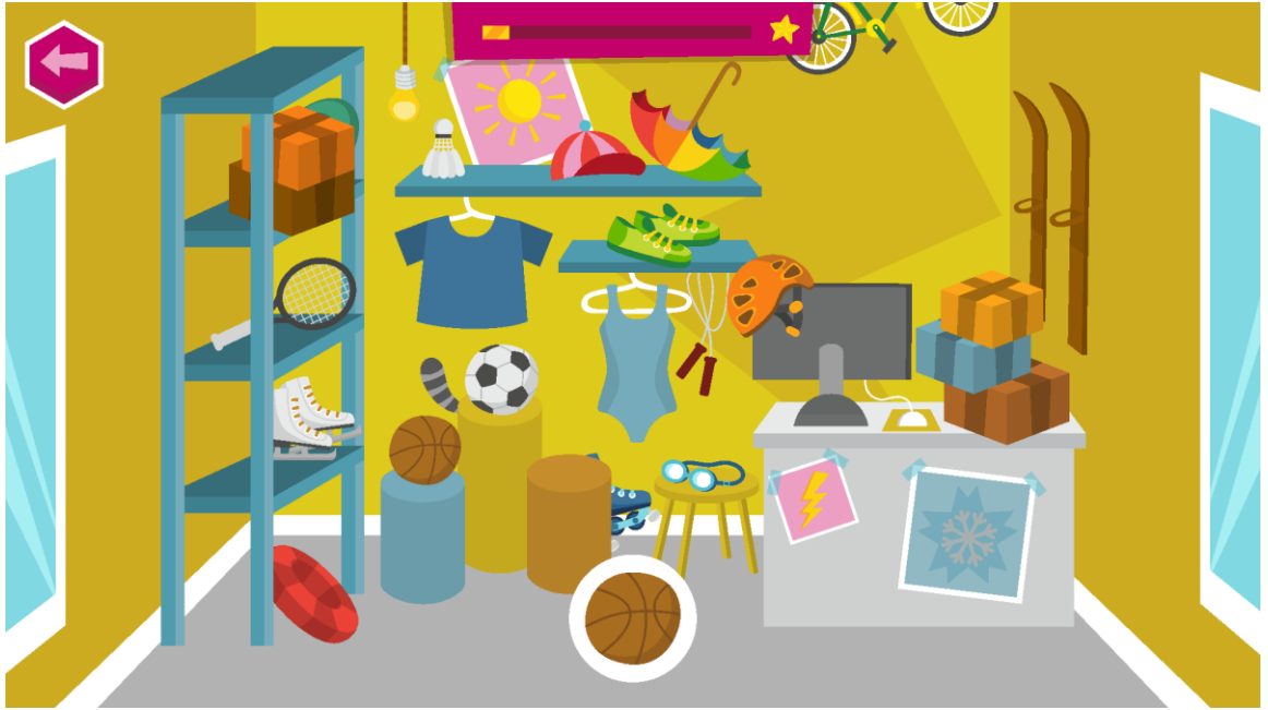
Kuva 6. Kuvakaappaus pelistä Pikku Kakkosen Eskari

Pelissä on yksinkertaiset ja värikkäät grafiikat, jotka miellyttävät lapsia. Ohjeet ovat myös selkeät. Jos pelaaja miettii vastausta pitkään, peli voi toistaa ohjeet ja antaa vihjeitä ratkaisuun. Äänet ja äänitehosteet ovat myös hyvin toteutettu. Hahmolle hankittavien esineiden kerääminen ja hahmon huoneen sisustaminen niillä voi motivoida pelaamaan enemmän. Aihealueiden pelit ovat erilaisia ja niissä voi olla useita erilaisia minipelejä, jotka tuovat sopivasti vaihtelua pelaamiseen.