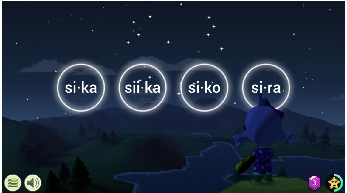
Kuva 5. Kuvakaappaus pelistä Ekapeli Alku

hän voi ostaa uusia asusteita ja väri vaihtoehtoja hahmolleen. Hahmo näkyy minipeleissä joko taustalla tai pelattavana hahmona, ja se myös nyökkäilee ja pudistaa päätään pelaajan vastauksen mukaan. Kuvassa 5 pelaajan täytyy valita äänen lausuma sana neljästä vaihtoehdosta.