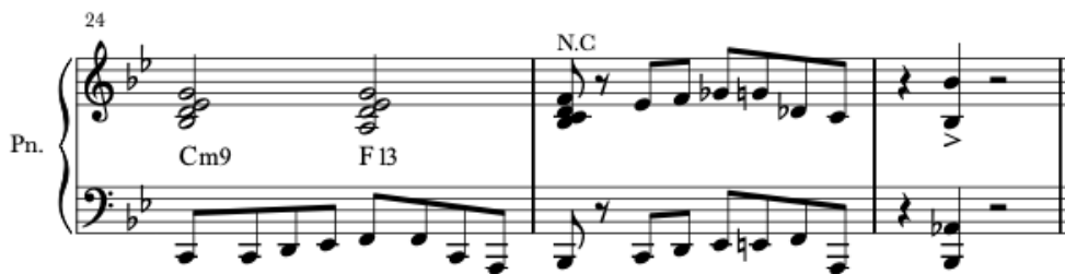
Kuva 5. Kasari tuli takaisin, tahdit 24–26. (Saarijärvi 2022a.)

Komppausharjoitus loppuu vasemman ja oikean käden terssikuljetukseen kahdeksasosa rytmisä. Lopuksi soitetään painokkaasti Bb-sävel tuplaoktaaveina viimeisen tahdin toiselle neljäsosalle.