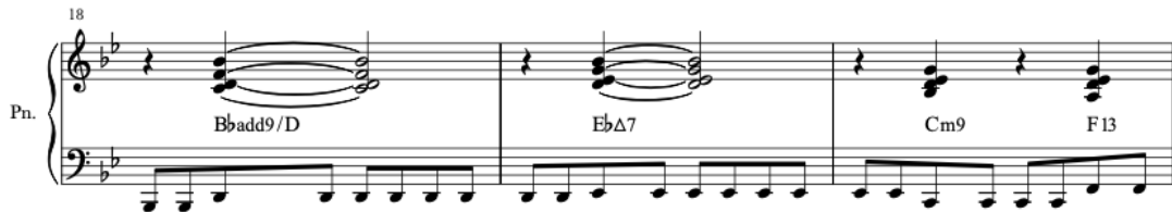
Kuva 4. Kasari tuli takaisin, tahdit 18–20. (Saarijärvi 2022a.)

Tahdista 18 eteenpäin oikeassa kädessä soitetään sointuja pääosin tahdin toiselle neljäsosalle tai tahdin toiselle sekä neljännelle neljäsosalle. Vasen käsi toistaa samaa kahdeksasosa kuviota.