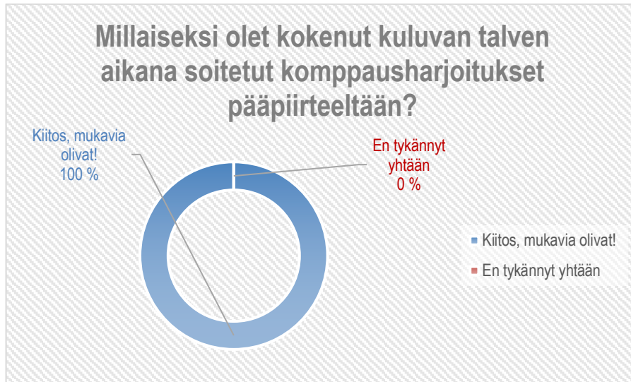
Kuva 26. Kysymys numero yksi. Vastaajien vastaukset.

Kysymyksessä numero yksi kysyttiin, millaiseksi oppilas on kokenut kuluvan talven aikana soitettut komppausharjoitukset?