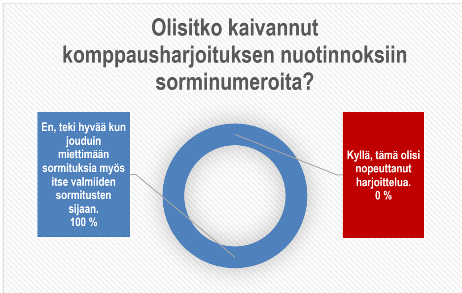
Kuva 27. Kysymys numero kolme. Vastaajien vastaukset.

Kysymys numero kolme koski komppausharjoitusten sormituksia. Kysymyksessä kysyttiin, olisiko oppilas kaivannut komppausharjoitusten nuotinnoksiin jo valmiita sorminumeroita?