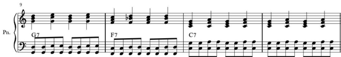
Kuva 17. Perjantai Blues, tahdit 9-12. (Saarijärvi 2022e.)

Variaatiossa yksi vasen käsi soittaa kahdeksasosarytmiin pohjautuvaa blueskomppaus kuviota, jossa kvintti- ja seksti-intervallit vuorottelevat. Oikea käsi soittaa neljäsosakomppausta sointuas-teilla I ja IV, tyylinmukaisesti painottaen tahdin toista- sekä neljättä tahdinosaa. Mikäli oppilaalla on haasteita hahmottaa kolmimuunteista fraseerausta, tässä harjoitteessa vasemman käden koostuessa pelkästään kahdeksasosa rytmikasta voi kolmimuunteista fraseerausta harjoitella kielikuvin. Tahdissa yksi vasemman käden kuvio kirjoitetaan sanamuotoon: ”ränt-tä-tänt-tä-ränt-tä-tänt-tä” ja tahti soitetaan kuten lausutaan, jokaisen tavun vastatessa yhtä kahdeksasosaa.