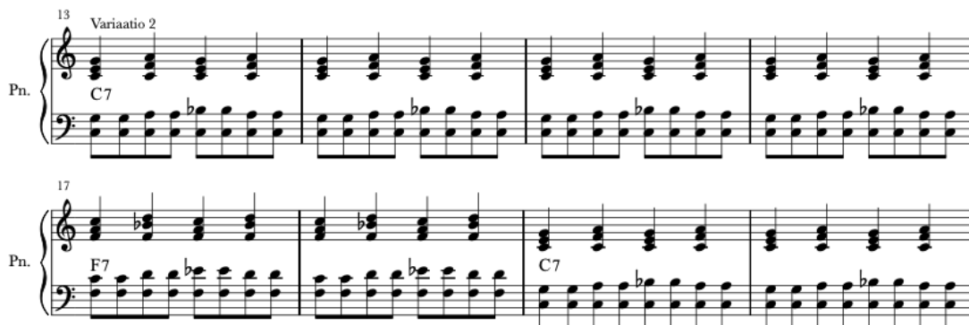
Kuva 18. Perjantai Blues, tahdit 13–20. (Saarijärvi 2022e.)

Variaatiossa kaksi tapahtuu muutos vasemman käden komppauskuviioon oikean käden astekuvi- on pysyessä verraten edelliseen variaatioon stabiilina. Kvintti- sekä sekstiasettelun lisäksi kuvi- oon lisätään käynti septimillä, tämä tehostaa hiljalleen bluesrakenteen hahmottamista ja nostaa tunnetilaa tulevaan variaatioon kolme.