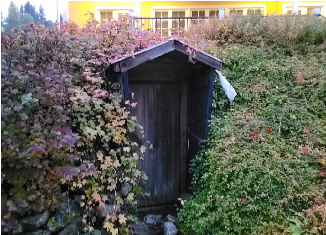
Kanamies-lyhytelokuvan kuvauspaikan maakellari

oli uskottavampaa. Emme lähteneet etsimään paikkaa, jossa kohtaaminen toimisi paremmin, mutta kuvauspaikka tarjosi kiinnostavamman tavan toteuttaa tarina ja hyödynsimme sitä.