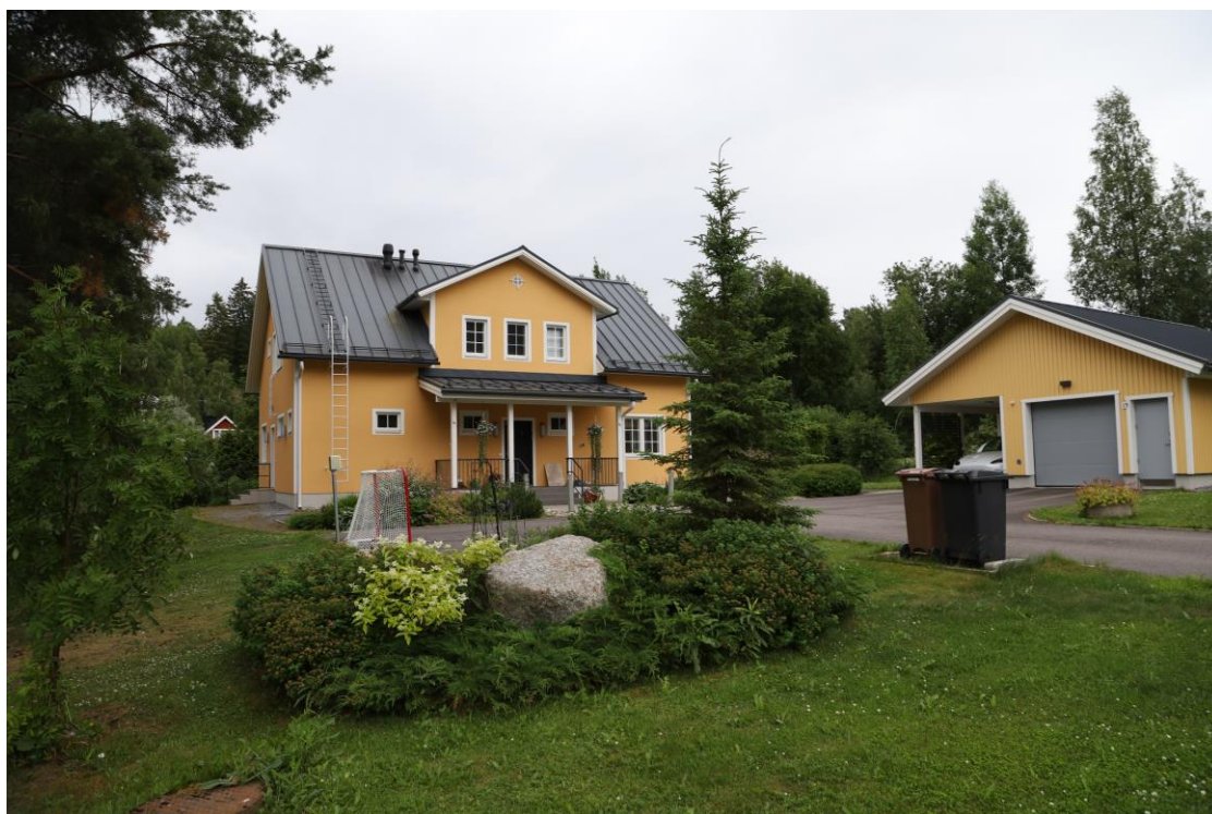
Kanamies-lyhytelokuvan kuvauspaikka (Kuva: Hilda Polamo 2022)

Kanamies-lyhytelokuvaan etsimme hyvin tarkkaa kuvauspaikkaa. Lyhytelokuvan pääkuvauspaikka oli värikäs omakotitalo, josta piti löytyä iso piha, autotalli, lapsen makuuhuone ja ympäröivää luontoa. Tässä tapauksessa piti myös löytää kuvauspaikka läheltä lapsinäyttelijöiden koteja, jotta heidän työaikaansa ei kuluisi matkustamiseen. Lähdimme siis ohjaajan kanssa kiertämään tiettyä asuinalueita jalan ja jätimme kuvauspaikkahaku-infopapin (Liite 2) hyvältä näyttäviin taloihin. Näiden hakujen kautta saimmekin oman suosikkivaihtoehtomme, joka täytti kaikki kriteerit. Tästä kohteesta kuva alla. Tämä työtapo toimi lyhytelokuvaan, jossa kaikki kohtaukset olivat tämän kuvauspaikan äärellä. Mutta ei välttämättä olisi kovin tehokasta ohjaajan ajankäyttöä esimerkiksi televisiosarjaan, jossa kuvauspaikkoja on runsaasti enemmän.