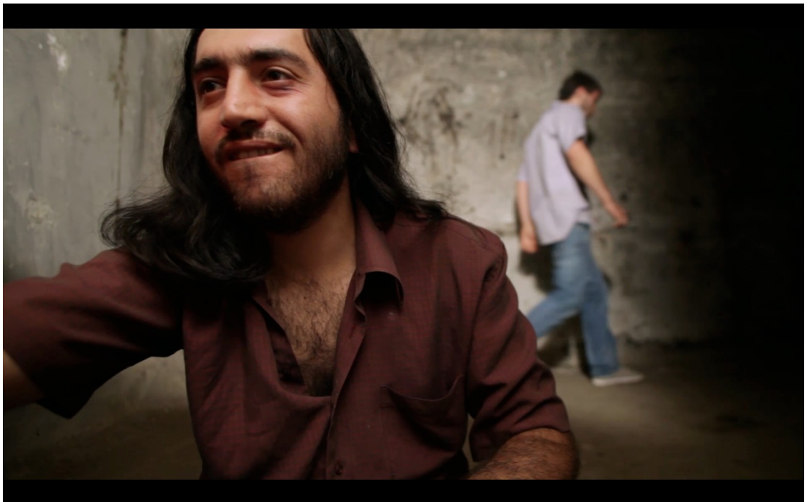
KUVA 2. Sellikohtaus lyhytelokuvasta Gregor

Toinen kohtaus onkin sellissä. Tässä kohtauksessa käytin off-screenia kolmesta eri suunnasta. Kuva alkaa niin, että eräs vangeista on aivan kameran edessä ja yrittää kaivertaa seinään. Tämä kyseinen seinä on kuitenkin off-screenissa, kameran takana. Taustalla on toinen vangesta, joka kävelee hermostuneena edestakaisin. Pian kuulemme oven avautuvan, joka on myös off-screenissä kuvan oikealla puolella. Näiden tietojen avulla tila pitäisi hahmottaa seuraavasti: oikealla puolella on ovi ja mahdollinen ikkuna, josta tulee valoa, on kameran takana ylhäällä. Jokaisessa sellikohtauksessa käytän seinän takaista off-screeniä, mistä kuulemme viereisen sellin vankien ääniä.