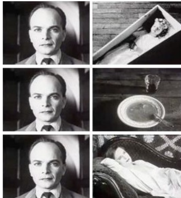
KUVA 1. Kuleshovin efekti (Boxclever Films 2012)

Kuuluisin montaasiajattelun esimerkki on Kulesovin efekti (Pirilä, Kivi 2008, 16). Tässä efektissä muuttumattomalla ilmeellä olevan miehen kasvot on liitetty tytön arkkuun. Sen nähtyään katsoja antaa merkityksen miehen tunteelle: mies on murheellinen. Katsoja saa erilaisen käsityksen miehen tunteesta kun saman miehen kuva leikataan keittokulhoon tai makaavaan naiseen. Kuvayhdistelmä keittokulhon kanssa ilmaisee ruokahalua ja makaavan naisen kanssa merkitsee himoa. Miehen kuva ja kasvot yksinään ei taas ilmaise näitä edellä mainittuja ollenkaan.