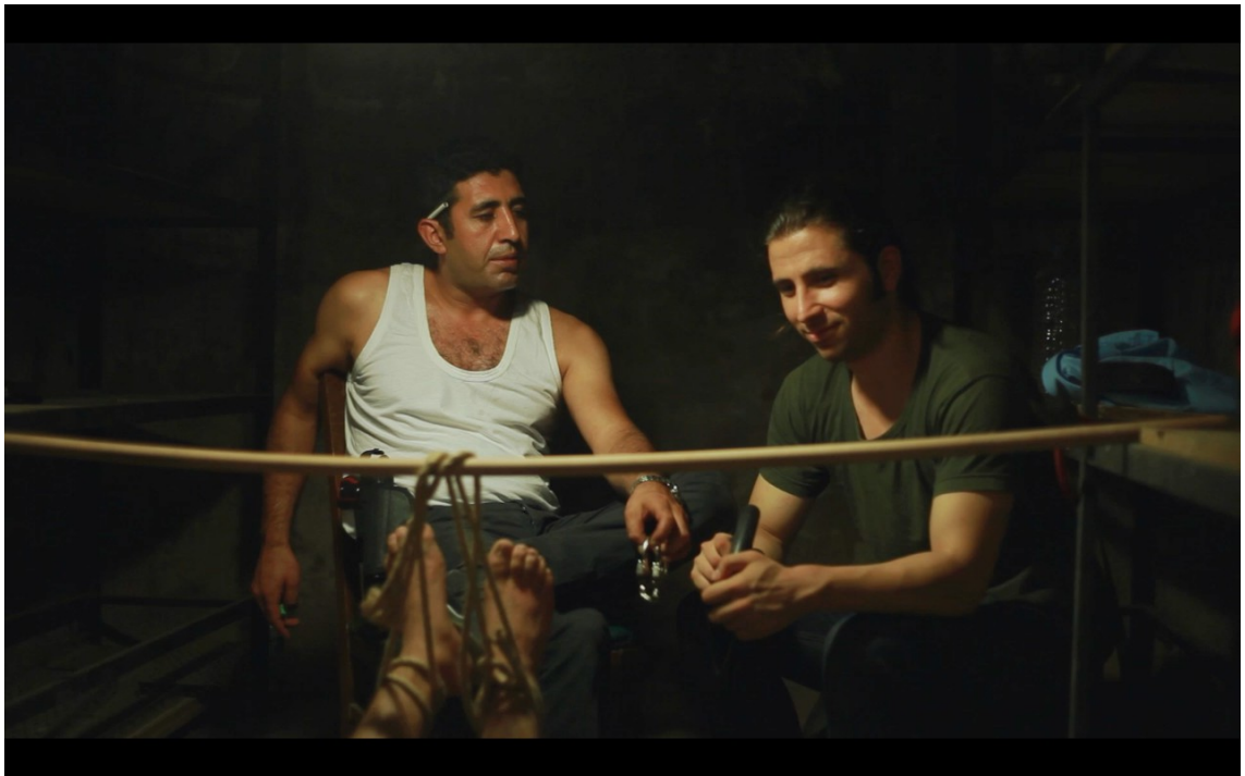
KUVA 4. Kidutuskohtaus lyhytelokuvasta Gregor