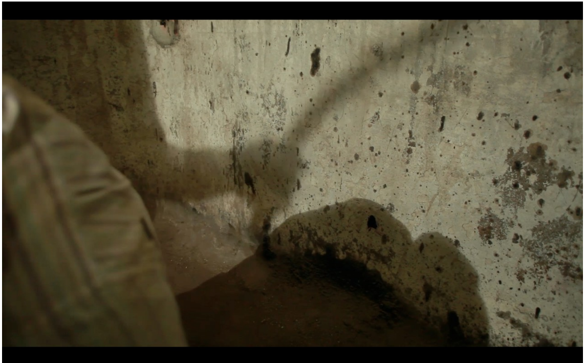
KUVA 5. Varjokuva lyhytelokuvasta Gregor

näky myös kuvassa ja liikkuu tietenkin yhtäaikaisesti varjonsa kanssa. Samassa kohtauksessa käytin myös sisällöllistä ellipsiä; hakkaamista ei näytetä suoraan loppuun asti vaan se nähdään varjon kautta.